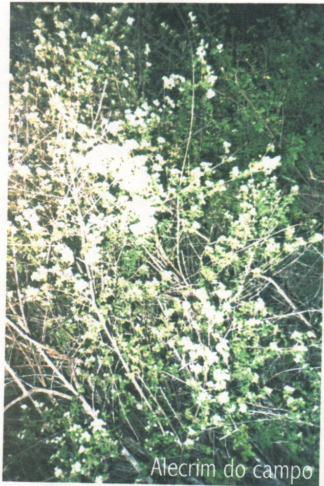
Alecrim do campo