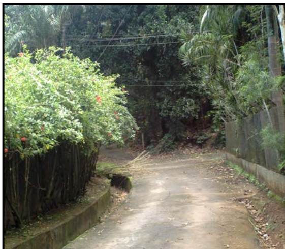
Figura 9: Acesso à Mata do Zôo

muito à observação dos animais. A Mata do Zôo e o horto não podem ser visitados, a biblioteca não está disponível e não há como inovar no sentido de se ofertar novas atividades, visto que a presença dos animais é um aspecto a ser considerado (Figuras 9 e 10).