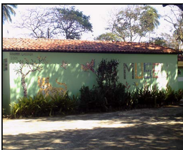
Figura 3: Museu (visão externa)

As visitas realizadas ao PZGV, tendo por base o acima dito, permitiram identificar algumas possibilidades de desenvolvimento de atividades de lazer pelo visitante: a contemplação, a educação, a de associação entre pessoas e atividades físicas (caminhadas). Tais possibilidades são trabalhadas por Camargo (1999) e algumas delas podem ser reunidas nas atividades turísticas de lazer quando o visitante em questão é um turista. São as estruturas e equipamentos existentes para que se conforme tais possibilidades: a biblioteca, a Mata do Zôo, o Cine Zôo Ambiental, o Zooberçário, o museu, as áreas de lazer, áreas externas do Parque, o horto e o acervo animal existente (Figuras 3 e 4).