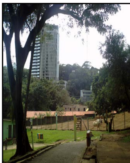
Figura 6: Edifício em construção próximo ao PZGV

Em relação à paisagem externa do Parque, vale dizer que ela própria acrescenta valor ao lugar, pelo vislumbre da natureza que propicia – mesmo que seja percebida a presença da ação humana através dos prédios existentes e em construção. Nesse sentido o PZGV, enquanto detentor dessas paisagens, além de ser uma grande área verde e de lazer, eleva o valor dos imóveis ao seu redor construídos. Segundo Alcântara (2008) condomínios de luxo vizinhos às áreas verdes tem um valor alto em relação a outros espaços da cidade – e isto não tem somente a ver com a concepção dos benefícios associados a tais áreas, consideradas como sinônimos de qualidade de vida, mas também ao próprio valor que a especulação imobiliária atribui à biodiversidade e às áreas recreacionais (Figura 6).