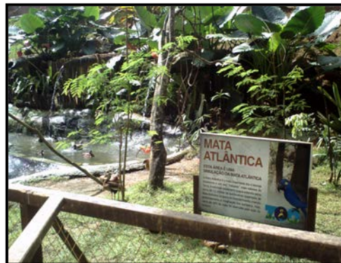
Figura 5: “Paisagem recriada” (Mata Atlântica)

Em relação à paisagem externa do Parque, vale dizer que ela própria acrescenta valor ao lugar, pelo vislumbre da natureza que propicia – mesmo que seja percebida a presença da ação humana através dos prédios existentes e em construção. Nesse sentido o PZGV, enquanto detentor dessas paisagens, além de ser uma grande área verde e de lazer, eleva o valor dos imóveis ao seu redor construídos. Segundo Alcântara (2008) condomínios de luxo vizinhos às áreas verdes tem um valor alto em relação a outros espaços da cidade – e isto não tem somente a ver com a concepção dos benefícios associados a tais áreas, consideradas como sinônimos de qualidade de vida, mas também ao próprio valor que a especulação imobiliária atribui à biodiversidade e às áreas recreacionais (Figura 6).