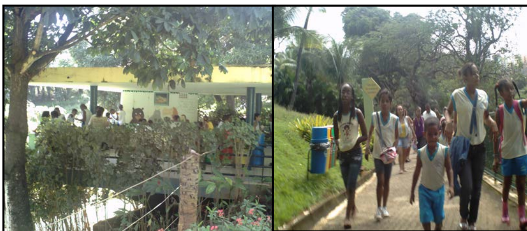
Figura 7: Atividade Aprendendo no Zôo

Quanto ao aspecto educativo, o Parque possui um conjunto de atividades que proporcionam o aprendizado sobre a importância de preservar e conservar o ambiente. Todas elas pertencem ao setor de Educação Ambiental do PZGV, e podem tanto ser realizadas no espaço do Parque quanto em escolas e instituições especiais de ensino, pelos profissionais e estudantes do setor. As que podem ser realizadas no próprio Parque são: Aprendendo no Zôo; Trilha na Mata do Zôo; Zôo Terapia e Cine Zôo Ambiental (Figura 7).