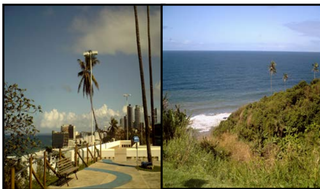
Figura 4: Paisagens do PZGV

ser vistos recriações dos habitats naturais dos animais, o que acrescenta muito à observação em termos de aprendizado (Figuras 4 e 5).