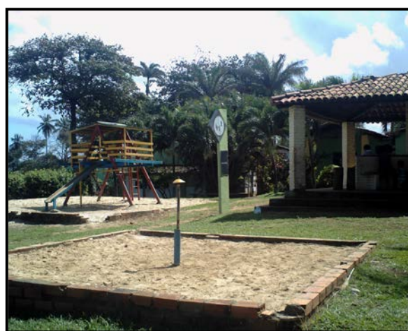
Figura 4: Área de lazer interna do PZGV

A contemplação/observação é, para Mohr (2003), uma atividade saudável não somente pelo contato íntimo com a natureza, mas também por representar uma agradável terapia de relaxamento que alivia o estresse do dia-a-dia e permite ainda que o indivíduo obtenha informações interessantes sobre o que é observado. Complementa o exposto Andrade (1997 apud LOPES; SANTOS, 2004, p. 103), ao dizer que “a observação realizada na natureza promove uma gratificante atividade de lazer e descontração, proporcionando [...] recompensas intelectuais, recreativas e científicas.