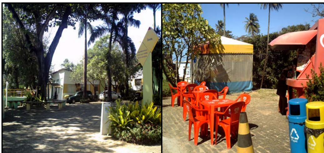
Figura 8: Locais propícios ao convívio social.

Devido ao formato do PZGV, seu relevo acidentado, é possível a prática de atividades físicas dentro do mesmo, dentre as quais se destaca a caminhada. Mesmo não sendo um espaço tecnicamente planejado para tal fim, o Parque constitui-se em um bom lugar para que se realize tal atividade, uma vez que as “subidas” e “descidas” exigem preparo e esforço físicos da pessoa. Na verdade, não só a isso se limita o caminhar, uma vez que sua realização contempla outros interesses pessoais: