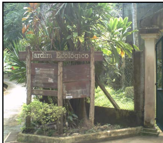
Figura 10: Horto