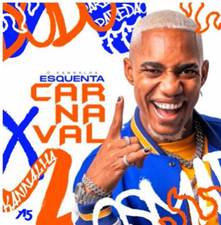
Figura 4: Foto do álbum, Esquenta Carnaval