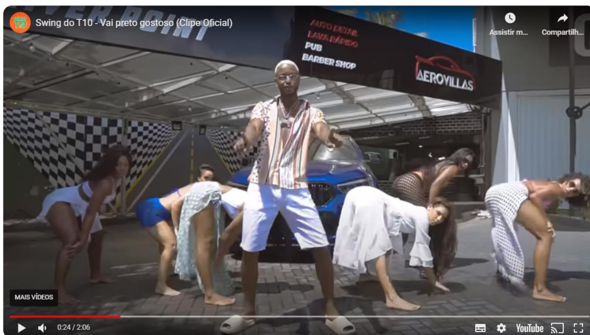
Figura 2: Vídeo clipe da música “Vai preto gostoso”