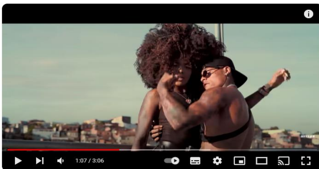
Figura 5: Foto do vídeo clipe “pirraça”