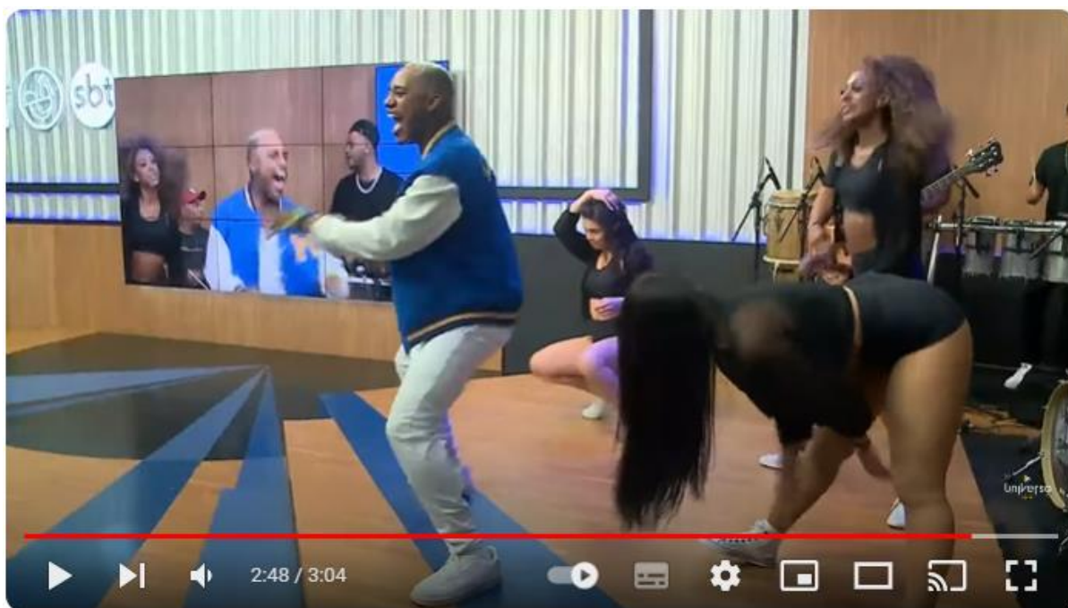
Figura 3: Apresentação do artista Kannalha, no programa de TV aberta, Universo.