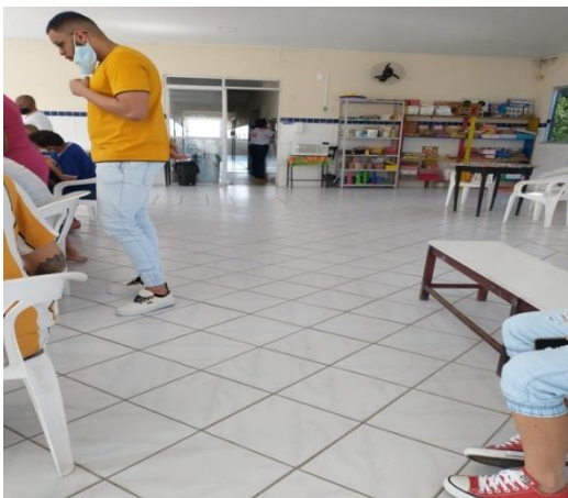
Figura 3: Sala de convivência no 1º andar