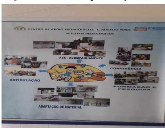
Figura 7: Painel de Apresentação do CAP