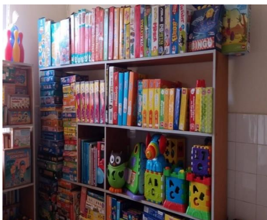
Figura 5: Brinquedoteca