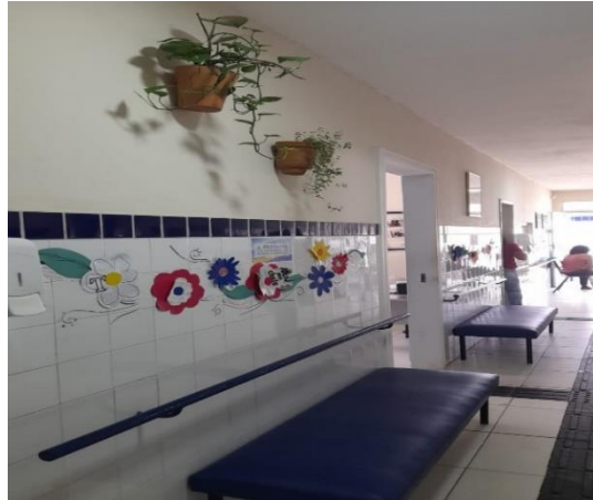
Figura 2: Corredor principal da instituição