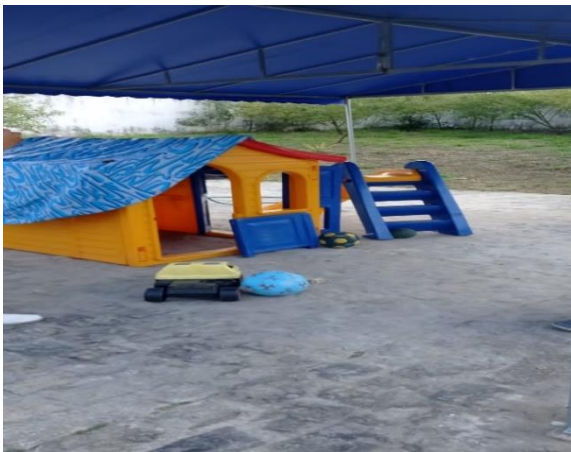
Figura 1: Parque infantil em área externa do CAP