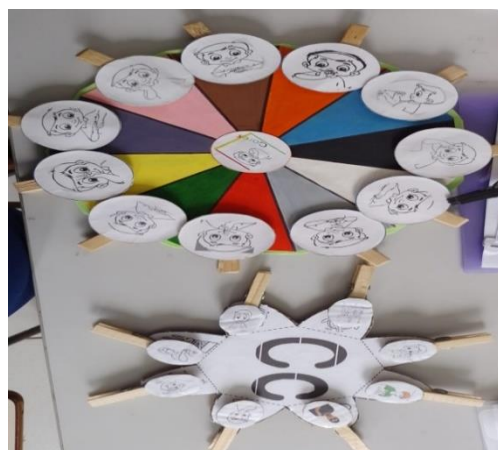
Figura 6: Jogos educativos