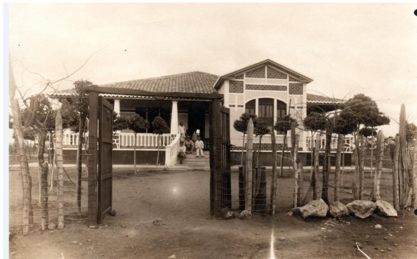
Figura 4: fachada do sanatório para tuberculosos em Carnaíba do Sertão entre os anos 1940 e 1946