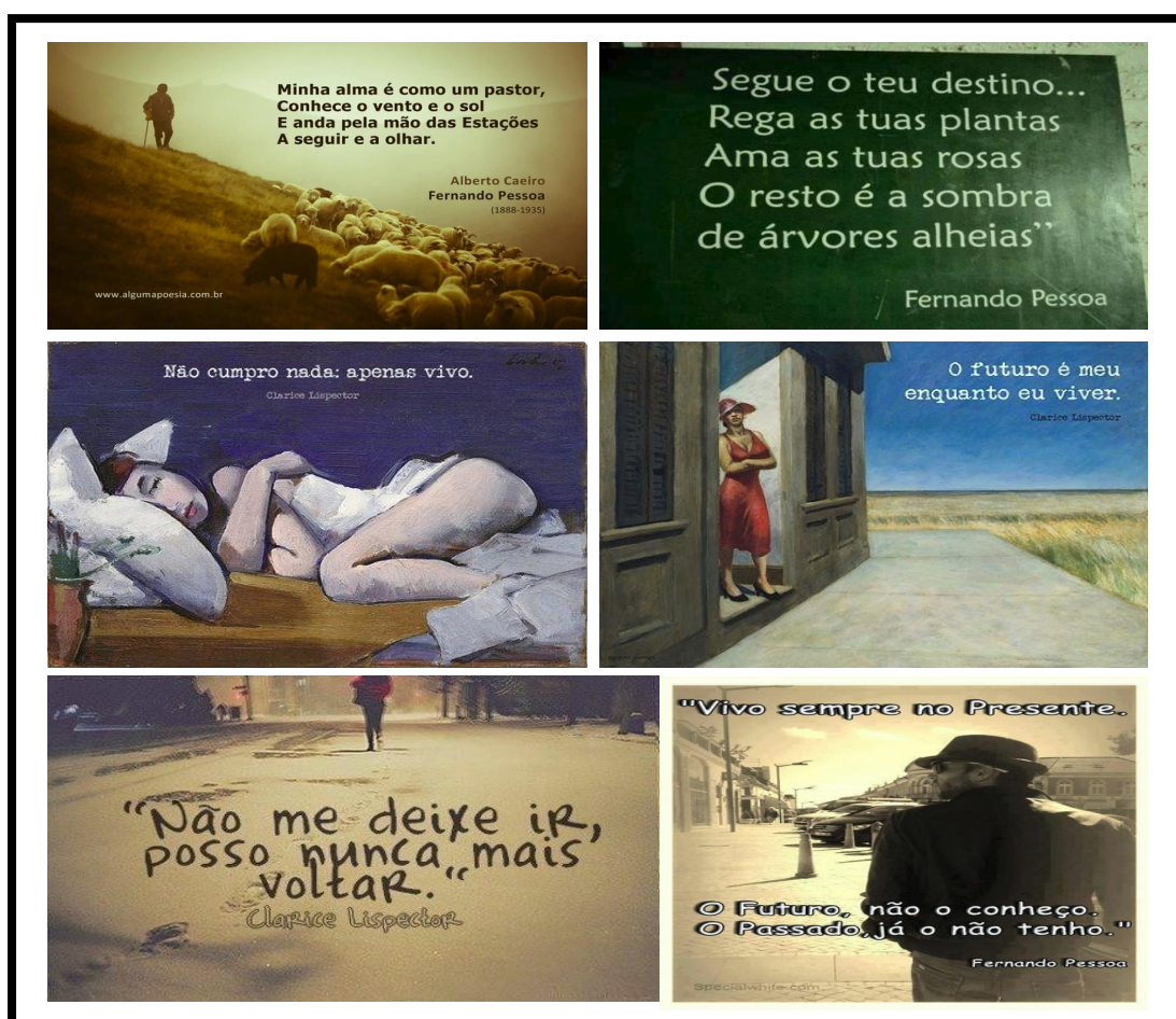
Imagem 03: Exemplos de imagens técnicas produzidas com textos de autores canônicos.

pós-crítica, nesse instante, me habilita a correlacionar as teorias já conhecidas pelos acadêmicos aos fenômenos sociais, visto que reconheço nesse ambiente uma semelhança entre as ações exercidas pelos sujeitos que circulam na sociedade, sejam em pequenos ou em grandes grupos com os acontecimentos que se repetem nas redes sociais virtuais. Retorno a consideração de que as imagens escolhidas, de alguma forma, traduzem aqueles sentimentos que já descrevi nos outros exemplos. Mas, a magia que manifestam pelo fato de estarem ligadas a uma autoria (por vezes real ou construída pelos usuários) reconhecida (via fragmentos literários), amplia a sua função original de apenas representar imagetivamente uma situação. É desse “algo a mais” que existe nessa relação imagem/texto que permitiu que eu pudesse denominá-las de imagens técnicas.