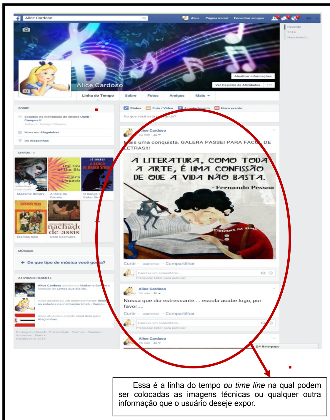
Imagem 06: O perfil social.

construir outra “vida” nesse local preconcebido é uma espécie de integração social na qual é possível evidenciar identidades por meio da magia ou do espectro literário liberado quando da apropriação e exposição das imagens técnicas. Foi contra esse dispositivo que eu tive que reaprender a “escrever” mesmo não concordando (inicialmente) com essa praticidade ofertada pelo Facebook .