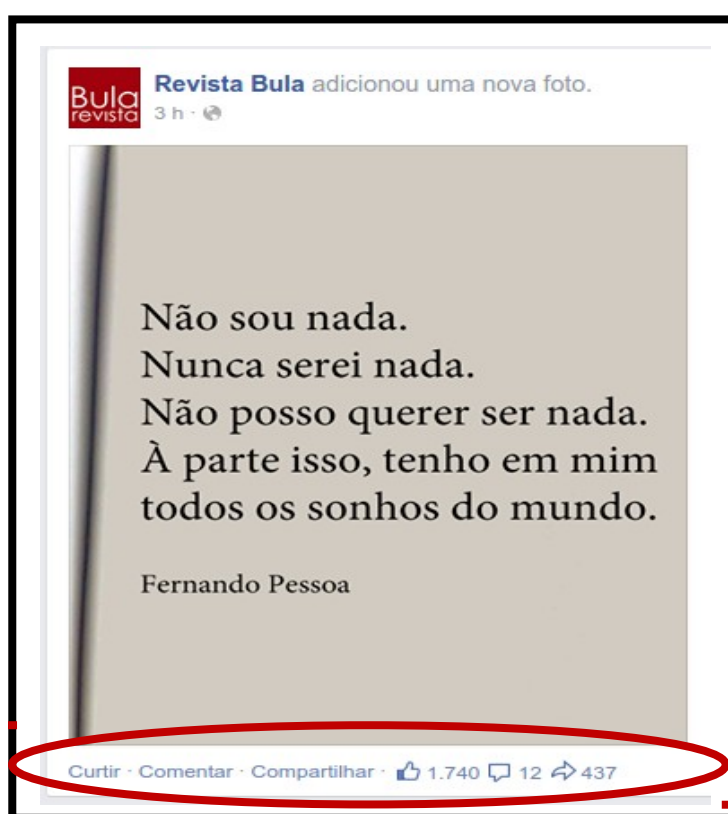
Imagem 07: A função curtir e a compartilhar.

daquilo que foi exposto. Essa prática fica visível tanto para o autor da postagem, quanto para todos que fazem ou não parte da rede de relacionamento dos envolvidos. Esse ato simbólico está atualmente saindo da virtualidade e aparecendo no repertório vocabular da sociedade. Já o compartilhar se refere a possibilidade de colocar concomitantemente na linha do tempo do usuário, uma imagem de outros usuários ou de comunidades e ambos recebem as atualizações do produto imagético.