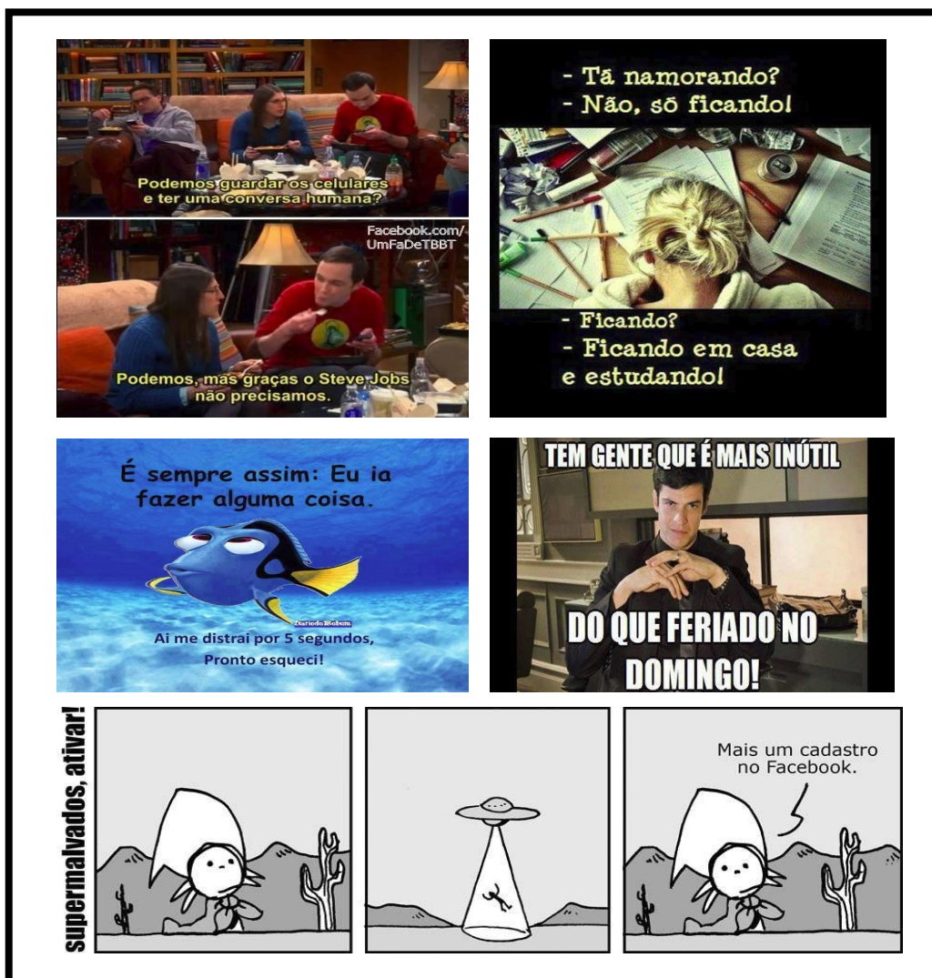
Imagem 01: Exemplos de imagens técnicas produzidas com frases e imagens voltadas para a diversão / reflexão.

Estas são, provavelmente, o tipo ou gênero de imagem que mais circulam nas redes sociais. Geralmente são compartilhadas com a proposta de divertir ao mesmo tempo em que fazem com que o leitor/usuário se identifique com a situação e/ou reflita sobre os atos que pratica socialmente. Entretanto, é válido ressaltar que essas reflexões não se configuram de maneira tão profunda, ao ponto de modificar substancialmente a vida dos usuários. O que tento transparecer para o leitor é que, momentaneamente, o usuário tende a se identificar com a imagem relacionando-a a um momento particular. Essa “reflexão” se extingue no instante em que continua a expor outras imagens, prosseguindo a sua “vida” virtual em postagens subsequentes. Notem também que não há um padrão narrativo ou estilístico, pois as imagens podem ser constituídas por personagens de desenhos animados, de