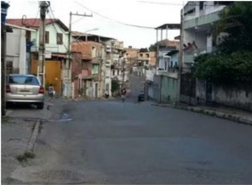
Ruas do bairro da Mata Escura, em Salvador, ficaram vazias após toque de recolher