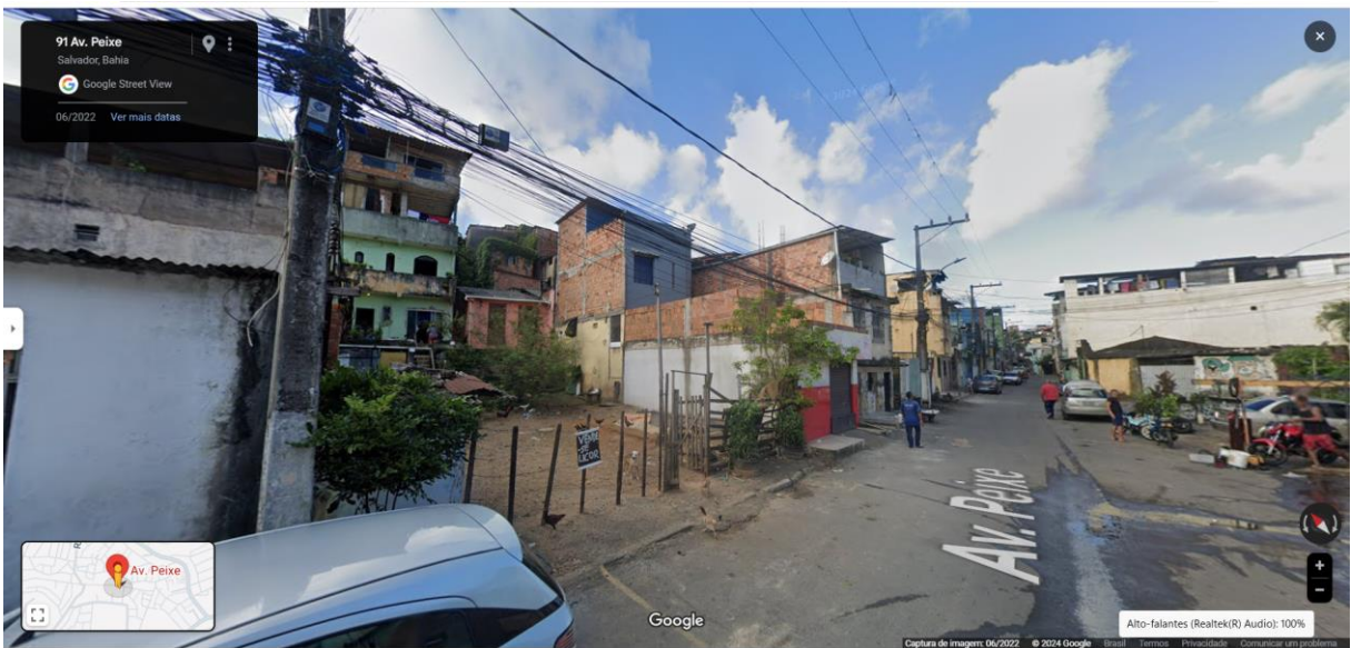
Figura 4- Avenida Peixe Salvador/BA