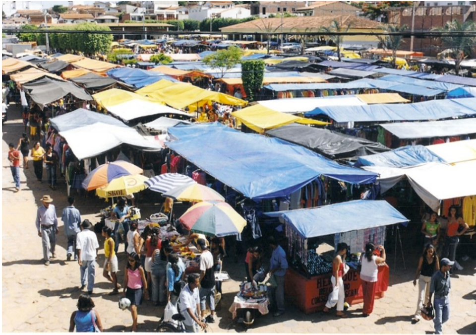
Visão geral da feira livre de Caculé