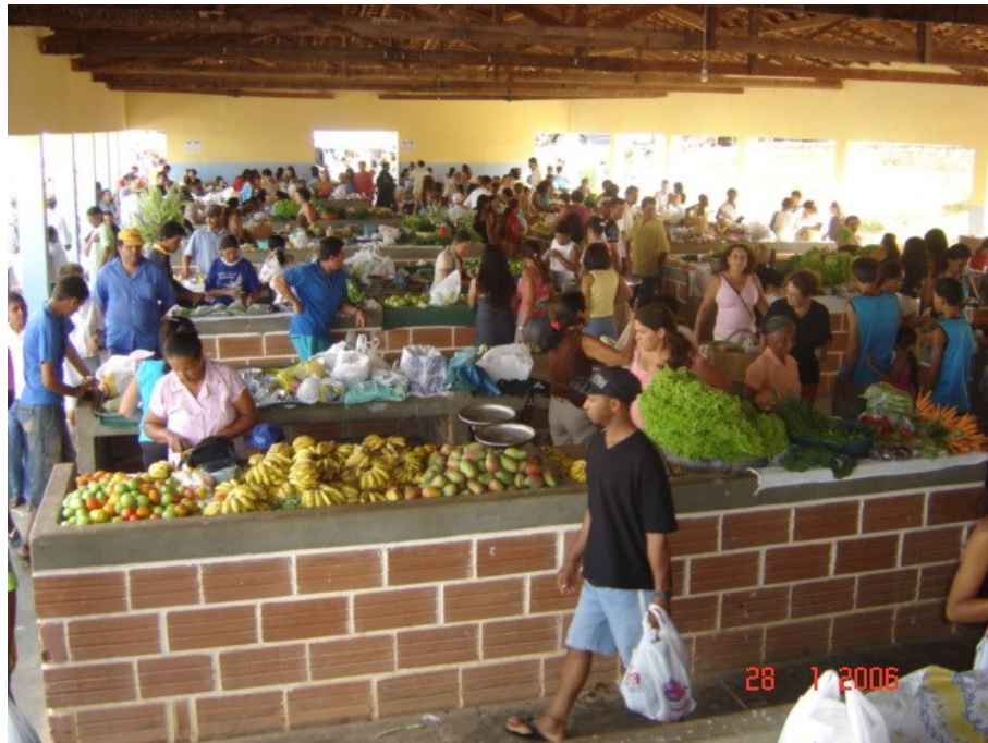
Barracão de frutas e verduras