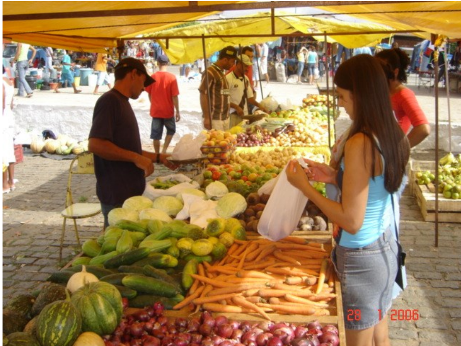
Momento de compra e venda 1