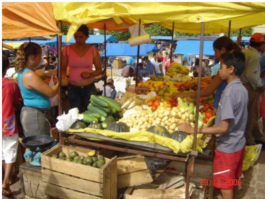
Momento de compra e venda 3