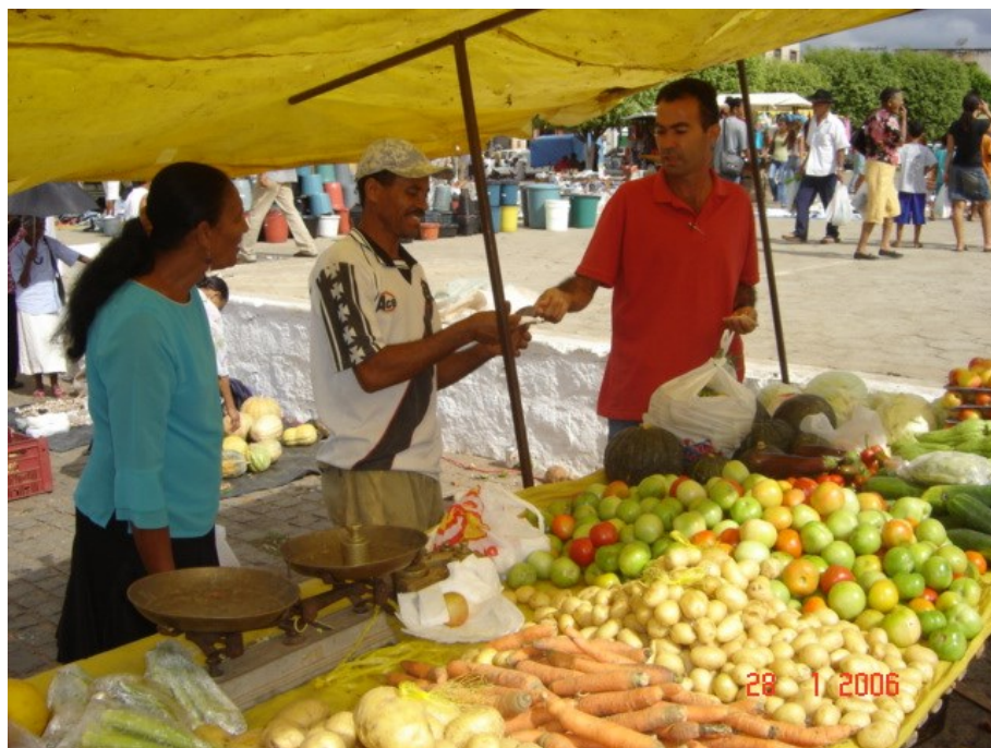
Momento de compra e venda 2