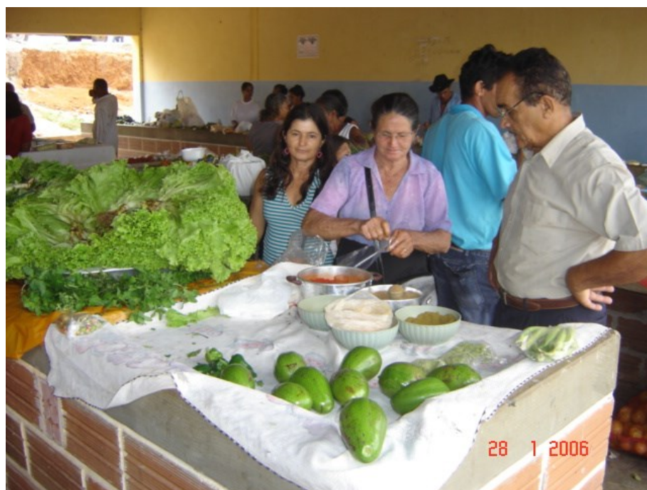
Momento de compra e venda 4