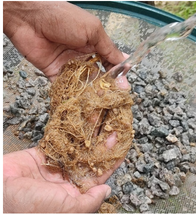
Figura 1: Raízes de plantas de feijão Caupi sendo lavadas em água corrente com auxílio de peneira.

Aos quinze dias após a inoculação foi realizada determinação da altura das plantas. O experimento foi conduzido até o período da pré floração da cultura. Aos 42 dias o experimento foi colhido e determinado: fitomassa fresca da parte aérea (FFPA), fitomassa seca da parte aérea (FSPA) em balança de precisão, comprimento da planta (CP) com auxílio de uma trena e diâmetro do caule (DC) utilizando de um paquímetro digital. O sistema radicular foi separado da parte aérea e lavado em água corrente com auxílio de uma peneira (figura 2).