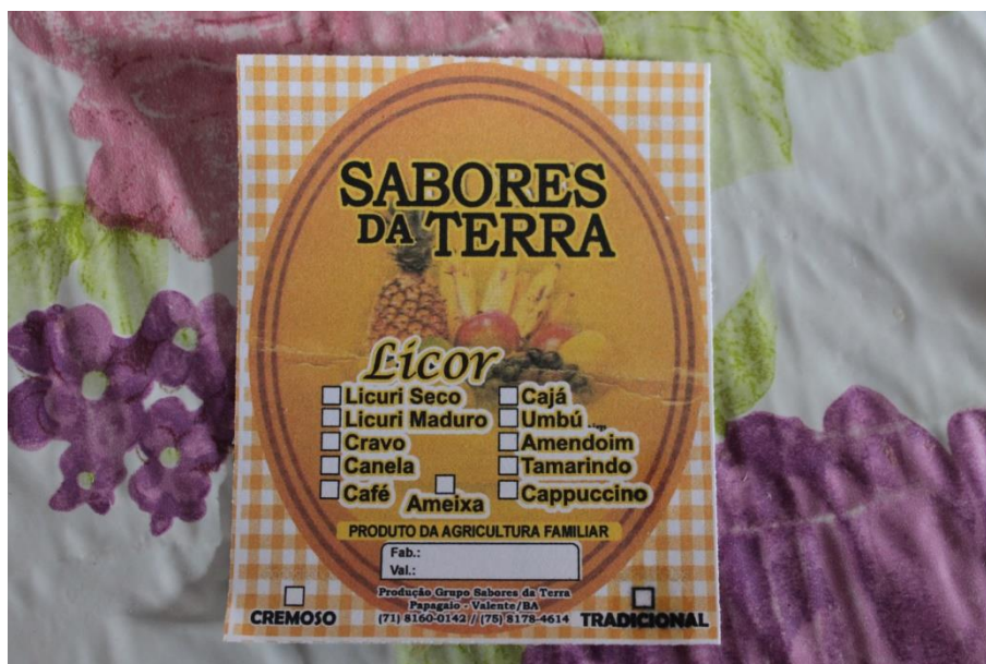
Figura 07: Comunicação representada e estruturada simbolicamente. (DANTAS, 2016)

realidade vivida e experienciada uma comunicação representada e estruturada simbolicamente. Visto que no rótulo para os licores as frutas aparecem. Neste sentido visual e simbólico interpretativo as frutas faz jus a sua origem de criação.