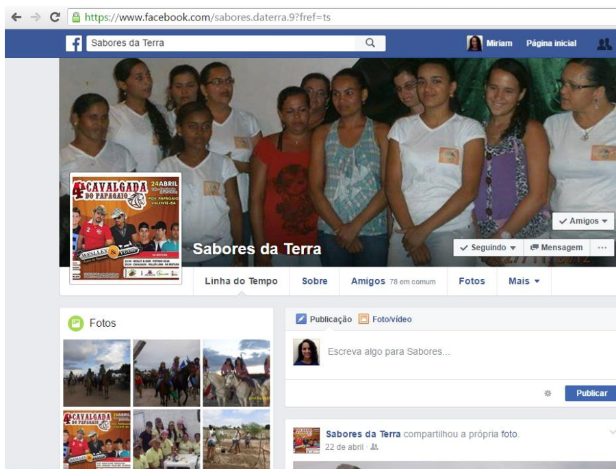
Figura 28: Sobre os comportamentos das mulheres e novas formas de sociabilidade emergiram com a Internet. (ARAÚJO, 2016)

Tratar-se dos meios contemporâneos, sobre os comportamentos das mulheres e novas formas de sociabilidade emergiram com a Internet.