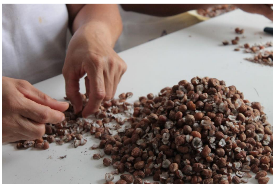
Figura 18: Selecionar o licuri e prepara-lo para a transformação em produtos como a empada. (DANTAS, 2016).

Há sim estes momentos de muita produção, atreladas às preocupações e com discordâncias, em que o ritmo calmo da localização aparenta sumir internamente. O vapor das panelas, o barulho das panelas, facas e equipamentos sobre a mesa, agitam a rotina as expressões e as ações se modificam, porém a interação do coletivo, com responsabilidade individual de cada uma, as tarefas são codificadas e ritualizadas entre elas.