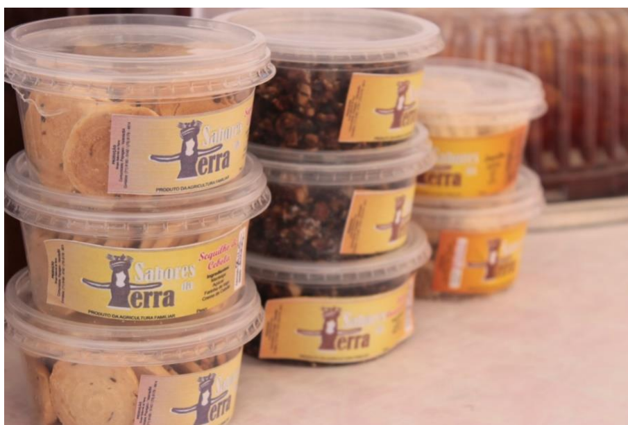
Figura 10: Tornam – se algo material e palpável. (DANTAS, 2015)

As relações deixam de ser mediadas apenas pelos eventos sociais, passando aos contornos das imagens, são representadas nas embalagens, rótulos, cartões. Tornam – se algo material e palpável.