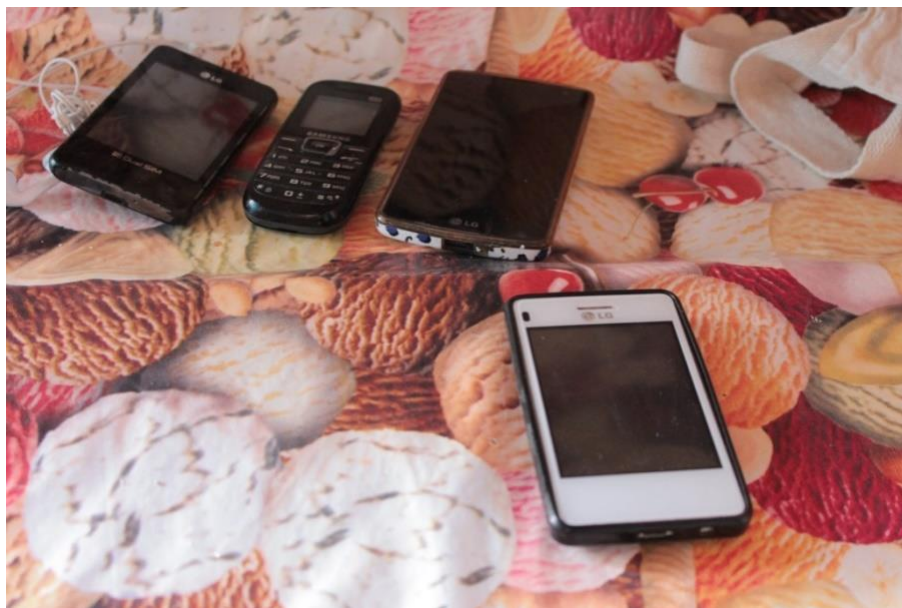
Figura 27: Afetações nas interações simbólicas que advêm virtualmente. (DANTAS, 2016)

Para os recados entre elas no que diz respeito à articulação para reunião e/ou encontros, para as mais próximas funciona um “grito” para as mais distantes não só a tradicional ligação, não mais a mensagem de texto, considerando e acompanhando a atualidade, há o “Grupo Sabores da Terra” em grupo de WHATSAPP 10 . É estabelecido no grupo, neste caso de WhatsApp laços de confiabilidade e sociabilidade, construindo e reconstruindo valores tanto individuais como coletivos. Todas possuem celular, por enquanto não são todas que estão no grupo de WhatsApp, falta ainda manejo para a utilização desta novidade por parte de poucas. Mesmo as mulheres que tinham dificuldades na leitura e escrita, utilizam os aparelhos com frequência. Aliado aos dispositivos e aplicativos, o convívio destas melhorou no que se refere à integração inclusive em falas, antes pouco provável. São alguns dos exemplos narradas pelas demais componentes mais articuladas. Estas, por sua vez, dominam e tem acesso a internet com rede Wi-Fi 11 em suas casas, já que no ambiente de trabalho se limitam a ligações de vendas com os clientes, estabelecimentos, entidades e organizações para acertos de comercialização.