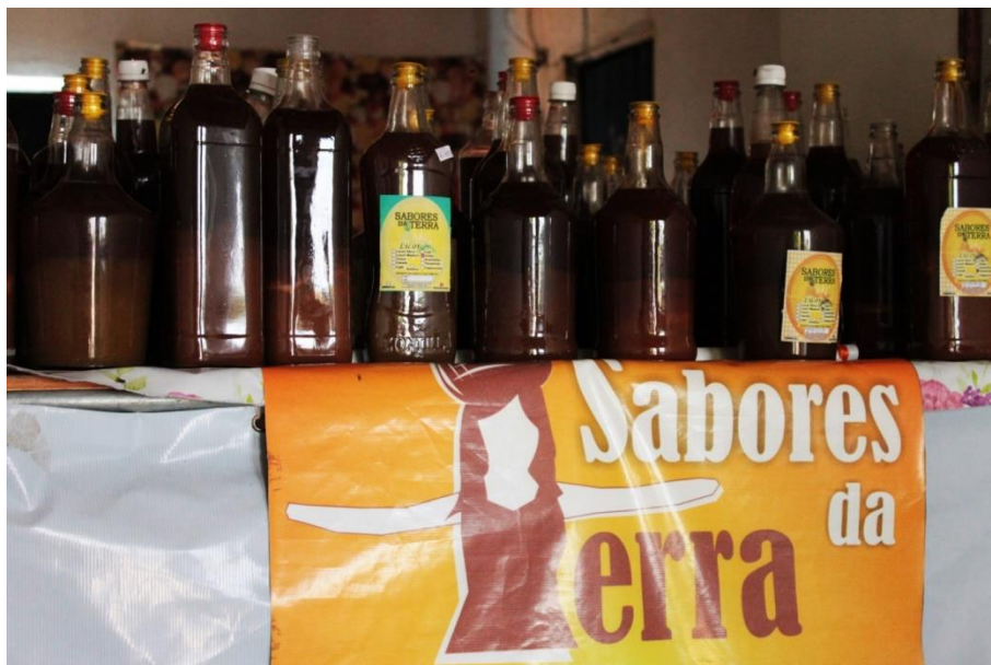
Figura 09: As relações deixam de ser mediadas apenas pelos eventos sociais, passando aos contornos das imagens. (DANTAS, 2015).