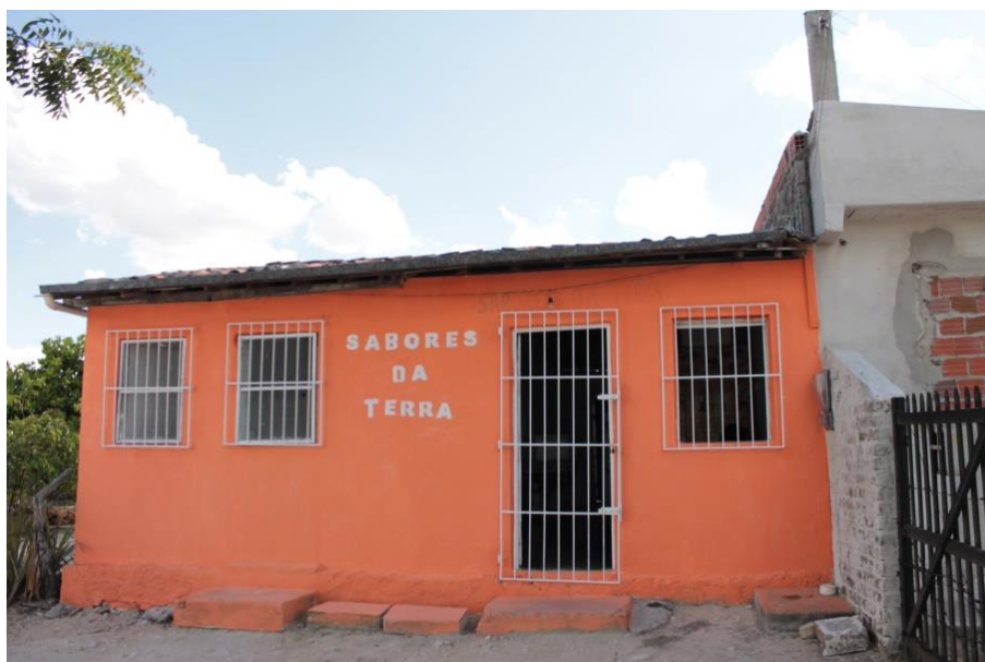
Figura 01: A cor forte na parede para além da reforma necessária sobressai na vegetação rural tipicamente do semiárido baiano. (DANTAS, 2016).

O contexto no qual o grupo está inserido é fruto das interações simbólicas, podendo assim gerar significados diferentes de acordo com valores entre elas: sujeito/fatores simbólicos. Pode parecer simples, mas a sede representa uma transformação, não somente pela pintura que destaca o local, a interação simbólica participativa e comunicacional promove na fachada uma experiência resultando em significados entre o grupo e o meio.