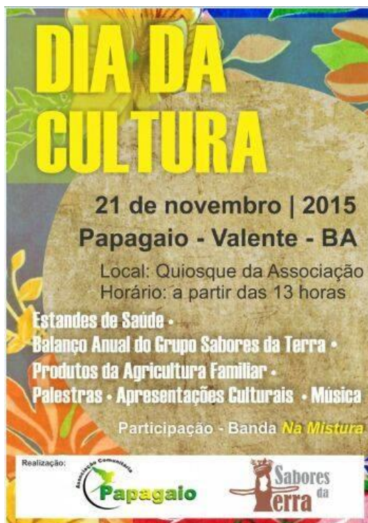
Figura 21: Cartaz de divulgação do evento. (ARAUJO, 2015)