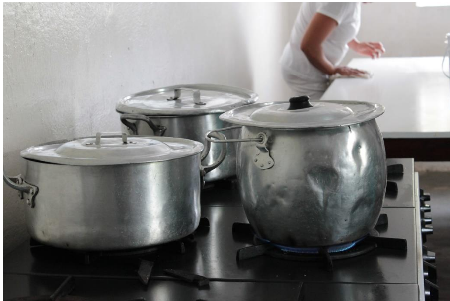
Figura 17: O barulho das panelas, facas e equipamentos sobre a mesa, agitam a rotina as expressões se modificam. (DANTAS, 2016).

Há sim estes momentos de muita produção, atreladas às preocupações e com discordâncias, em que o ritmo calmo da localização aparenta sumir internamente. O vapor das panelas, o barulho das panelas, facas e equipamentos sobre a mesa, agitam a rotina as expressões e as ações se modificam, porém a interação do coletivo, com responsabilidade individual de cada uma, as tarefas são codificadas e ritualizadas entre elas.