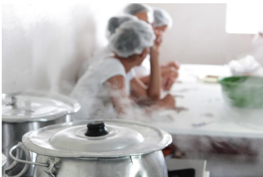
Figura 16: Não se escuta outro som, ruídos, suas próprias falas e o ecoar das suas ferramentas de trabalho. (DANTAS, 2016)

Facilmente com estas diferenças não só de idade, mas de interpretações, significados e sentidos individuais levam a distintos comportamentos e atitudes, as próprias dificuldades de grupo e/ou as demandas de produção levam a situações também de estresses, são prazos de entregas para cumprir, longas jornadas de trabalho para alcançar a produção exata, naturalmente corresponde a um clima de cansaço e tensão.