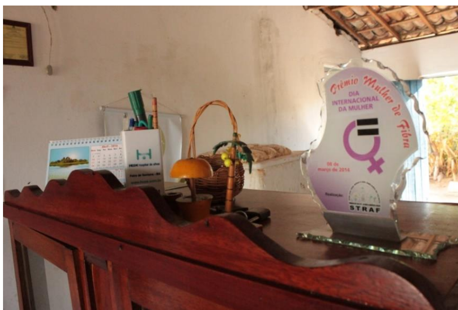
Figura 23: O reconhecimento social e identitário, representado na premiação. (DANTAS, 2016).

As interações simbólicas das mulheres traz uma ampla implicação ao considerar os processos interpretativos em que os significados sociais ocorrem numa condição mediante os sujeitos, os quais são sujeitos ativos dentro do processo comunicativo. Esses significados são modificados diante de um processo interpretativo usado pelas mulheres no trato com os acontecimentos com os quais se enfrentam, isto é, trata-se de um produto da vida social. Estas interações entre si e/ou com a sociedade em geral, num aspecto cultural e social, proporcionam também o reconhecimento social, identitário, representado na premiação “Mulher de Fibra”, realizado numa comemoração do Dia Internacional da Mulher, promovida pelo Sintraf- Valente exposta na sede do grupo.