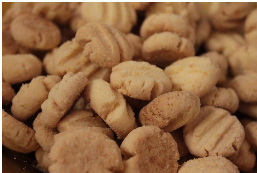
Figura 04: “Representar e compartilhar” nesta forma plástica (estética). (DANTAS, 2016).

As figuras 03 e 04 demonstram um processo entrelaçado a um artesanato de representação e compartilhamento simbólico, não somente no que diz respeito aos sequilhos e os biscoitos de licuri. Em toda produção e comercialização dos produtos existentes no grupo, é possível considerar uma transmissão, um compartilhamento e uma criação coletiva de sentimentos, de significados e identidade, numa reprodução e transmissão do mundo simbólico, pelas ações simbolicamente mediadas por aspectos culturais e sociais. De maneira interativa a imagem (estética) associada à receita de cada item e produtos oriundos da comunidade provinda da Agricultura Familiar se desenha em arte e o processo se torna um artesanato cotidiano de execução de cada receita. “Tais interações simples asseguram o sentimento de pertencimento dos indivíduos nas redes de experiências da vida cotidiana, [...] que desafia o entendimento e extrapola qualquer ordem “comum” coletiva”. (MAIA, 2002, p. 34). Quase que despercebido e a princípio sem intenção, nota-se no mural da sede da unidade produtiva, um pequeno recorte de papel com uma descrição que retrata mesmo que inconscientemente a arte ao desenrolar das experiências, são os laços histórico-sociais destas empreendedoras integradas à arte.