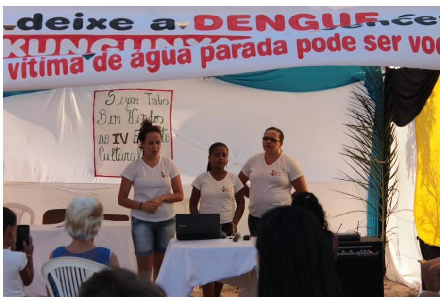
Figura 22: Apresentação do Balanço Anual do Grupo. (DANTAS, 2015)

Neste caso, as figuras 21 e 22 são as interações e os símbolos dos sujeitos entre os sujeitos, em que ao interagir ente si estabelecem uma relação de partilha de valores e identidades mediadas no vínculo do comum.