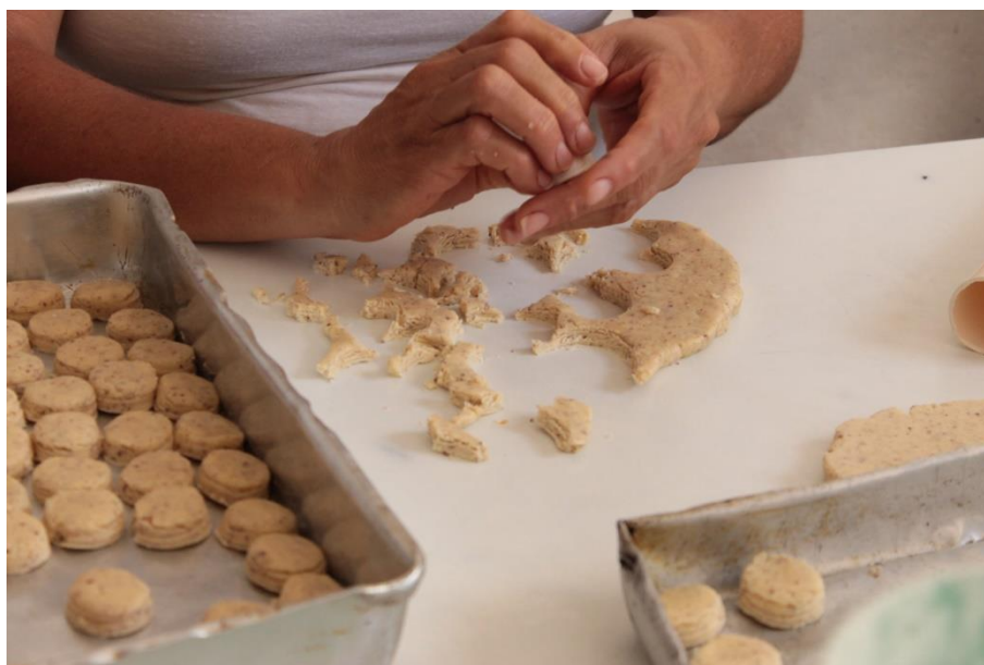
Figura 13: No que dizem respeito a gestos, elas operam dentro de uma organização de integração coletiva solidária e comunitária. (DANTAS, 2016).

Compreende-se também que este universo simbólico é composto e representado cotidianamente, por meio dos sujeitos com as ações interativas concretas, as quais são percebidas na comunicação verbal ou não verbal, para além da linguagem puramente dita, nos gestos e nas interações simbólicas de cada de um sobre todos. “O gesto consiste em qualquer parte ou aspecto de uma ação contínua que traz consigo o ato global de que faz parte”. (BLUMER, 1980 p.126).