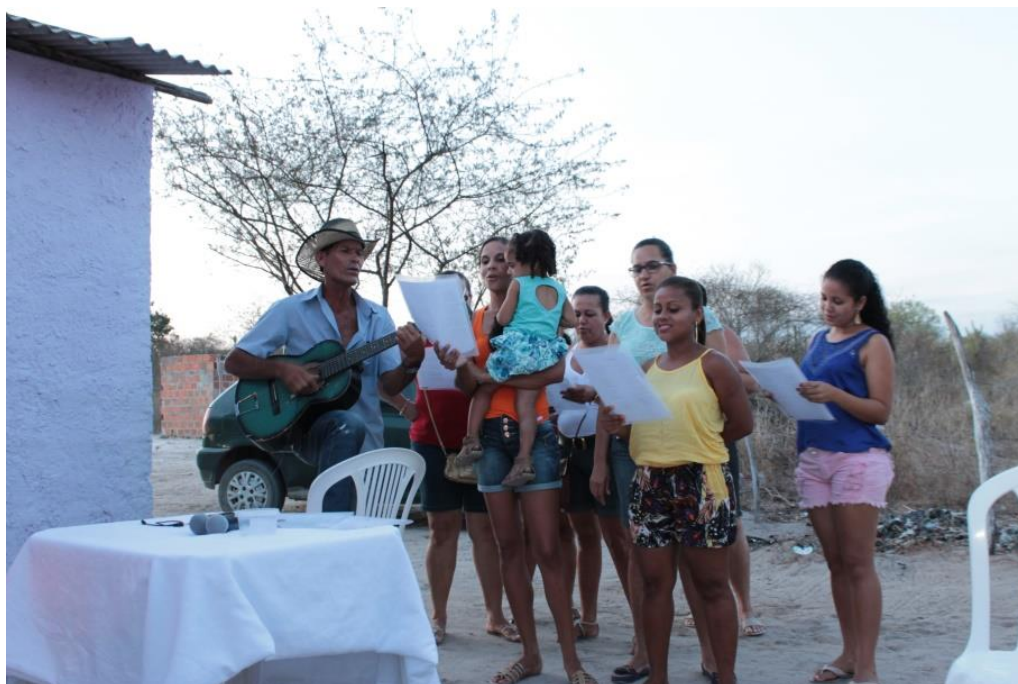
Figura 20: Hino do grupo (ainda com letra enquanto Copal) cantado no dia do balanço, com um artista da comunidade. (DANTAS, 2015).

de interpretações e/ou representações múltiplas e de investimentos simbólicos, compreendendo a interação como uma peça – chave. A unidade produtiva age em relação ao mundo social, esta “sociabilidade apresenta-se como um aspecto fundamental do estar-junto” (MAIA, 2002, p. 34). Conforme significados que a vida em sociedade ou em coletivo lhes oferece. “Em toda experiência integral existe forma, porque existe organização dinâmica”. (DEWEY, 2010, p. 139).