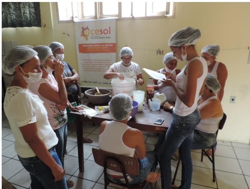
Figura 25: O partilhar e o desenrolar das experiências provém das vivências formativas. (ARAUJO, 2016),

Esta interação simbólica intercedida por elementos/fatores simbólicos é compreendida como uma construção por meio da comunicação entre duas ou mais pessoas, neste sentido as ações em relação aos fatos baseia-se no significado que estes fatos e situações apresentam para cada um/a. Significados estes que são resultados da interação de coexistência grupal humana e que podem ou não serem modificados num processo formativo.