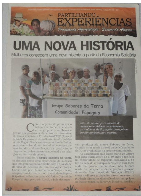
Figura 24: O valor e significado simbólico do reconhecimento igualmente são partilhados no boletim informativo. (ARAUJO, 2016)

cuidadosa também agrega valores simbólicos, significados de essência pessoal, mas, sobretudo retratam a construção de uma história, mesmo que as fotografias de cada material impresso não representem todas as mulheres adultas e as mulheres jovens da atual formação do “Grupo Sabores da Terra”. Porém retrata uma história reconhecida, partilhada e contada.