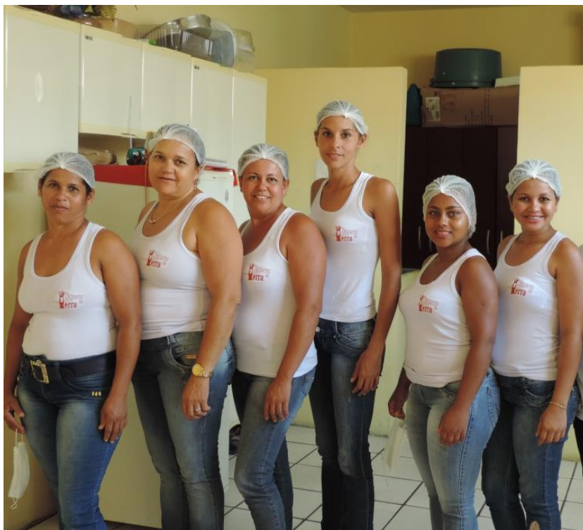
Figura 12: Nas fardas e/ou uniformes de trabalho bem como nos produtos pode-se encontrar estes retratos aplicados e/ou pintados. (ARAUJO, 2016).

A logomarca do grupo demarca uma representatividade de narrativas identitárias e construções intersubjetivas de um contexto coletivo cultural.