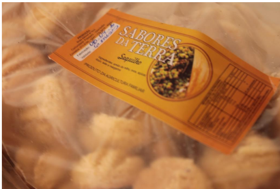
Figura 06: um contexto tornando-se imagem e uma marca se transformando em realidade, um fenômeno comunicativo. (DANTAS, 2016).

O grupo é inserido numa comunidade rural com predominância do licuri , palmeira da vegetação do bioma Caatinga. Para além das folhas que são utilizadas na confecção de artesanatos e artigos tipicamente rural como sacolas, chapéus, vassouras e espanadores, as mulheres utilizam o fruto desta palmeira para o desenvolvimento de produtos para consumo, refletida na produção de licores, licuri caramelizado, empada de licuri, biscoitos dentre outros.