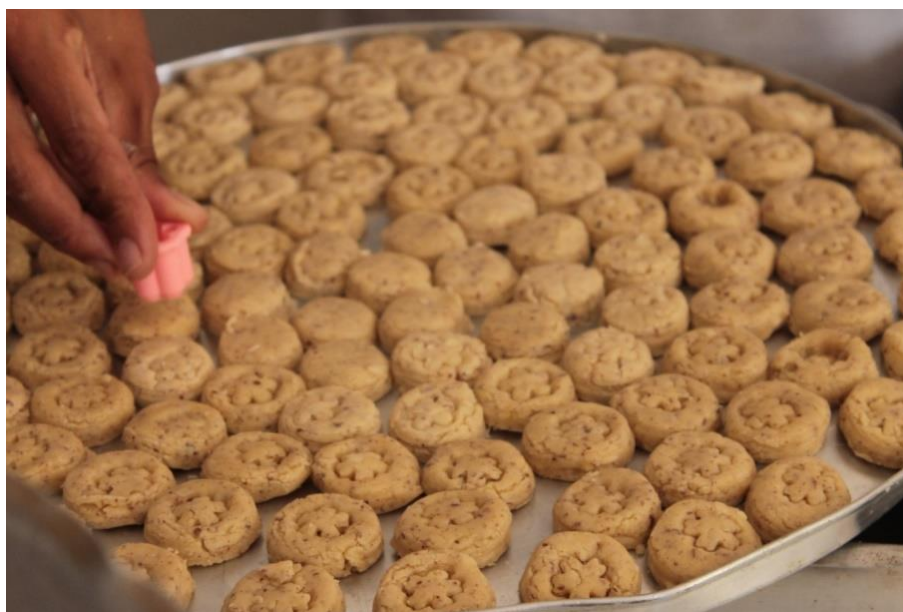
Figura 03: Os biscoitos de licuri e os sequilhos finalizados chegando a sua forma de arte. (DANTAS, 2016)

A experiência pode ser notada como uma arte, que por sua vez é simbólica, os biscoitos de licuri e os sequilhos finalizados chegando a sua forma de arte é fruto da interação dinâmica dentro da capacidade que o sujeito tem de criar e utilizar símbolos de “representar e compartilhar” nesta forma plástica (estética), o sequilho, o biscoito de licuri trazem os sentidos e significados vistos e experimentados. “A mercadoria não é apenas mercadoria, é arte, é expressão de vida”. (VIANA, 2015, p. 10).