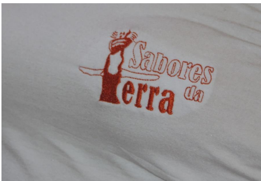
Figura 11: Marcas representativas e contextuais. (ARAUJO, 2016)

revelados o significado de cada período, no qual se incorpora a criatividade e inovação feminina. Encontram-se sinais desta trajetória nas etiquetas e embalagens pelo fato de que alguns produtos levarem estas marcas representativas e contextuais (ainda há certa quantidade de embalagens antigas e precisam ser aproveitadas). Nas fardas e/ou uniformes de trabalho bem como os produtos pode-se encontrar estes retratos aplicados e/ou pintados. Destaque para a veste recente exclusivamente definida por elas como uniforme de representação fora da unidade: reuniões, atividades e eventos.