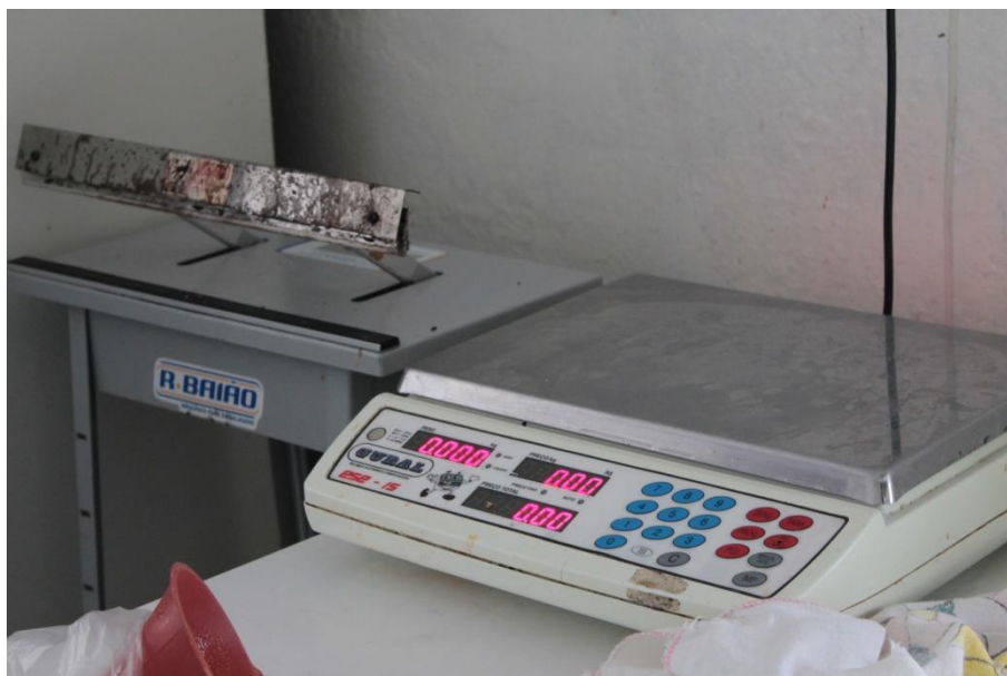
Figura 26: A técnica e/ou tecnologia acompanhou todo esse percurso de mistura com a modernidade e tradição. (DANTAS, 2016).

Em outros termos, as teletecnologias criaram uma nova forma de estreitamento da comunicação, que tolhe a capacidade de expressão das pessoas, na medida em que essas técnicas representam, em essência, meios de transmissão de condutas, que submetem nossa competência comunicativa às suas rotinas, a seus cenários, a seu calendário: vide, por exemplo, os vários ritos sociais criados pelo hábito de ver televisão. (RÜDIGER, 2011, p. 53).