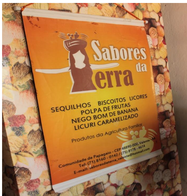
Figura 08: É possível considerar uma transmissão, um compartilhamento e uma criação coletiva de sentimentos. (DANTAS, 2016).

Nesta transformação simbólica e comunicativa, que foram estabelecidas e percebidas no grupo é possível considerar uma transmissão, um compartilhamento e uma criação coletiva de sentimentos, de significados e identidade representada no logo tipo, embalagens e rótulos.