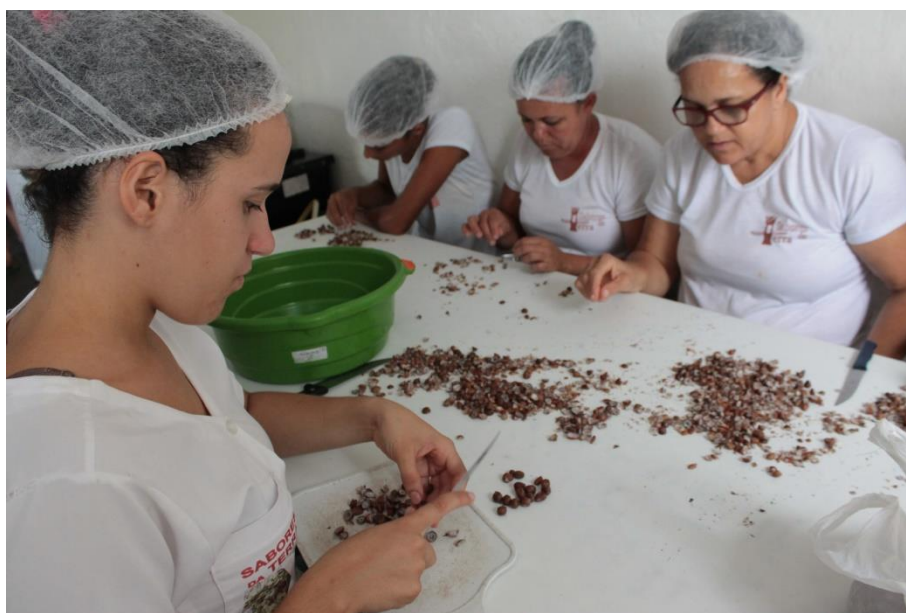
Figura 19: A cumplicidade de um grupo que possuem vínculos, além da geração de renda, do financeiro. (DANTAS, 2016)

O grupo tem algo a destacar na vida de duas mulheres que desencadearam problemas com quadro depressivos, a gente percebeu chamou para participar e ajudou bastante. Uma precisou se afastou pela situação da própria doença, mas disse:- guarda a minha vaga, que eu volto. E a outra está aqui conosco, se tornou outra pessoa. Brinca e rir. (INFORMANTE 02, 04/2016)