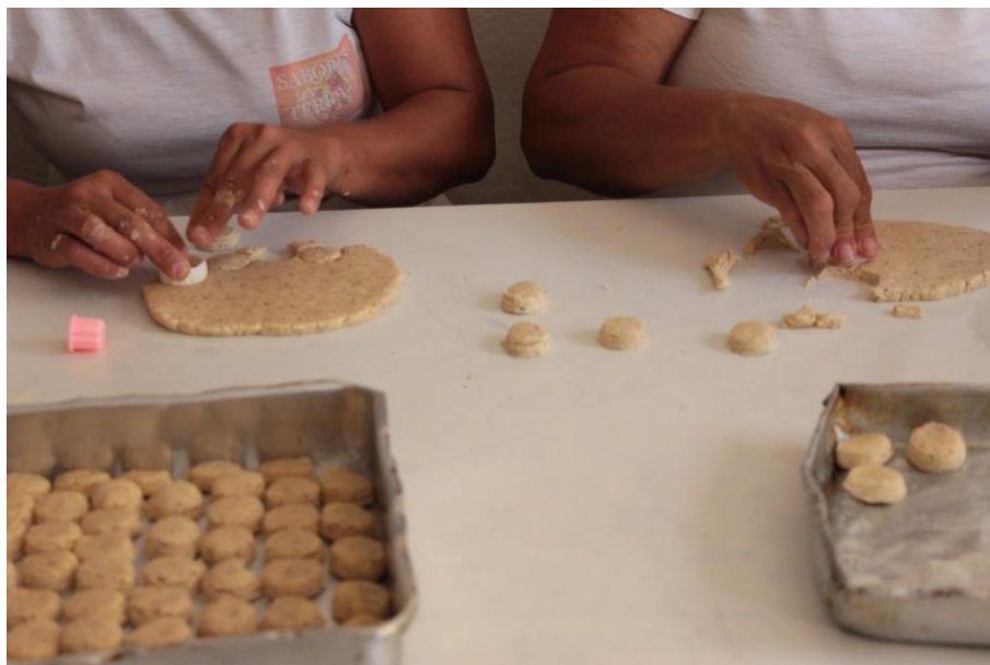
Figura 14: De maneira artesanal as mulheres dão forma aos biscoitos de licuri. (DANTAS, 2016)

Não é renunciando a comunicação técnica no sentido de circulação de informações. No entanto, muitas ocasiões ela diminui a interação entre os sujeitos. O fato do grupo de produção decidir por guardar o rádio num canto para proporcionar uma tranquilidade na conversa entre elas acaba reforçando que, por mais evoluída seja a técnica de comunicação, a relação face a face ainda é decidida por elas como importante.