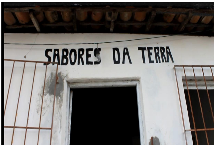
Figura 02: Algumas modificações internas no que se refere a organização de objetos e externa principalmente. (ARAUJO, 2015)

Assim sendo, o universo simbólico depende de constante atualização por parte dos indivíduos e de práticas interativas concretas. Ao mesmo tempo em que as relações cotidianas são rotinizadas, elas são também marcadas pela pluralidade e diversidade, podendo sempre ser vivificadas pela criatividade do novo. (MAIA, 2002, p. 34)