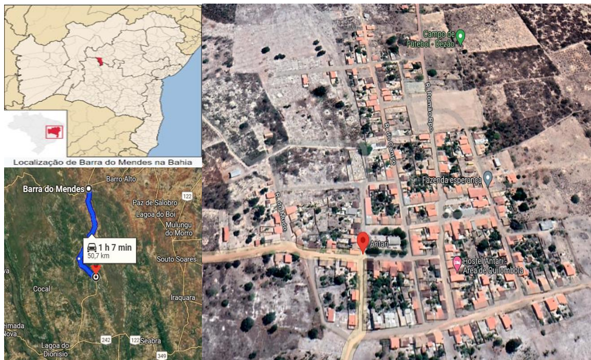
Figura 1 – Imagem de satélite da comunidade quilombola de Antará

Podemos observar a localização e o tamanho da comunidade na imagem abaixo: