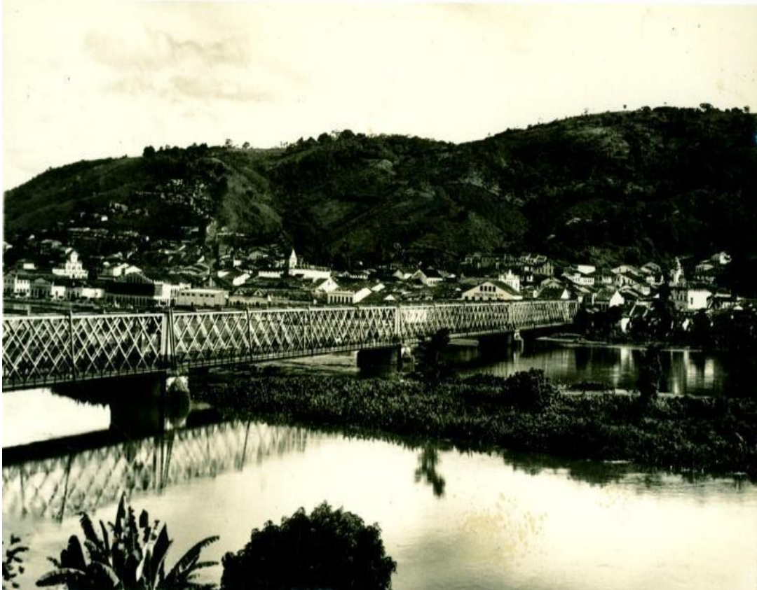
Figura 01 - Ponte Dom Pedro II – Rio Paraguaçu, Cachoeira, Bahia (1957)