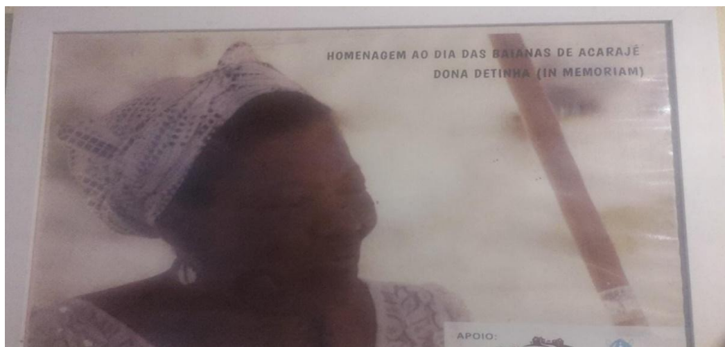
Figura 03 - Homenagem à vó Detinha