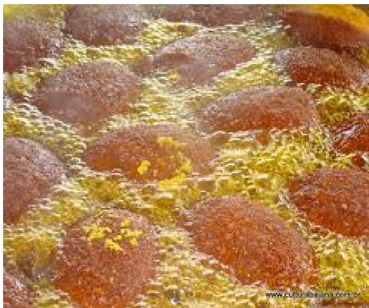
3 Acarajé na fritura.

O feijão-fradinho era ralado na pedra, de 50 cm de comprimento por 23 de largura, tendo cerca de 10 cm de altura. A face plana, em vez de lisa, era ligeiramente picada por canteiro, de modo a torná-la porosa ou crespa. Um rolo de forma cilíndrica, impelido para frente e para trás, sobre a pedra. (QUERINO, 2010)