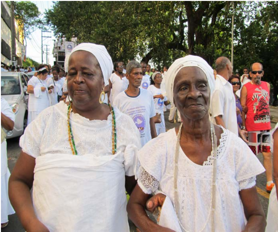
8 Egbomy Dó de Ogum e Egbomy Telinha de Yemanjá.

A voz do povo de santo se eleva na caminhada e ecoa por todos os cantos que permitem a ancestralidade.