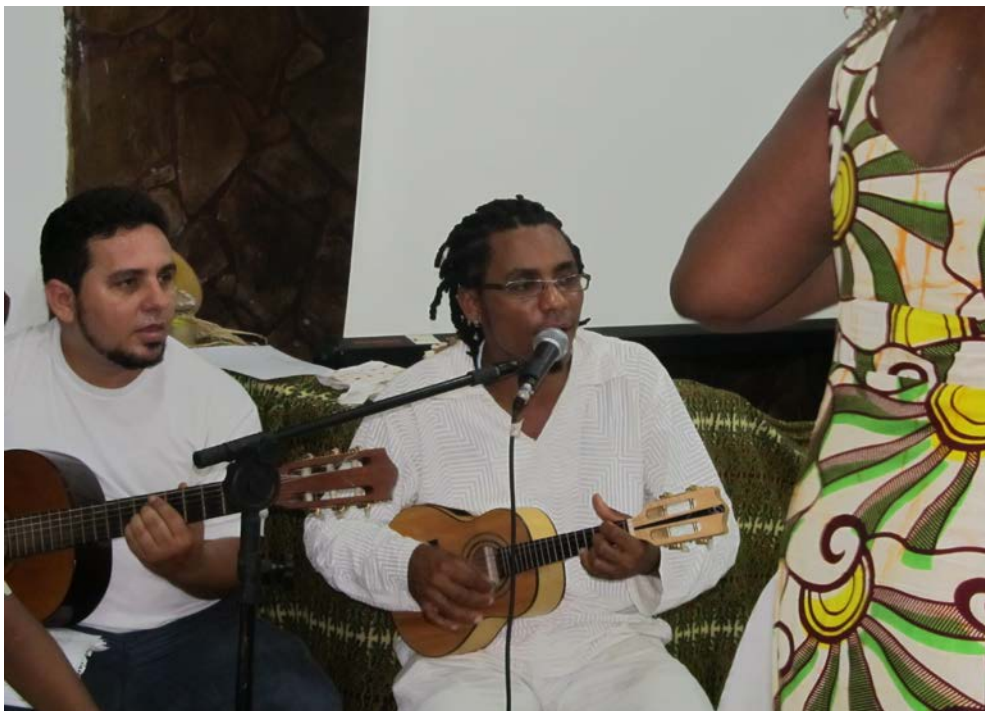
11 Apresentação musical no jantar cultural.

O bairro do Engenho Velho sempre foi um bairro muito bonito, um bairro muito cultural, um bairro que possui muitas atividades, e apesar de ser um bairro de pessoas simples, um bairro periférico, de pessoas pobres, as pessoas são felizes e sabem aproveitar a vida.