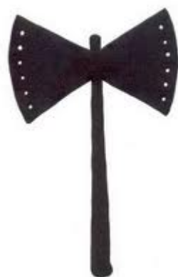
1 Oxé de Xangô

cargo de Yalorixá pelo Xangô da casa. Ao chegar ao imóvel totalmente desfigurado em sua estrutura física, com grande parte de sua área ocupada por pequenas casas, enfrentou muitas barreiras para organizar o Templo sagrado e retomar seu ciclo ritualístico. Seria necessário contar com braços fortes, mentes positivas e espíritos elevados em princípios, valores e coragem para remontar toda uma história de resistência e tradição do bairro do Engenho Velho da Federação. Com estas qualidades necessárias para empunhar o Oxé de Xangô, Pai Kutú, um dos Ogãs mais velhos da casa, foi convocado quando ainda estava dormindo para estar presente em uma cerimônia interna, sendo perguntado se aceitaria ser suspenso como ministro de Xangô, proposta aceita de imediato e levada a sério para toda a vida.