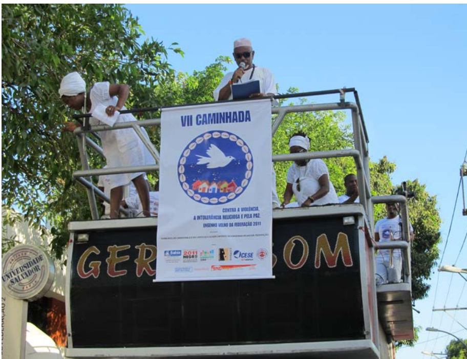
9 Carro de som puxando a caminhada.

A voz do povo de santo se eleva na caminhada e ecoa por todos os cantos que permitem a ancestralidade.