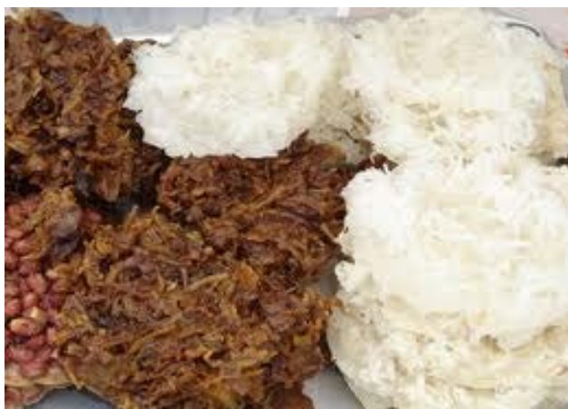
2 Cocada típica do bairro.

A culinária do bairro tem sua base nas comidas de orixás, oriunda dos mais diversos terreiros existentes ali. O acarajé, o abará, a moqueca de peixe, o vatapá, o caruru, a cocada puxa de puro coco e muitas outras iguarias que compõem o rico cardápio mantido através da oralidade de geração para geração.