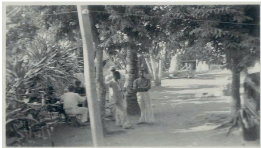
6. Ogãs reunidos na frente do Cobre - 1938

Toda comida era cozida em fogão de lenha, com restos de árvores secas da imensa área que compreendia o terreiro, ou das redondezas, onde era bastante arborizado e havia em abundância a matéria-prima para o fogo do fogão tradicional dos nossos antepassados. A panela de barro, presente nos costumes do terreiro, já fazia parte do conjunto de tradições existentes, preservadas com as condições impostas na época. O atabaque com alcunhas 1 era aquecido ao sol e ajustado pelas mãos dos Ogãs com pedaços de madeira, onde ajustavam o coro para tirar o melhor som para homenagear os orixás.