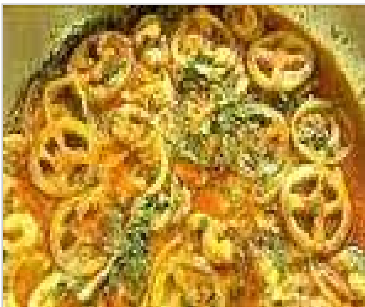
4 Moqueca de peixe.

O feijão-fradinho era ralado na pedra, de 50 cm de comprimento por 23 de largura, tendo cerca de 10 cm de altura. A face plana, em vez de lisa, era ligeiramente picada por canteiro, de modo a torná-la porosa ou crespa. Um rolo de forma cilíndrica, impelido para frente e para trás, sobre a pedra. (QUERINO, 2010)