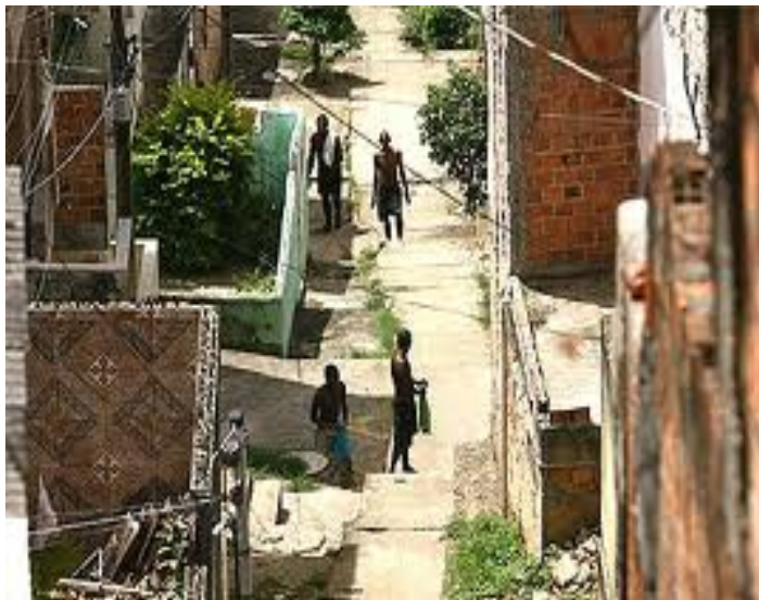
1 Rua do bairro do Engenho Velho da Federação.

Na fotografia abaixo, é possível perceber as ruas estreitas do bairro, conservando as características do solo e a forma de ocupação do espaço geográfico pelos primeiros moradores.