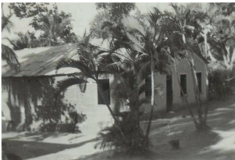
5 Fachada do terreiro em 1938.

O terreiro do Cobre passou por muitas transformações em sua estrutura física ao longo de sua existência, mas não perdeu a sua essência de ser um local do saber coletivo. A expansão imobiliária ocupou muita área pertencente ao terreiro, ficando o registro fotográfico como uma das formas de compreender a tradição e importância deste espaço secular.