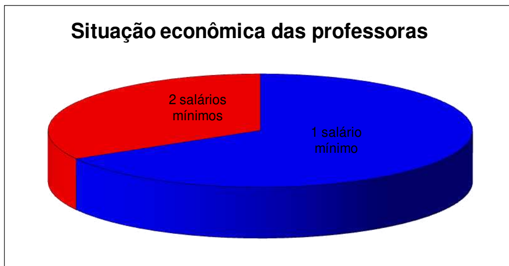
Figura 3- Gráfico 3: Situação econômica – Questionário aplicado aos professores. (CEMEI-Criança Esperança)- Jaguarari, 2009.

Como demonstra o gráfico, a situação econômica das pesquisadas é relativamente baixa, dispondo de poucos recursos para investir em sua formação profissional e na aquisição de livros e cursos como forma de enriquecer seu conhecimento desta forma, segundo Libâneo (2004):