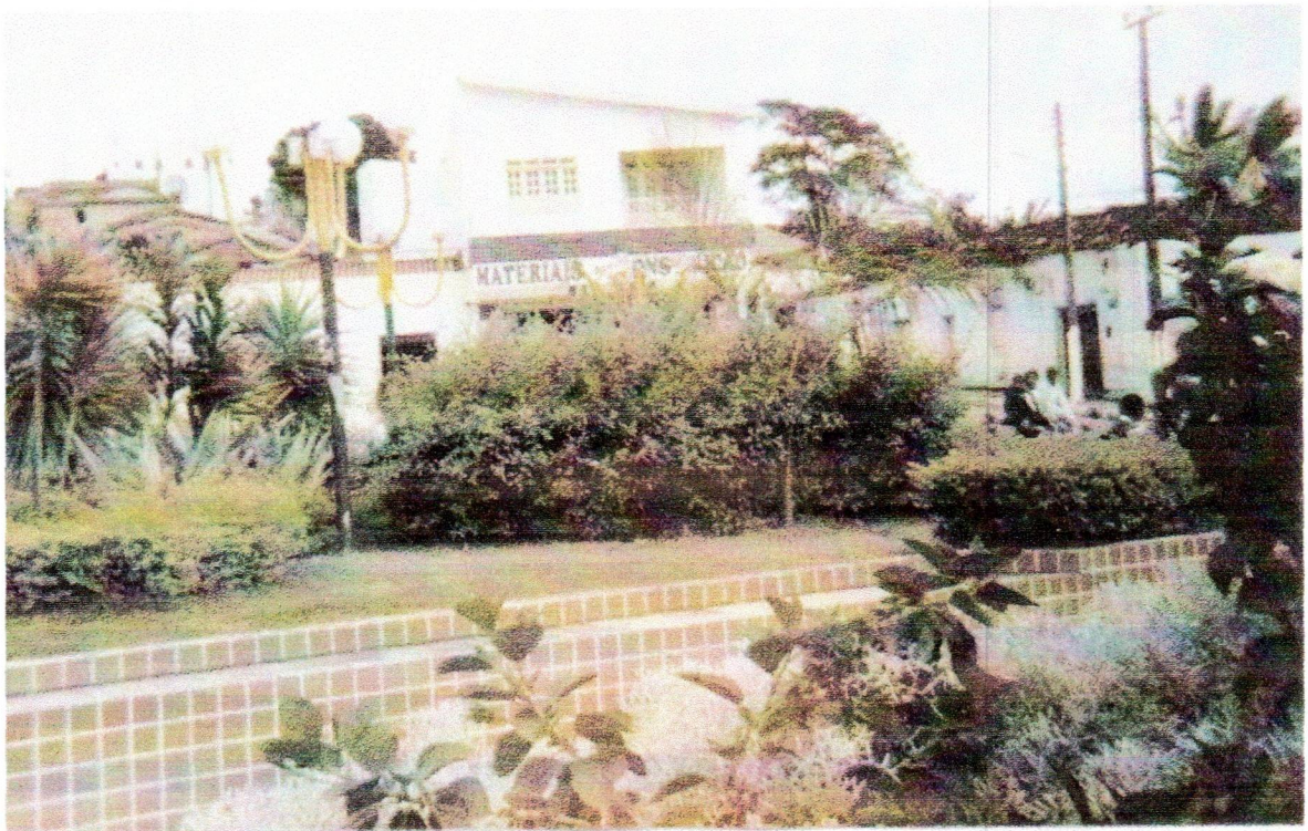
Praça Juracy Magalhães – Mirangaba – Ba (Sede)