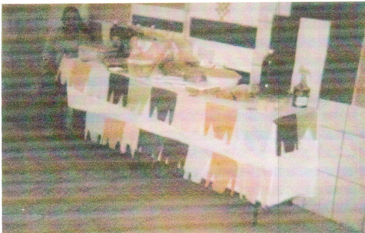
Jacy na barraca de Comidas Típicas de Mirangaba no encerramento do 1º semestre letivo do CESJA em 2002.