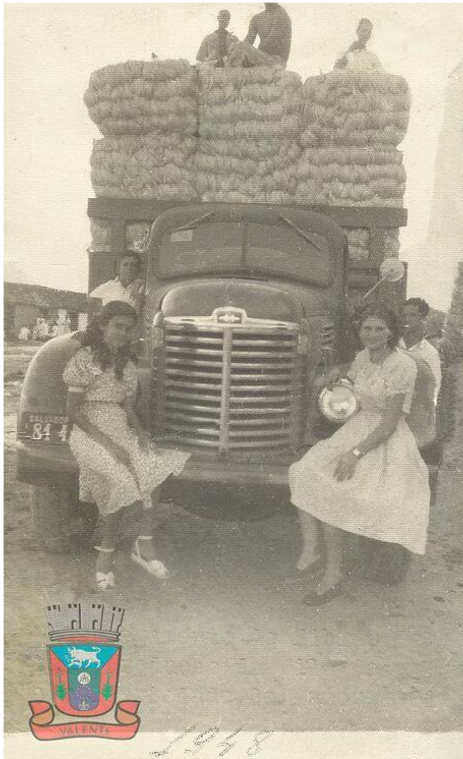
Foto 1: Carregamento de fibras de sisal. Produto da Vila Valente, 1948.