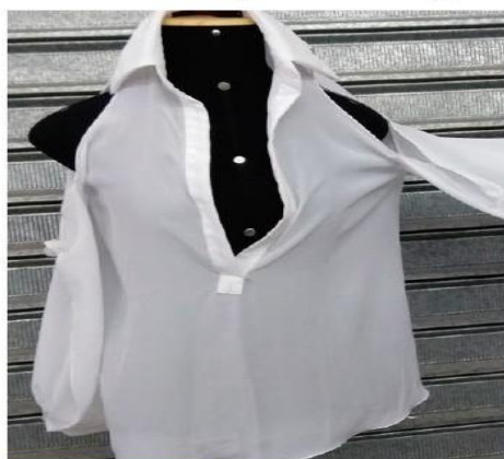
Peça encontrada em oficina em Osasco, Grande São Paulo