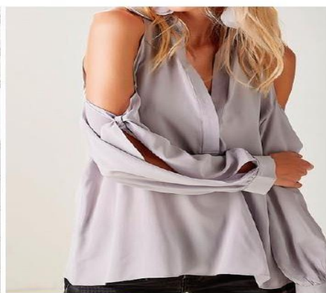
Peça vendida pelo site da Animale, por R$ 698