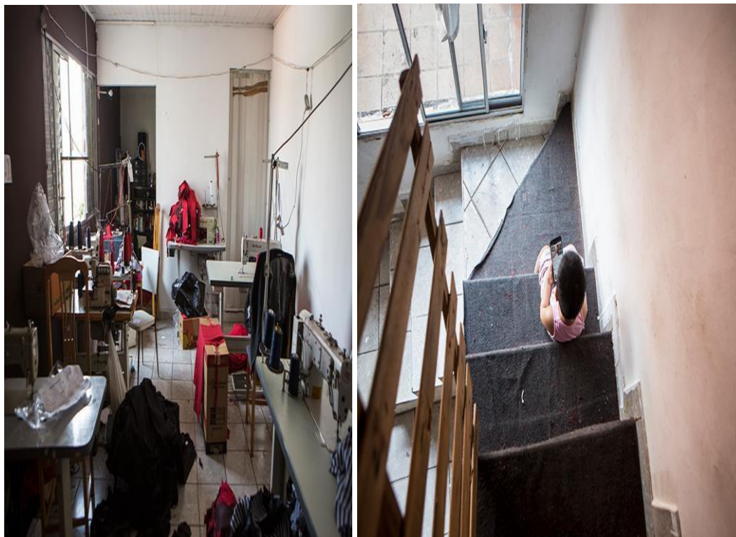
Figuras 4 – Ambiente em condição de trabalho análogo ao escravo/Criança no espaço.

No caso da ANIMALE, a fiscalização do extinto MTE flagrou, em setembro de 2017, o crime em 03 (três) oficinas em São Paulo. Um desses trabalhadores descreveu à Repórter Brasil que recebia apenas $ 6,00 (seis reais) para fabricar uma calça e/ou camisa e que precisavam de uma manhã inteira para ficar pronta.