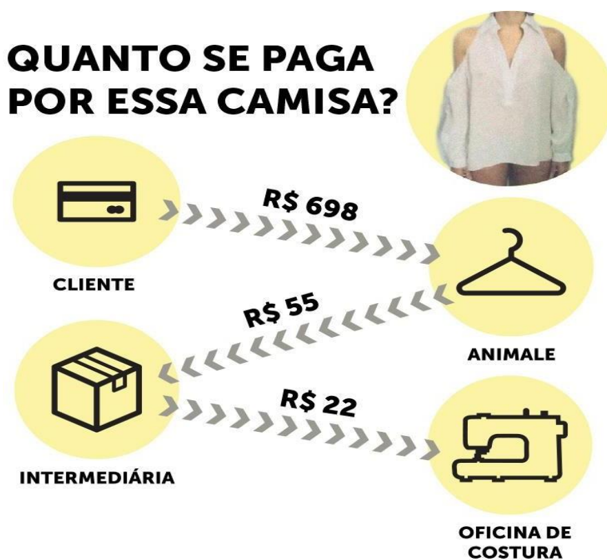
Figura 3 – Modelo de controle completo cadeia produtiva/ANIMALE

As exaustivas jornadas funcionam como norma de remuneração por produção, incluindo modelos de costura minuciosamente planejados para cada conjunto de artigos de peças, todos padronizados pela empresa. No caso específico da ANIMALE, as fábricas de confecção eram subcontratadas de duas empresas terceirizadas que ofereciam serviços para uma outra agência do grupo Soma. A Marca colocava os preços, a quantidade de peças a serem fabricadas e os modelos que precisariam ser confeccionados. As donas das oficinas recebiam ordens expressas das intermediárias, por mensagem de WhatsApp , nas quais pontuavam as quantidades de peças a serem entregues e os prazos. Compreende-se, assim, que a aludida empresa mantém sob suas rédeas o controle completo de sua cadeia produtiva. Como se detalha a seguir: