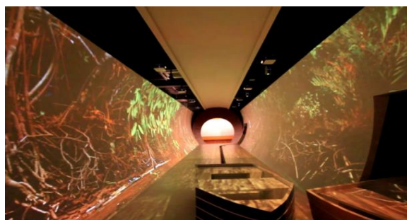
Figura 2 – Parte interna do museu da Gente Sergipana

O museu da Gente Sergipana, inaugurado em 26 de novembro de 2011, é o primeiro museu de multimídia interativo das regiões norte e nordeste do Brasil. Um dos principais pontos deste museu é a presença de um mapa interativo dividido em sub-regiões (agreste central, alto e médio sertão, e baixo do São Francisco) onde é possível ouvir o sotaque dos habitantes desta região do país, além de conhecer e aprender sobre as diferenças culturais presentes no país. O espaço multimídia do museu é de última geração, a fauna e a flora do estado são apresentadas em um túnel com projeção 360° por onde, sentado em um barco, o visitante pode conhecer praias, mar, agreste, mangue, sertão e mata atlântica. Interagir com um vendedor virtual, montar pratos típicos adivinhando seus ingredientes, cuidar de fazendas com animais e plantas são algumas das outras atividades que se pode fazer em multimídia e dão ao museu uma atmosfera viva, deixando a experiência ainda mais interessante.