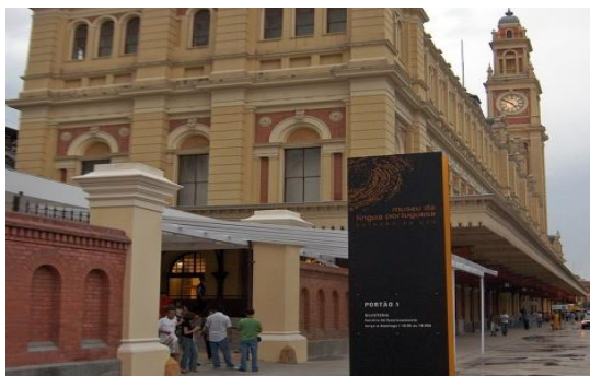
Figura 6 - Museu da Língua Portuguesa