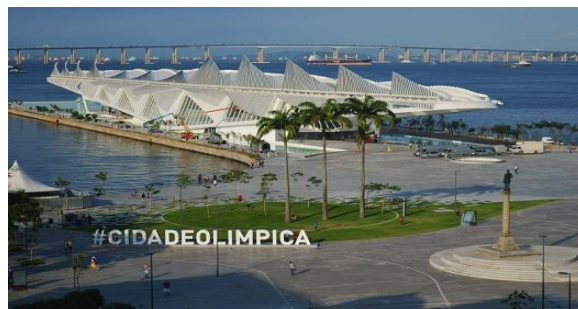
Figura 4 – Museu do Amanhã