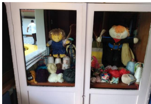
Figura 18 – Armário de costuras