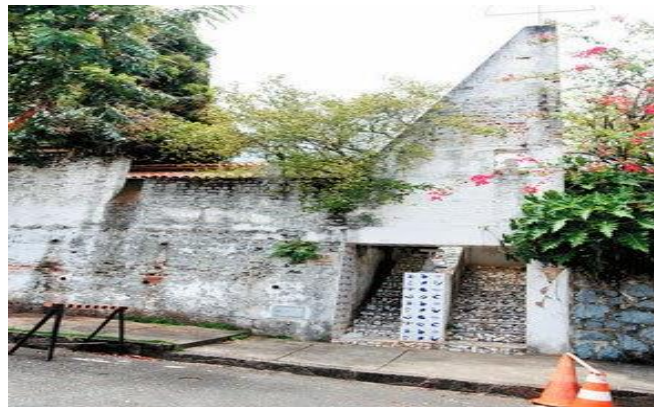
Figura 8 – Fachada antiga da casa