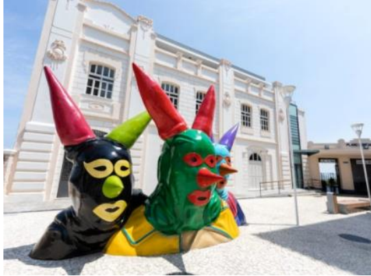
Figura 1 – Fachada do museu do Carnaval