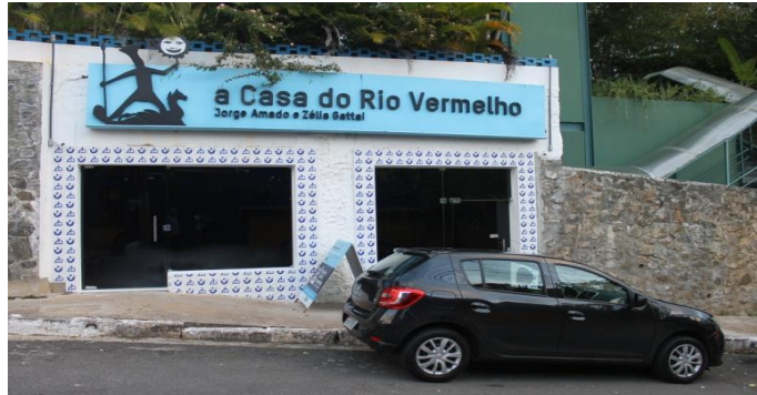
Figura 9 – Fachada da casa/museu pós reforma