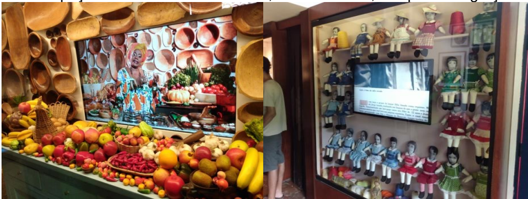
Figura 12 – Espaços "A cozinha de dona Flor", e "Zélia Gattai, companheira graças a Deus"