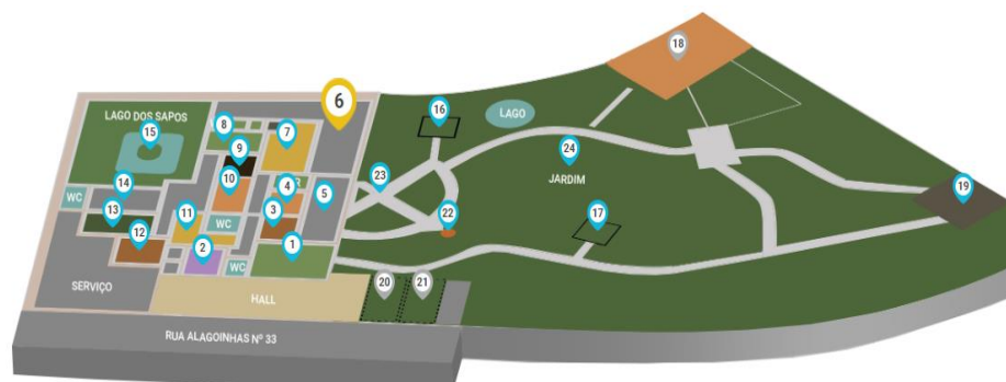
Figura 22 - Mapa de localização dos ambientes do museu