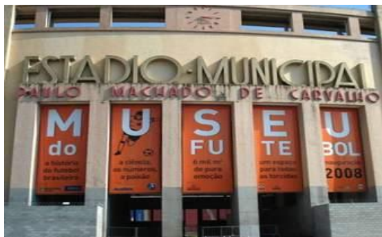
Figura 5 - Museu do Futebol