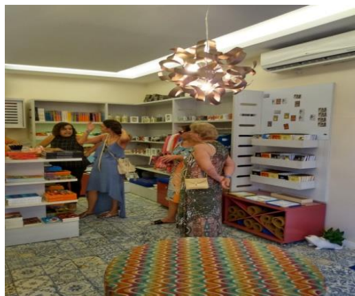
Figura 20 – Loja de souvenirs

A estrutura do museu é dividida em dois pavimentos. No térreo está localizada a entrada do museu junto a recepção, e uma loja de artigos, onde é possível adquirir souvenirs (que pode ser visto na figura 20 abaixo) e exemplares de algumas das obras escritas pelos autores. E no pavimento superior, está localizada a casa/museu.