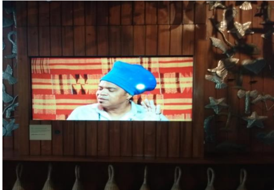
Figura 11 – Reprodução de documentário temático (espaço "Roda de conversa sobre Jorge Amado")