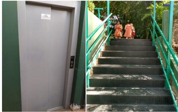
Figura 21 – Acesso ao museu

O acesso entre ambos os ambientes é feito através de escadas localizadas na parte interna lateral do ambiente; e para o público portador de necessidades especiais, ou com limitações de deslocamento, o museu pode ser acessado através de elevador também localizado na região interna do museu. A figura 21 abaixo detalha: