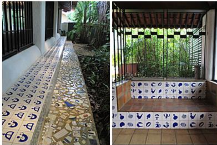
Figura 10 – Reprodução dos azulejos de Caribé