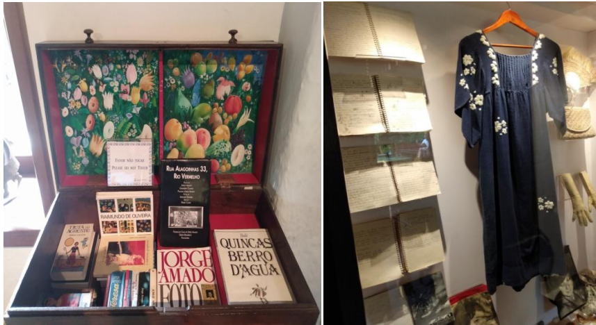
Figura 17 – Baú de livros; cadernos de receita familiar; vestuário (Zélia)

A curadoria também preparou a casa no sentido do aprimoramento das caracterizas de cada espaço. Cada compartimento remonta de forma muito particular o perfil do seu antigo ocupante. Cada móvel e cada objeto foi disposto estrategicamente para dar evidencia e chamar atenção para alguma peculiaridade dos membros da família, ou de alguma história ou significado especial. Pode-se ter uma visão geral do mencionado a partir das figuras 17 e 18 abaixo: