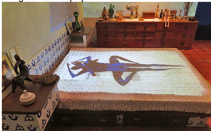
Figura 13 – Espaço "Amores e Amantes"