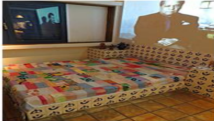
Figura 14 – Espaço “A amizade é o sal da vida”