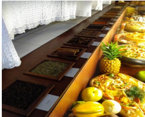
Figura 19– Especiarias da cozinha de Dona Flor.