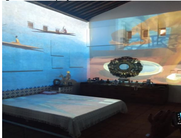
Figura 15 – Espaço “Amores e Amantes”