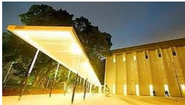
Figura 3 – Museu da Imagem e do Som

Localizado no estado do Rio de Janeiro, o museu da Imagem e do Som foi pioneiro no Brasil no que diz respeito ao uso dos recursos audiovisuais. Hoje, o museu da Imagem e do Som possui mais de 350 mil itens em seu acervo que evidenciam a riqueza da cultura brasileira, em especial da sociedade carioca.