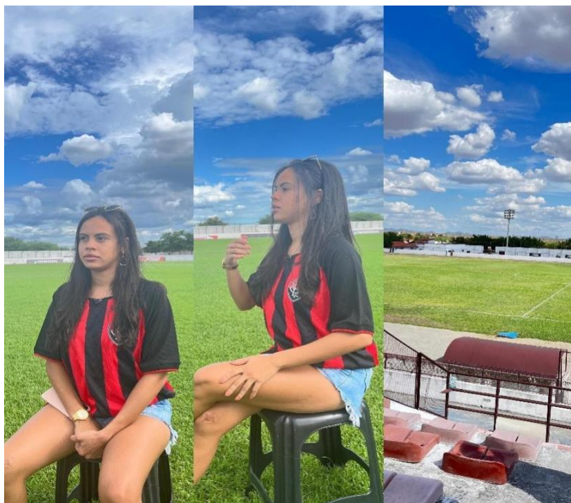
Figurinha 4: Entrevista, 2024.

A captura de imagens e áudios foi realizada com o apoio de Daiane Moreira, cuja participação foi fundamental para a execução técnica da gravação. Utilizamos também o gravador de um smartphone como recurso adicional para a captação de áudio, garantindo a clareza e a qualidade do material produzido.