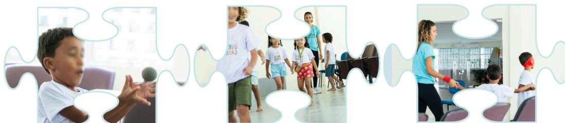
Imagem 3: Fotos do processo de ensino.