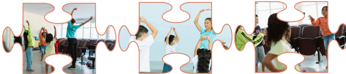
Imagem 2: Fotos do processo com jogos teatrais.