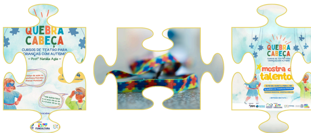
Imagem 1: Cartazes de divulgação do curso e da mostra produzidos pelo Designer Adriano Alves.