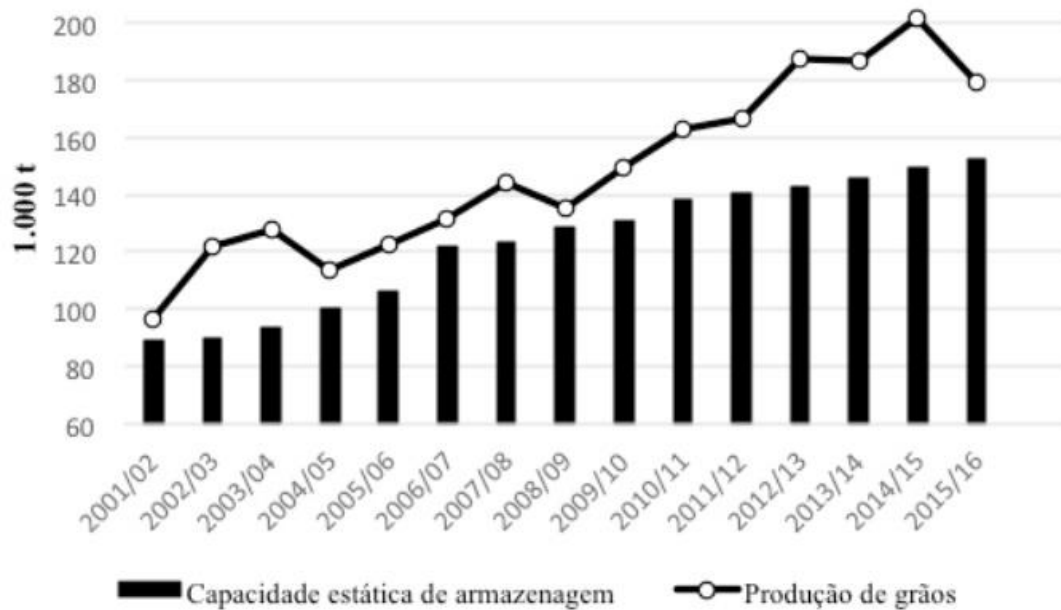
Figura 1: Capacidade de armazenagem versus produção de grãos no Brasil

Conforme a Figura 1 nota-se o crescimento da produção e da capacidade estática de armazenagem de grãos no Brasil, no período de 2001 a 2016. Com isso, fica evidente a disparidade entre elas. Enquanto a produção cresceu 35% no período de 15 anos, a capacidade estática aumentou 23%; ou seja, os investimentos realizados nas estruturas de armazenagem não foram suficientes para acompanhar a produção.