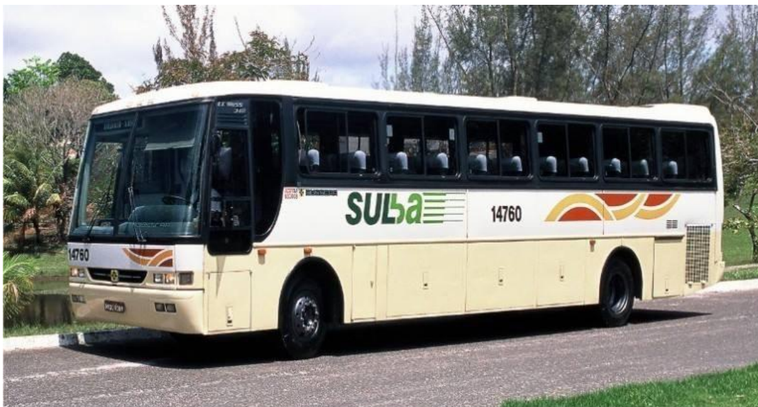
FIGURA Nº 03 13