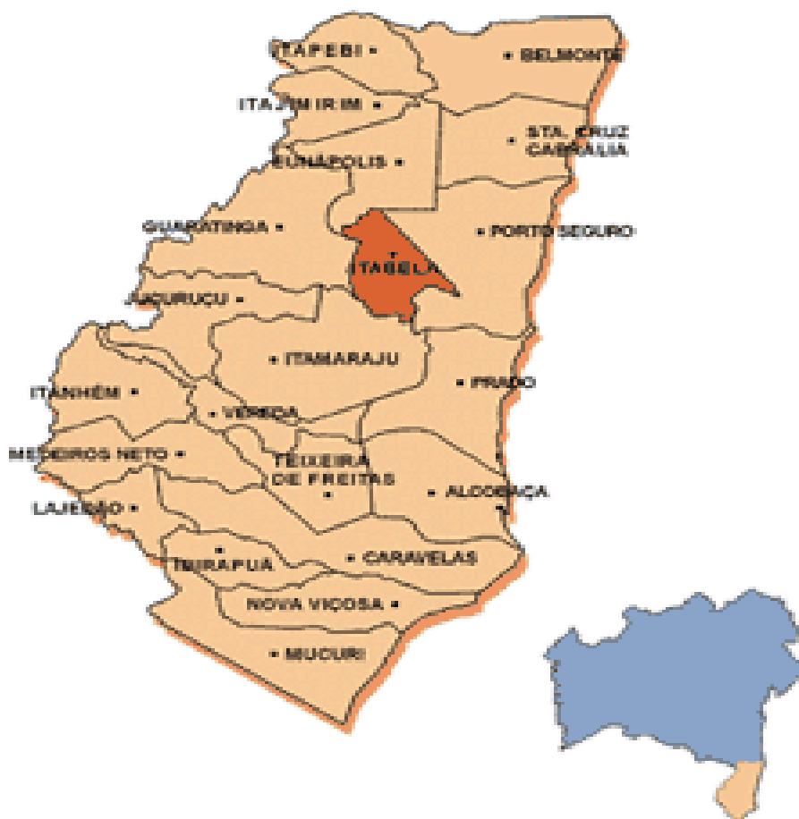
FIGURA Nº 01. 4