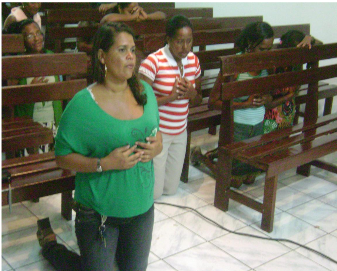
Fotografia: ato de devoção. Pesquisa de campo, janeiro de 2010. A autoria: Alex Sandro da Conceição Brandão.

momento desse ritual que envolve o ato de fazer novos pedidos e ao mesmo tempo agradecer aos Reis por uma graça alcançada.