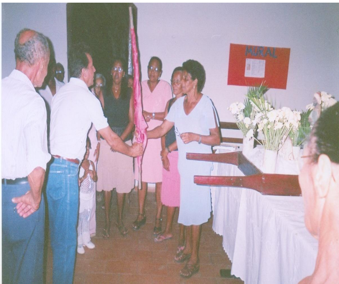
Fotografia do ritual de transmissão da bandeira da festa dos Santos Reis. Pesquisa de campo em janeiro de 2006.

seja, aquela que terá a responsabilidade de organizá-la no ano seguinte, juntamente com a comissão responsável pelo aspecto religioso da manifestação, que tem a missão de organizar as novenas, relacionar os nomes dos palestrantes a serem convidados para cada dia, fazer referência aos homenageados da noite, enfim, ornamentar a igreja para esse momento de fé e devoção. Esse ritual de transmissão da bandeira da festa dos Santos Reis de Aldeia fica evidenciado na análise da fotografia abaixo.