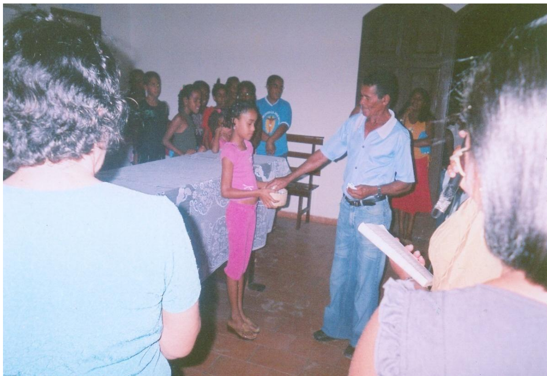
Fotografia do ritual do ofertório. Pesquisa de campo em janeiro de 2005.

presentes. Cantando e ofertando, os participantes procuram demonstrar toda sua crença ao tempo em que reforça sua relação de fidelidade com seu santo protetor. Formando uma espécie de coral, os fiéis entoam o cântico das ofertas, ao passo que se dirigem até o local para depositar suas ofertas e fazendo o sinal da cruz ou curvando o corpo diante do altar como sinal de reverência às imagens dos três Reis Magos que lá se encontram. Esse ritual do ofertório é demonstrado na fotografia abaixo