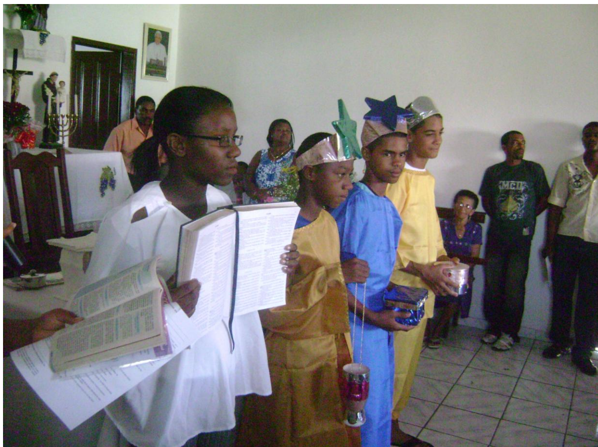
Fotografia dos Três Reis Magos. Trabalho de campo em janeiro de 2010.