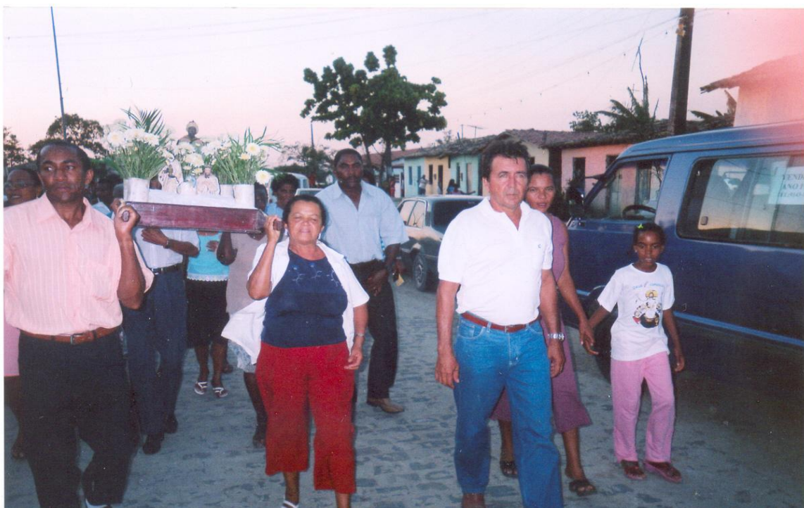
Fotografia da Procissão em louvor aos Santos Reis. Pesquisa de campo, janeiro de 2005.

sagrado reafirmando, assim, sua devoção junto ao santo padroeiro. A fotografia abaixo registra um momento no percurso da procissão: