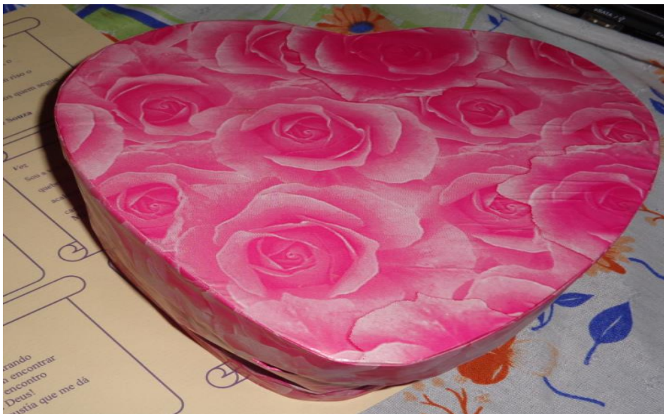
Foto 3 – caixa de presente utilizada na dinâmica do espelho

A imagem, que segue, trata-se da caixa que foi utilizada para a dinâmica do espelho, a caixa em formato de coração foi confeccionada por mim, com papel rosa com desenhos de rosas, tornando uma imagem bastante harmoniosa, para as mulheres, escritoras, mães etc. com as quais estávamos trabalhando nos Ateliê, despertando ainda mais a curiosidade para saber o que poderia estar guardado naquela graciosa embalagem.