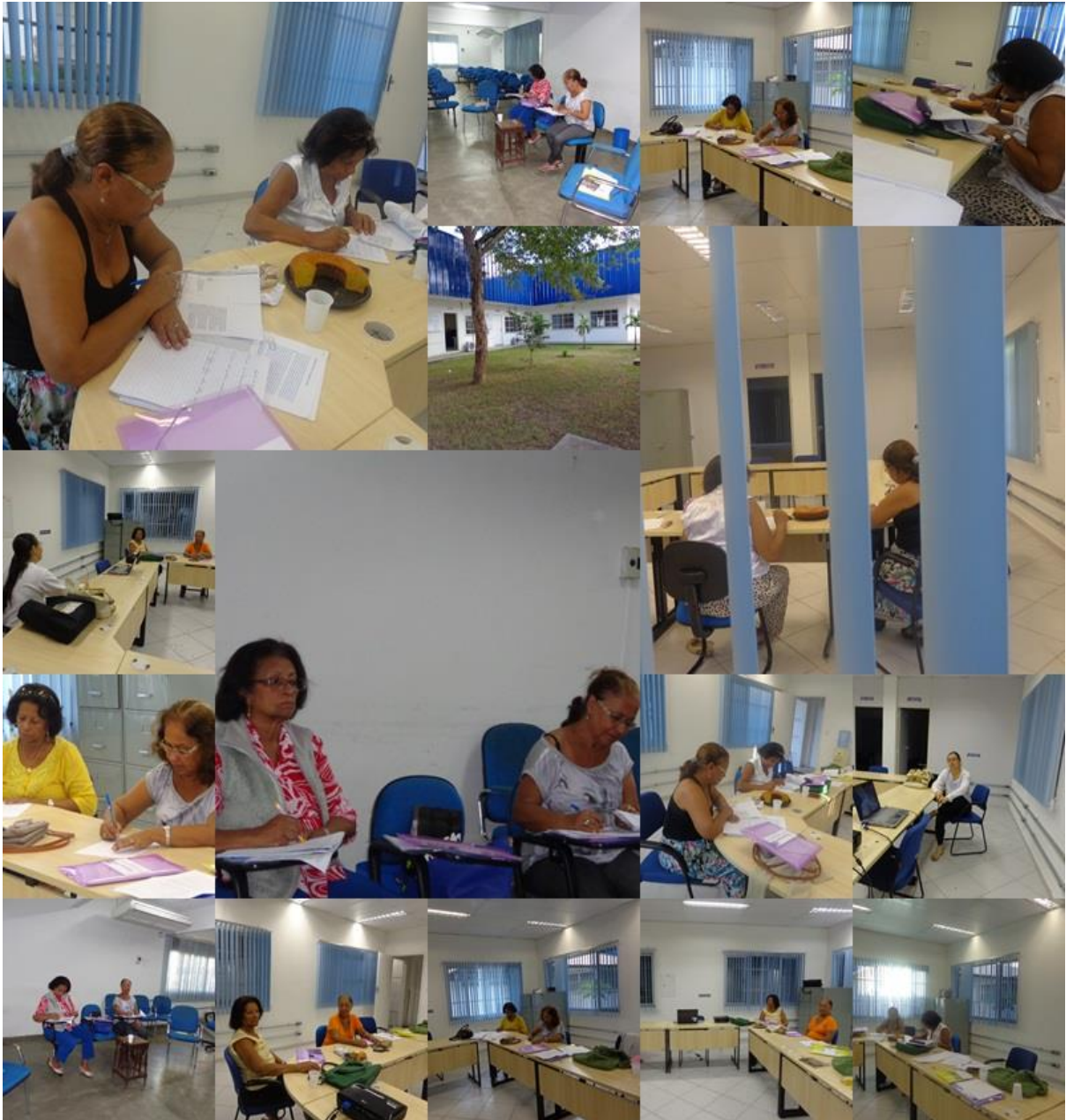
Figura 8 – imagens das escritoras produzindo no ateliê autobiográfico