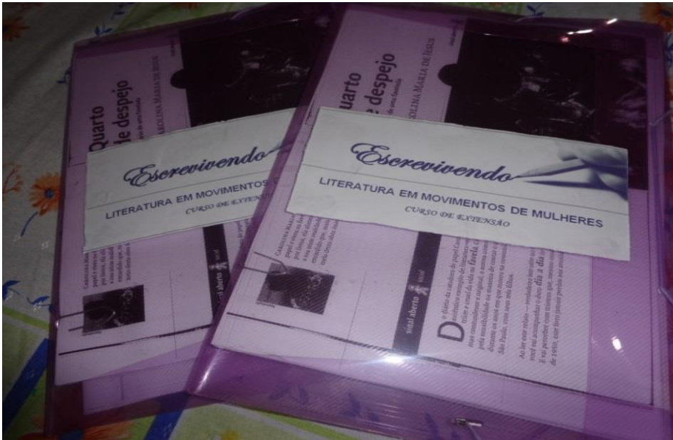
Foto 2 - Pasta com materiais utilizados no curso.

para que fosse feita a leitura em casa, assim como caneta, papel pautado e ofício e cópias de textos de Conceição Evaristo. Conversamos sobre as escritoras que iríamos trabalhar no curso. A escolha da cor lilás dos classificadores foi feita por se tratar da cor que simboliza as lutas feministas, nossas lutas cotidianas.