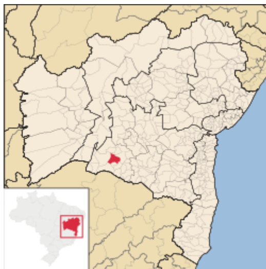
Figura 1 – Mapa da Bahia com a localização em destaque do município de Guanambi

avanços na saúde e no crescimento econômico, têm elevado o Índice de Desenvolvimento Humano Municipal – (IDHM) do município, embora ainda existam desafios a serem superados (Guanambi, 2020).