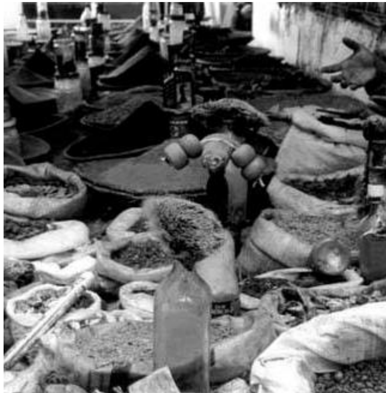
Antiga Feira do Rato na Santo Dumont

Os alunos estão cada vez mais imersos no meio digital, onde as redes sociais garantem-lhes acesso a uma quantidade alta de fotografias, no entanto, o uso da fotografia como um instrumento de pesquisa histórica não é suficientemente explorado. Contudo o uso da fotografia no projeto ajuda os alunos a cultivar uma abordagem crítica à fotografia e a prática da interpretação de imagens, dessa forma, o uso de imagens antigas possibilita que o aluno realize a leitura e a análise crítica de uma fonte fotográfica, promovendo comparações e compreendendo as mudanças ao longo do tempo.