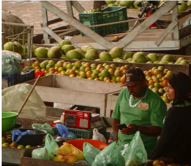
Barracas e vendas Fonte:Zamerim 12

elementos se desenvolvem de maneira interligada no mesmo contexto e espaço. A feira é construída a partir de sua materialidade, representada pelas barracas, frutas, tabuleiros e todos os elementos físicos que compõem sua estrutura.