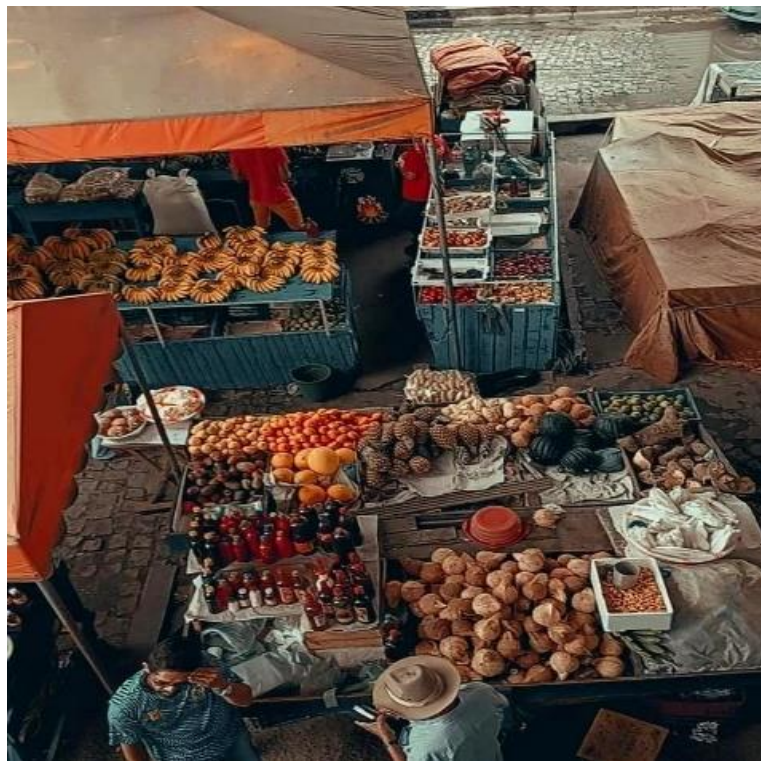
Mercado Central Dona Alzira (Feira do Bueiro)

As feiras livres, enquanto espaços de comercialização e troca, desempenharam um papel crucial nesse processo, servindo como pontos de encontro entre a população rural migrante e a urbanização crescente. Elas não só contribuíram para a fixação de migrantes na cidade, mas também se tornaram centros econômicos essenciais, estimulando o crescimento urbano e a adaptação de uma população originária do campo às novas demandas da vida urbana.