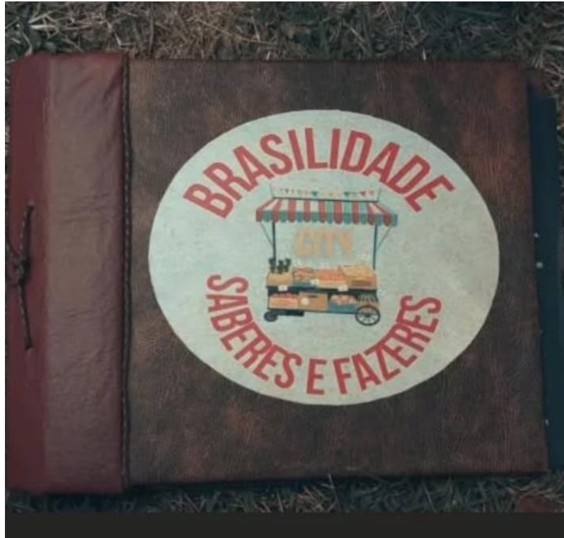
Capa do álbum Brasilidade City. 19

O álbum, segundo o regulamento do EPA (2022), deve ser formado por 20 páginas, com a utilização necessária de imagens inéditas. Embora o projeto tenha regras, ele também permite a liberdade de como o álbum pode ser montado e organizado, buscando compreender que o projeto não se constrói apenas reconhecendo os patrimônios por meio das pesquisas e fotos, mas também com a parte artística e organizacional do álbum. Isso revela a identidade dos alunos, como eles compreendem os patrimônios próximos, sendo suas experiências materializadas no álbum.