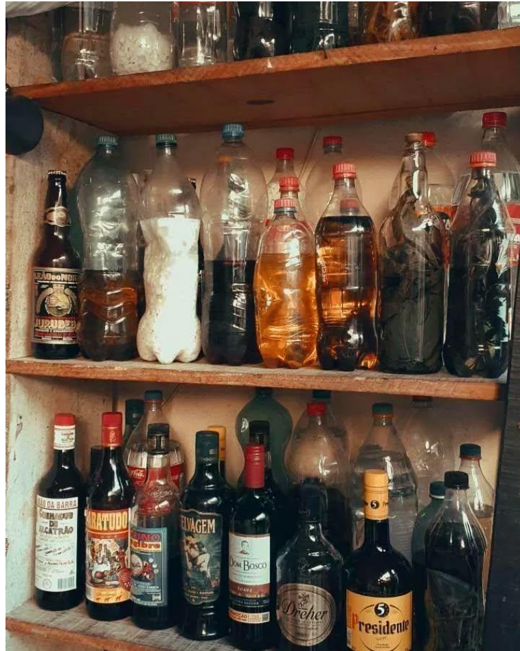
Entre garrafadas e bebida

A feira se desenvolve a partir dos produtos e do processo de venda, mas está intrinsecamente relacionada ao poder simbólico que permeia essas práticas. garrafada vendida em uma barraca não é apenas fruto de uma negociação entre o feirante e o cliente; ela carrega em si um simbolismo construído por saberes e práticas transmitidos de geração em geração. Como destacou dona Sebastiana ao aprender com sua avó e repassar esses conhecimentos para sua neta, há um valor histórico que vai além do aspecto econômico, tornando-se parte de um processo de preservação da memória coletiva.