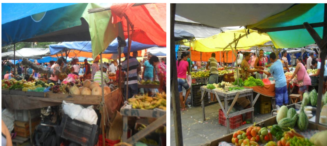
Figura 08 e 09 : Feira- Livre de Jacobina Fonte: Arquivo Pessoal, maio de 2015.

O manejo dos alimentos, a circulação de pessoas, os gestos dos sujeitos que fazem a feira, prefiguram um ciclo com verdadeira riqueza de interação. A feira apresenta-se como lugar de produção do cotidiano, das vivências ancoradas na maneira de interação dos indivíduos que compõem este cenário, transformando-o em um ambiente de fazeres e dizeres.