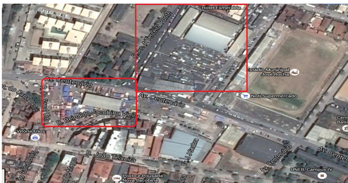
Figura 5: Imagem de Satélite da Feira- livre de Jacobina

Se este mercado elementar, igual a si próprio, se mantém através dos séculos é certamente porque, em sua simplicidade robusta, é imbatível, dado o frescor dos gêneros perecíveis que fornece, trazidos diretamente das hortas e dos campos das cercanias. Dados também seus preços baixos, pois esse mercado elementar, onde se vende, sobretudo “sem intermediários” é a forma mais direta, mais transparente de troca, a mais bem vigiada, protegida contra embustes (BRAUDEL, 1998, p. 15)