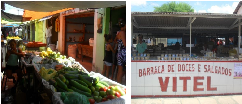
Figura 10 e 11: Centro de Abastecimento, Feira- Livre de Jacobina

A feira-livre é o palco do “povo”, cuja simplicidade manifesta em algumas bancas, nas próprias pessoas, nos seus pequenos gestos e largos sorrisos, ela também está presente nos agradecimentos refletidos nos rostos daqueles que fazem, experienciam e vivem a feira-livre.