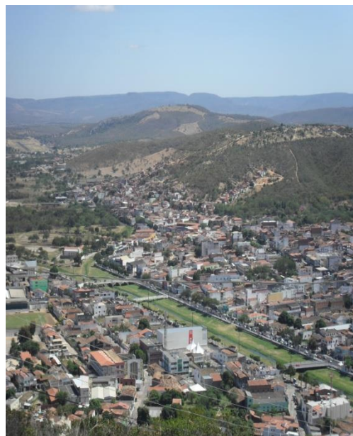
Figura 2: vista da cidade de Jacobina 2013

A história da cidade é antiga inicia no século XVII, e seu povoamento se dá devido às missões jesuítas, a pecuária que contribuiu para o surgimento da feira e a mineração, Gomes (1952). Com destaque a essa última, que por conta da mineração, Jacobina passa a ser conhecida como “cidade do ouro”.