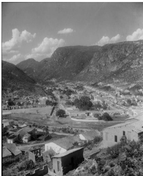
Figura 1: vista da cidade de Jacobina 1962