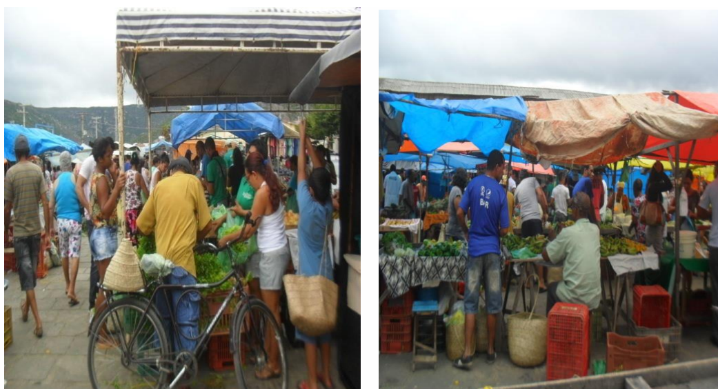
Figura 6 e 7: Imagem da Feira- livre de Jacobina Fonte: Arquivo Pessoal., Abril de 2015.

As relações que se iniciam a partir da compra de determinado produto ultrapassam à medida que o feirante trata o seu freguês de maneira mais cordial, quando dar-se a liberdade de ultrapassar a frente da barraca, quando escolhe e separa o melhor produto, isso cria uma cumplicidade e torna o então simples freguês em “fregueses fieis” e amigos.