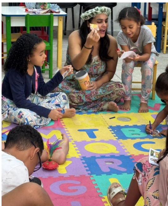
Figura 13 - Bingo com palavras indígenas.

Acerca disso, associar práticas lúdicas à contação de histórias mostrou-se uma estratégia pedagógica eficaz para tornar o ato de ler mais significativo e prazeroso. E contribui diretamente para o desenvolvimento de competências leitoras e para a construção de uma relação afetuosa e positiva com a literatura.