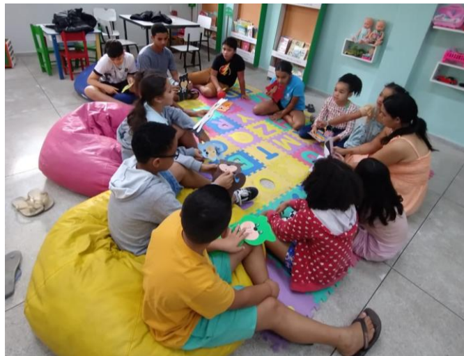
Figura 15 - Momento da brincadeira com rimas.