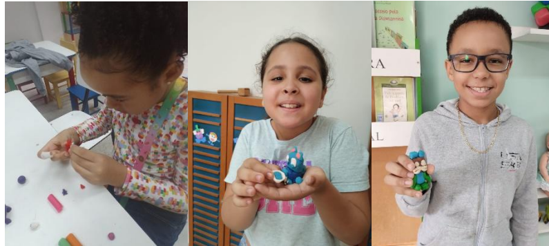
Figura 14 - Produção artística com massinha.