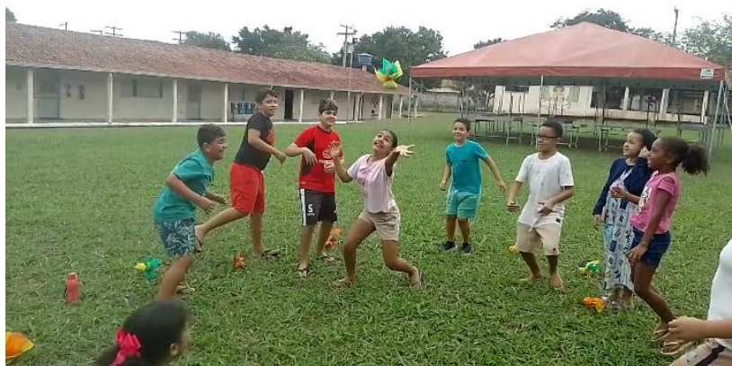
Figura 10 - Crianças jogando com as petecas confeccionadas por elas.