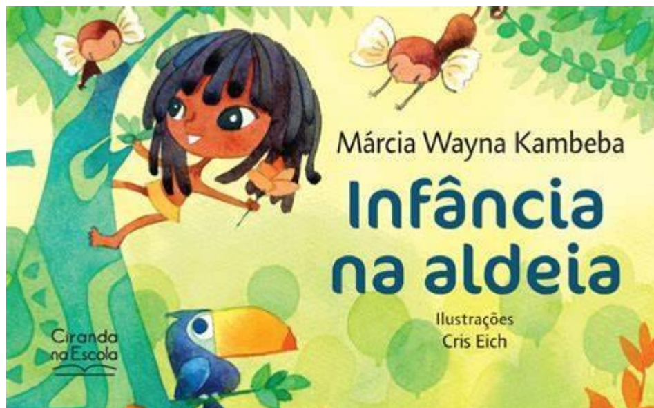
Figura 3 - Capa do livro Infância na Aldeia .