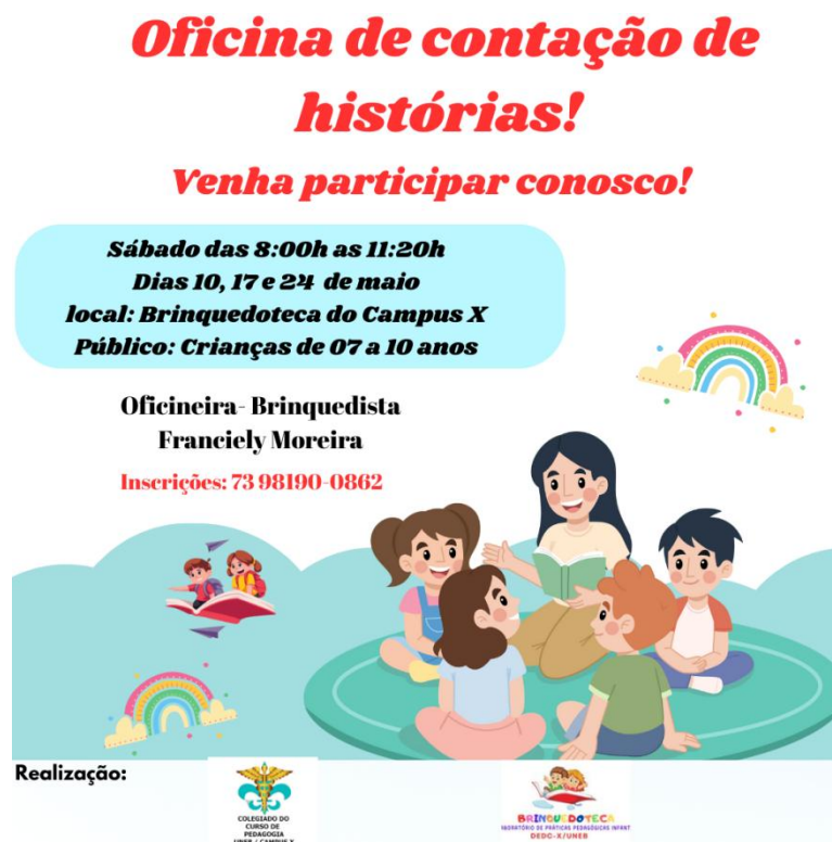
Figura 1 - Card da oficina de contação de histórias.