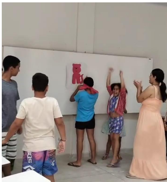
Figura 12 - Brincadeira rabo do gato