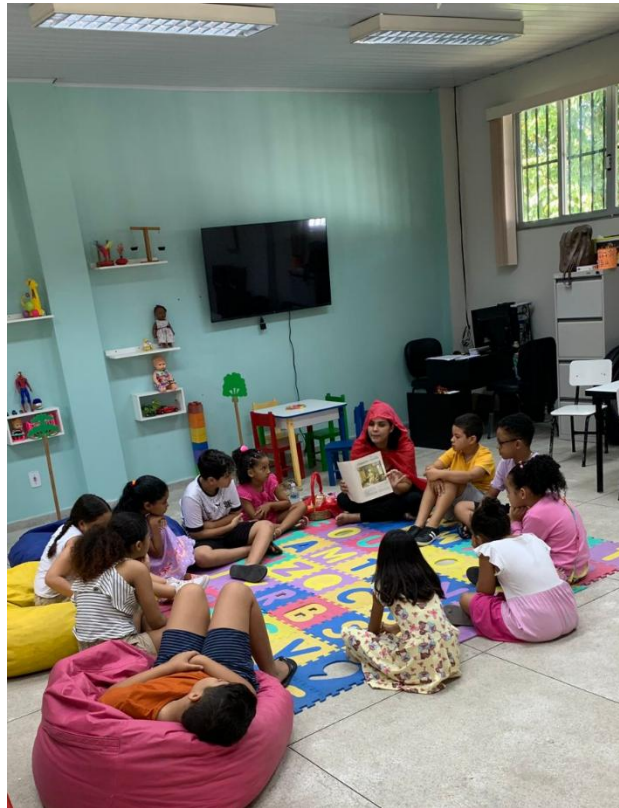
Figura 8 - Momento da contação de história.