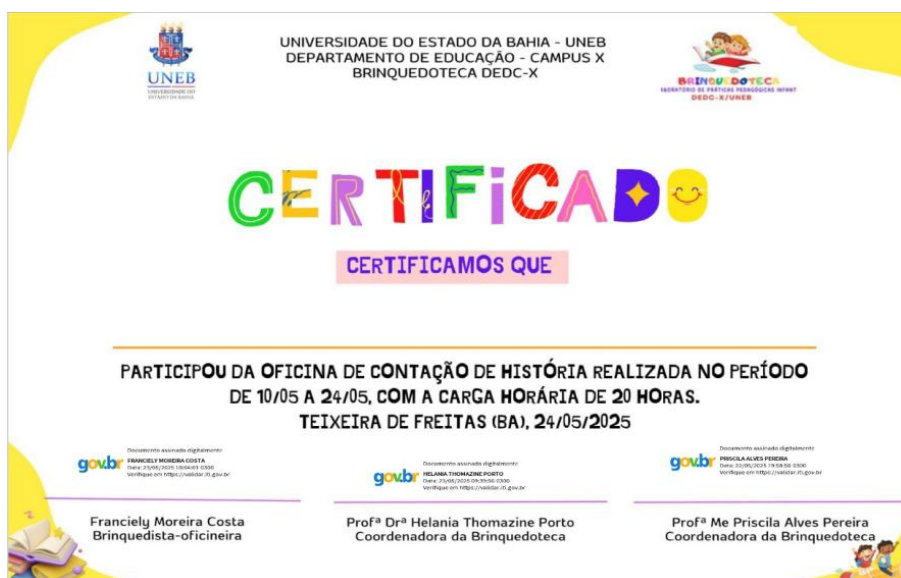
Figura 6 - Certificado da oficina de Contação de histórias.

Ao final das atividades, no último dia, foram entregues para cada criança o certificado de participação na oficina de contação de histórias.