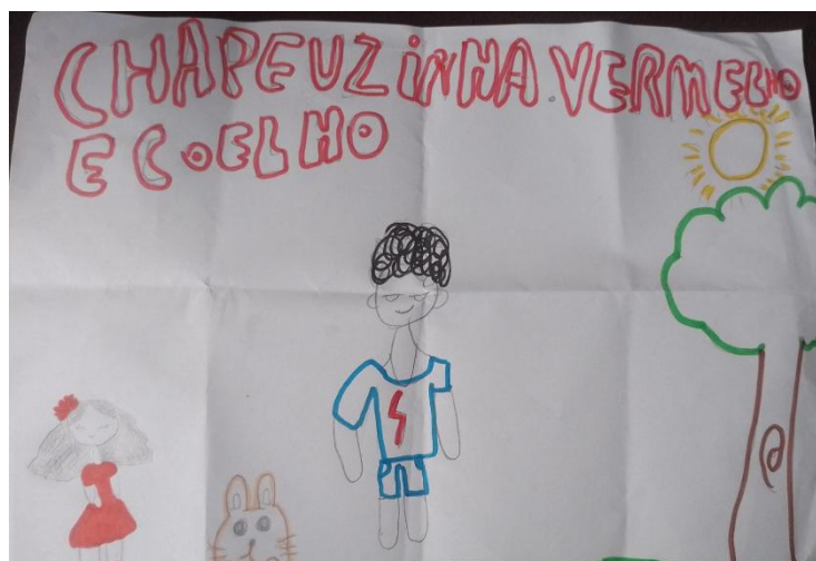
Figura 7 - Recriação da história do chapeuzinho vermelho.