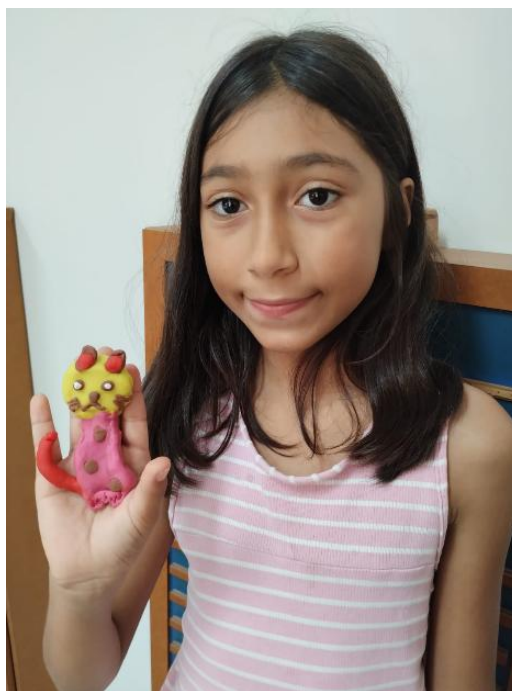
Figura 11 - Produção artística com massinha.