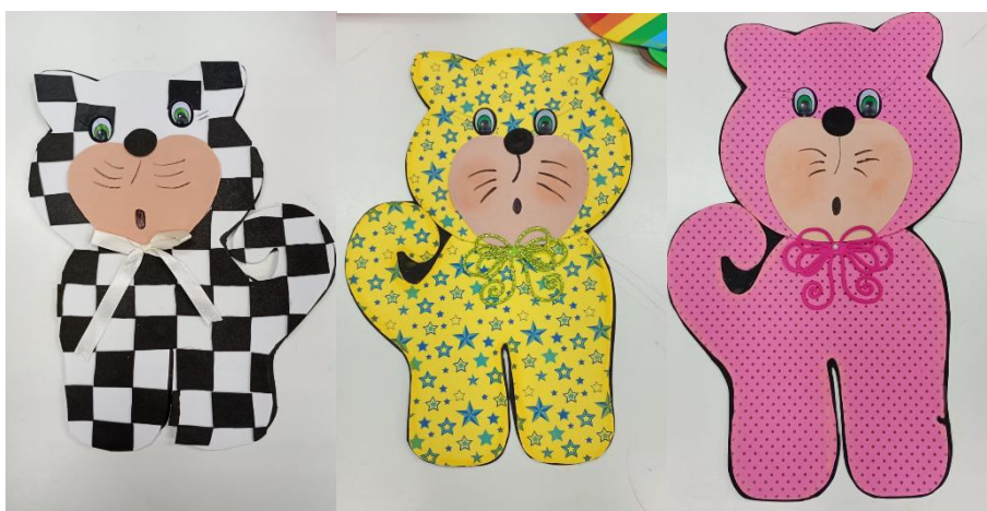
Figura 5 - Fantoches do livro Era uma vez o Gato Xadrez .

No primeiro momento, foi realizada a contação da história O Gato Xadrez , por meio de fantoches. A narrativa capturou a atenção do grupo, criando um ambiente envolvente e participativo. Após a leitura, foi promovida uma conversa com as crianças sobre o conteúdo da história, estimulando-as a refletirem e expressarem suas opiniões. Foram feitas perguntas como: qual foi sua parte favorita? qual gato você mais gostou? você já viu um gato parecido? Esse diálogo favoreceu o exercício da linguagem oral e a construção de sentidos sobre o texto.