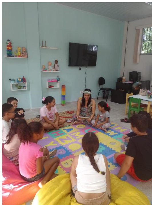
Figura 9 - Momento de escuta e reflexão.