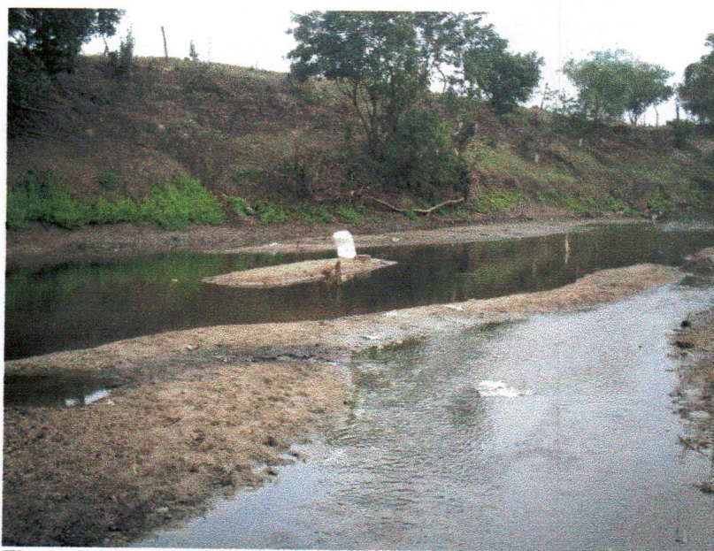
Figura 3 – Trechos do Rio do Peixe, onde é lavado o couro Foto: Roseane Carneiro, 2007.

Em campo foi observado que a fase inicial do processo de curtimento de couro nos Povoados do Malhador e Rio do Peixe é realizada próximo ao rio do Peixe (Figura 3), sendo que o processo da retirada do sal é feito diretamente no rio. Além disso, todos os dejetos provenientes do curtimento do couro são