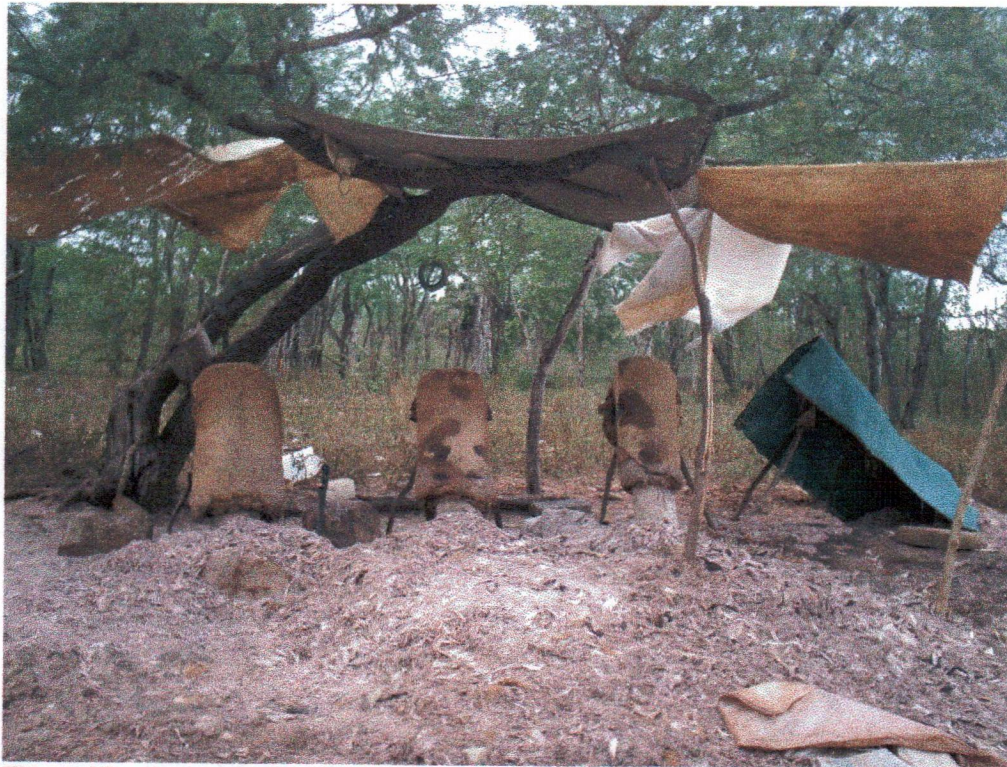
Figura 07 – Curtume de caprino e ovino no Povoado Rio do Peixe/Ipirá-BA Foto: Roseane Carneiro, 2007.