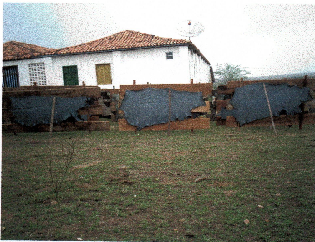
Figura 09 – Curtume de Couro azul no Povoado do Malhador /Ipirá-BA. Foto: Roseane Carneiro, 2007.