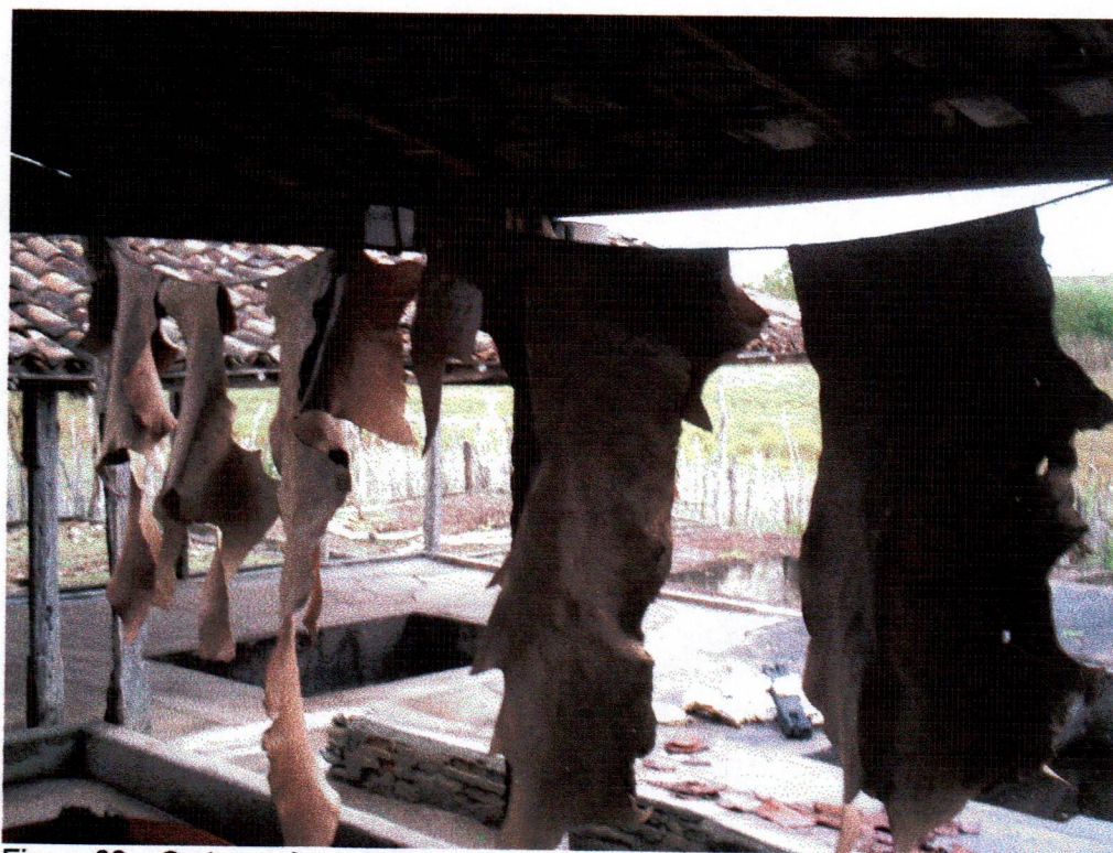
Figura 08 – Curtume de gado bovino no Povaado Malhador/Ipirá-BA Foto: Roseane Carneiro, 2007.