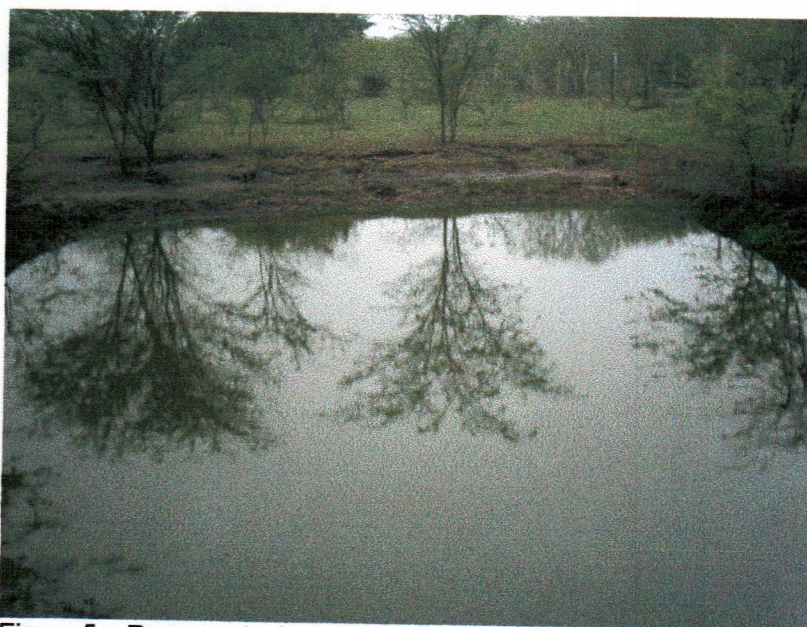
Figura 5 – Represa de água do curtimento do couro azul