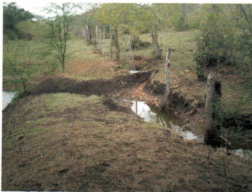
Figura 6 - Canal que dá acesso ao Rio do Peixe

Diante dos fatos, podemos perceber vários problemas ambientais que a indústria de couro no município de Ipirá vem causando ao meio ambiente. A falta de conscientização da população local sobre a importância da preservação dos recursos naturais, bem como o desleixo pelo