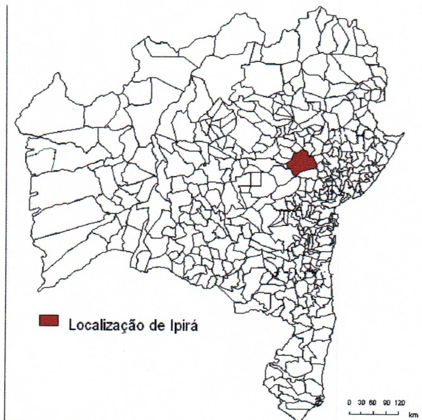
Figura 2 – Localização Geográfica do município de Ipirá na Bahia.

Segundo dados da SEI (2000), o município é composto por 02 distritos: Bonfim e Sede; e 10 povoados: Alto Alegre, Caixa D'Água, Coração de Maria, Ipirazinho, Malhador, Nova Brasília, Pau Ferro, Rio do Peixe, São Roque, Umburanas. Porém, existem outros que não estão registrados, tais como: Conceição, Jacaré, Rosário, Santa Rita e Vida Nova, totalizando 16 povoados.