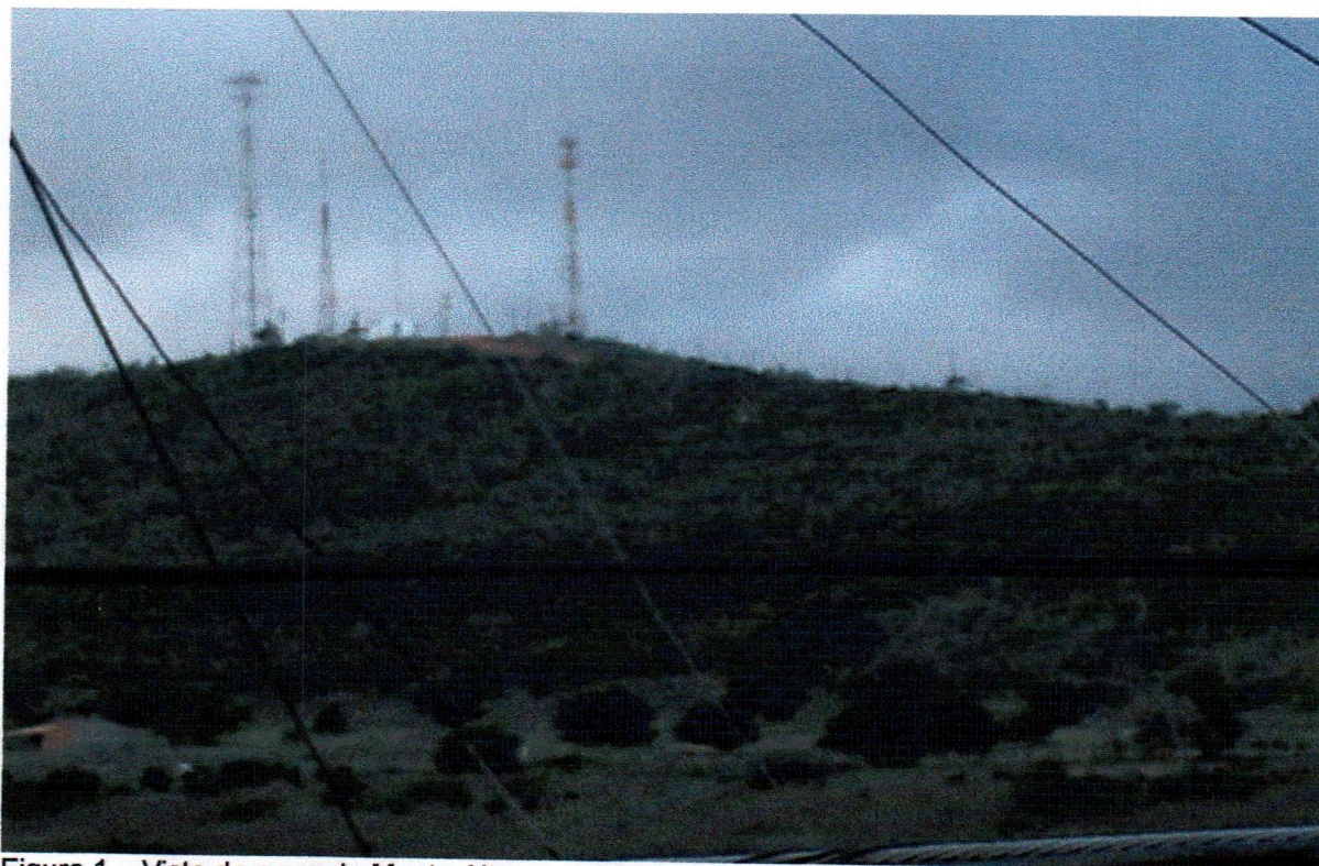
Figura 1 – Vista da serra do Monte Alto Foto: Roseane Carneiro, 2007.

É dentro dessa dinâmica que surge o município de Ipirá, cujo povoamento, teve início no desbravamento do sertão com estabelecimentos de gados, e posteriormente, servindo como pontos de paradas obrigatórias de boiadas e tropas que demandavam ao litoral e lavras, surgindo uma pequena comercialização entre eles. A primeira aglomeração ocorreu nas proximidades da serra do Camisão, localizada próximo ao Monte alto, nesta cidade (figura 1), onde surgiram vários ranchos que se dedicavam ao criatório de gados, sendo o mais importante o de Gaspar Araújo Pinho, que foi construído em agosto de 1757.