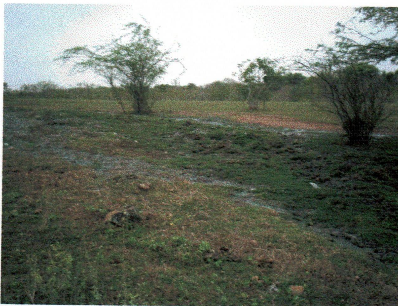
Figura 4 – Dejetos do curtume de Couro azul no meio ambiente

Conforme os gerentes dos curtumes, nunca houve fiscalização no local, nem municipal e estadual. Em entrevista com o Secretário da Agricultura Darlan Gomes e o Prefeito Municipal Diomário Sá, os mesmos também afirmaram que não existe no município um órgão fiscalizador para a questão ambiental. Segundo o prefeito, já