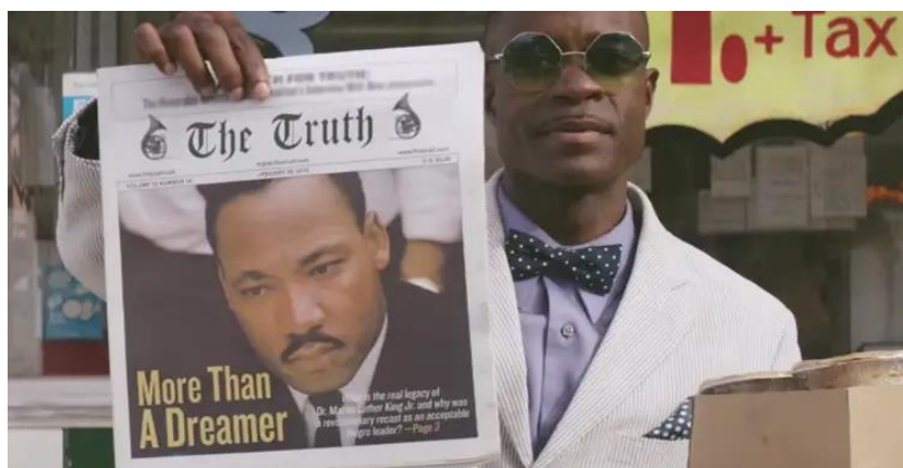
Imagem retirada do clipe ‘ Formation ’

O ativista e líder do movimento negro Martin Luther King aparece no vídeo clipe da música sendo mostrado na capa do jornal The Truth (A Verdade) com título More Than A Dreamer , ressaltando uma gigantesca referência ao seu discurso de 1963, ‘ Eu Tenho um Sonho ’. Segundo o site Eolor (2020): “Beyoncé lembra ao público que o que antes era um sonho se tornou realidade. Apesar do racismo ainda prevalecer nos EUA, a “Lei dos Direitos Civis de 1964” e os “Direitos de Voto de 1965” foram sim aprovadas em resposta à luta constante”.