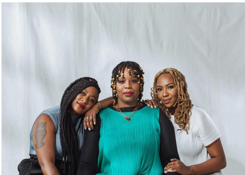
(Alicia Garza, Patrisse Cullors, Opal Tometi)

Toda a construção do movimento Black Lives Matter teve sua motivação inicial pela indignação dessas três mulheres negras ativistas após a absolvição de George Zimmerman, policial branco que assassinou o jovem negro, Trayvon Martin, a tiros nos EUA. Alicia Garza postou um texto no Facebook intitulado ‘Uma carta de amor para os negros’. Na publicação dizia: “Não merecemos que nos matem com impunidade. Precisamos amar a nós mesmos e lutar por um mundo onde as vidas negras importem. Pessoas negras, amo vocês. Amo-nos. Importamos. Nossas vidas importam.” Patrisse Cullors respondeu o post de sua amiga com a hashtag #BlackLivesMatter e Opal Tometi abraçou a campanha também. Contudo, as manifestações de rua ganharam notoriedade globalmente no ano de 2014 seguido da hashtag , que viralizou após a morte de Michael Brown e Eric Gamer.