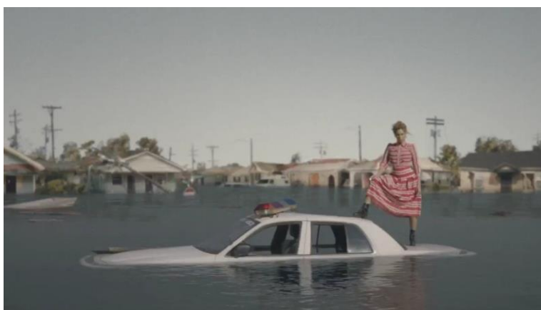
Imagem retirada do clipe ‘ Formation ’, Beyoncé fazendo referência ao Furacão Katrina na cidade de Nova Orleans em 2005

Logo no início da canção, a interprete de ‘ Formation ’, traz Messy Mya, um rapper negro americano morto a tiros pela polícia com apenas 22 anos de idade em Nova Orleans, cidade onde morava, exclamando: ‘ What happened at the New Orleans? ’ numa tradução livre fica ‘ O que ocorreu em Nova Orleans? ’ trazendo uma grande referência para a calamidade na região após a passagem do Furacão Katrina em 2005, afetando principalmente a população negra do local e o descaso dos governantes perante a comunidade afro-americana. Segundo o site Teoria e Debates (2007): Dos 500 mil habitantes da área metropolitana de Nova Orleans, pelo menos 200 mil ainda não haviam voltado dois anos depois, constituindo uma diáspora interna inédita na história dos EUA. Enquanto antes do furacão 67% da cidade era composta por negros, estima-se que hoje os afro-americanos não perfazem mais que 30% da população.