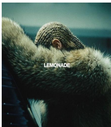
Imagem original na capa do álbum oficial " Lemonade ". (Foto: Divulgação/retirado do site Beyoncé).

Lemonade nos proporciona enxergar um lado extremamente pessoal da cantora, é de cunho social e político com mensagens antirracistas, de valorização da identidade, do feminismo, da afirmação cultural e do pertencimento de pessoas pretas.