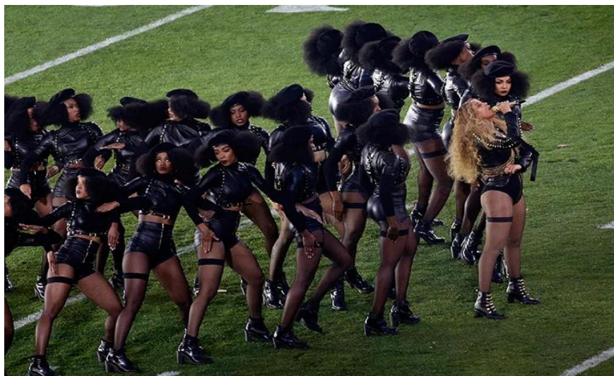
Beyoncé junto com suas dançarinas, Super Bowl (2016)

a memória de África, lugar perdido e achado, transcriado perenemente pela performance ritual.”