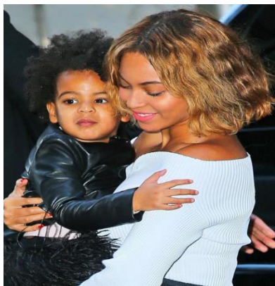
Blue Ivy e Beyoncé