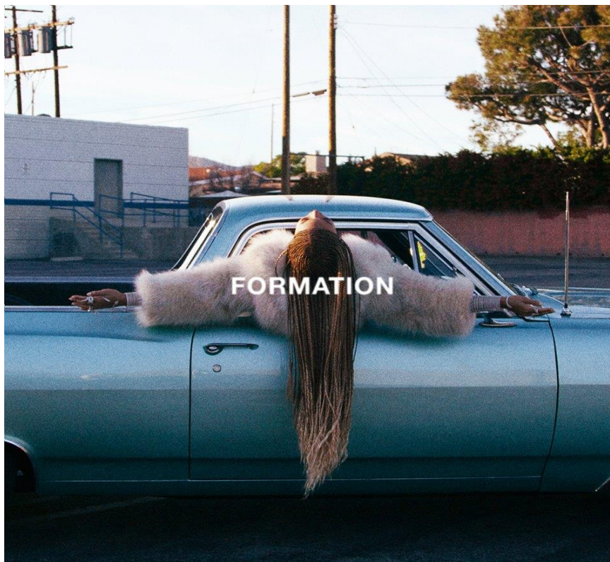
A capa do single " Formation ".

Com quase 30 anos de carreira, Beyoncé nunca lança nada se não houver um propósito maior por trás. Dito isso, a data que o single ' Formation ' foi lançado na mesma semana que Trayvon Martin (2012) e Sandra Bland (2015) comemorariam aniversário, mais duas pessoas pretas que foram brutalmente assassinadas por policiais no país. Como diz historiadora Maria Luiza Tucci Carneiro: "O racismo camuflado é traiçoeiro: não se sabe exatamente de onde vêm. Tanto pode se manifestar nos regimes autoritários quanto nos democráticos" (CARNEIRO, 1997, p.07).