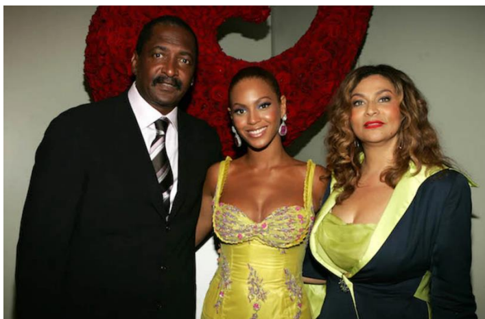
Mathew Knowles (pai), Beyoncé Giselle Knowles-Carter e Célestine Ann "Tina" Knowles-Lawson (mãe).

Alabama, minha mãe é do Louisiana/ Você mistura aquele negro com aquela crioula e faz uma texana revoltosa”.