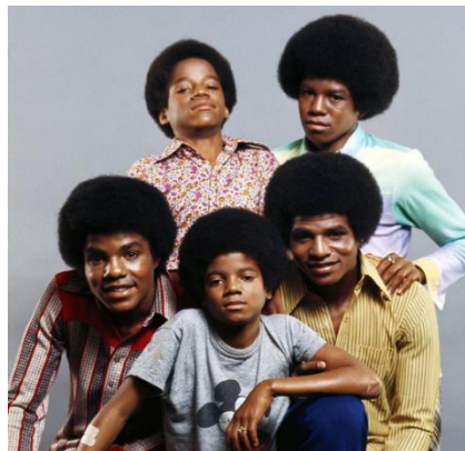
The Jackson 5

O ativista e líder do movimento negro Martin Luther King aparece no vídeo clipe da música sendo mostrado na capa do jornal The Truth (A Verdade) com título More Than A Dreamer , ressaltando uma gigantesca referência ao seu discurso de 1963, ‘ Eu Tenho um Sonho ’. Segundo o site Eolor (2020): “Beyoncé lembra ao público que o que antes era um sonho se tornou realidade. Apesar do racismo ainda prevalecer nos EUA, a “Lei dos Direitos Civis de 1964” e os “Direitos de Voto de 1965” foram sim aprovadas em resposta à luta constante”.