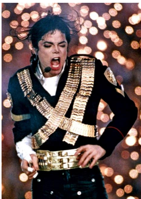
Michael Jackson, Super Bowl (1963)

Na apresentação alucinante para o Super Bowl 50 (2016), Beyoncé traz a primeira apresentação ao vivo de ‘ Formation ’, lead single do seu sexto álbum de estúdio “ Lemonade ”. Essa performance só fez reiterar a mensagem do show. Ela aparece vestida com uma jaqueta preta com ‘X’ dourada referenciando ao primeiro Super Bowl (1963) estrelado por Michael Jackson, que foi o primeiro cantor a performar no intervalo do maior espetáculo de futebol americano.