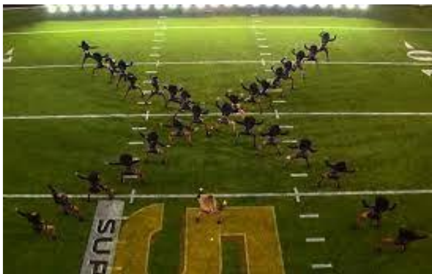
Beyoncé junto com suas dançarinas, Super Bowl (2016)

2016, mostrando ao mundo a poderosa canção ‘ Formation ’. Ela fez uma participação no show da atração principal que era a banda britânica Coldplay, trazendo uma clara referência ao Partido dos Pantera Negras, com um figurino totalmente preto com um ‘X’ no meio do peito em dourado, o modelo da roupa faz menção ao figurino usado pelo cantor Michael Jackson na sua apresentação do Super Bowl (1993). As dançarinas de Beyoncé estavam na mesma paleta de cor da cantora. Durante a coreografia, um ‘X’ foi feito no meio do campo, fazendo menção ao Partido dos Panteras Negras como ao ativista afro-americano Malcolm X, um dos grandes influenciadores para que o partido ganhasse força e tivesse notoriedade global. Abaixo segue reprodução de foto do “xis” desenhado pelos corpos das dançarinas: