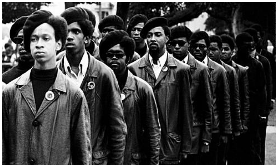
The Black Panthers: Vanguard of the Revolution, documentário de 2015, conta a história do movimento revolucionário estadunidense

Motivados pelos pensamentos e ensinamentos de Malcolm X, Newton e Seale foram importantes para a construção do Partido dos “Panteras Negras”, um movimento com propósito primordial no combate à violência policial, essencialmente na busca em incentivar os afro-americanos a buscarem seus direitos civis como também no cuidado e no zelo perante os membros da comunidade. “Nós usamos a “Pantera Negra” como símbolo porque na natureza as panteras não atacam ninguém, mas quando é atacada ela vai recuar, mas se o agressor continuar, atacando então ela ataca” (BLACK, 2015).