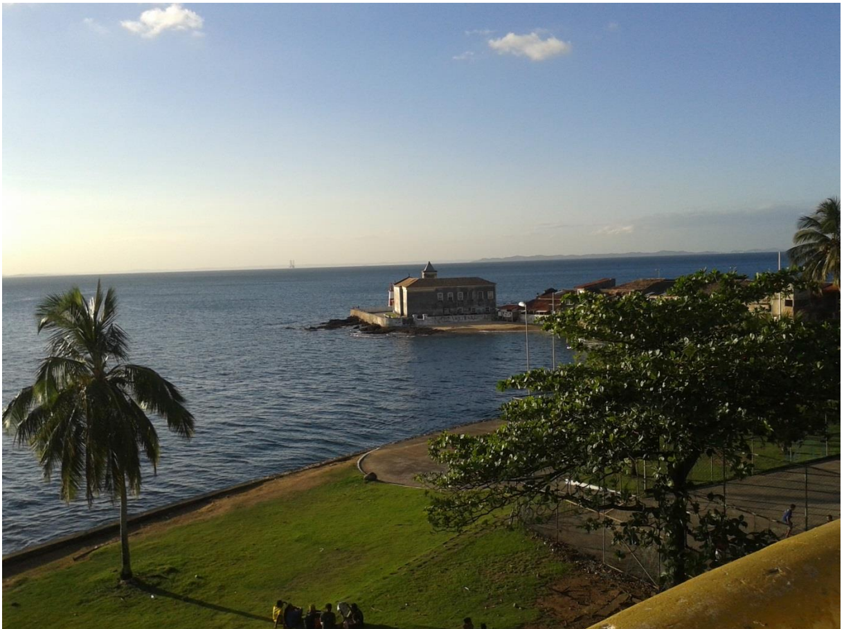
Figura 8. Ponta de Humaitá.

O espaço possui um conjunto arquitetônico formado pela Igreja de Monte Serrat, um mosteiro, o Forte De Monte Serrat, casas construídas no século XIX, além de um farol, construído no começo do século XX para orientar as embarcações que passavam pela região. Ver na Figura 8. Dorea (2006) diz que, a única referência histórica que justifica a origem do nome de batismo dessa ponta é a Batalha do Humaitá - ocorrida na Guerra do Paraguai, em 19 de fevereiro de 1898. Fica situada numa das saliências da península.