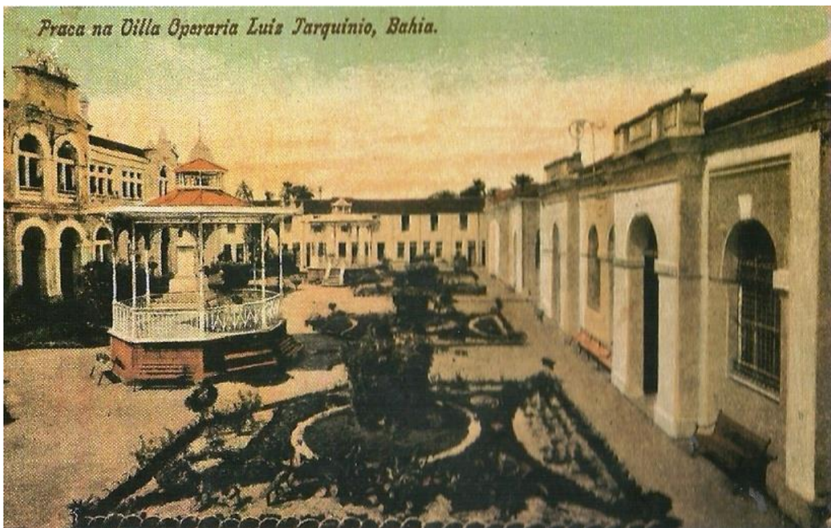
Figura 2. Praça da Vila Operária Luiz Tarquínio