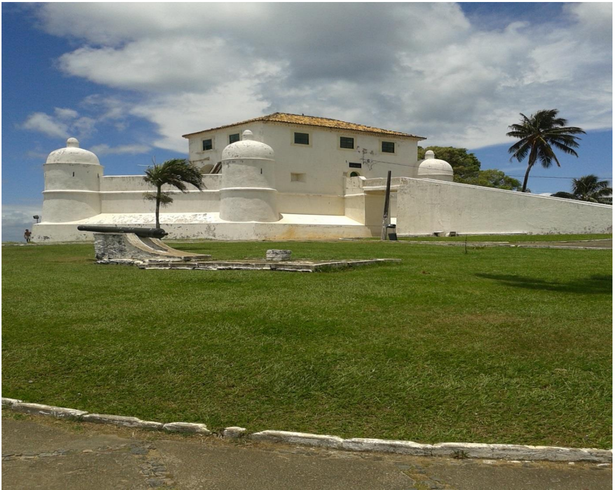
Figura10. Imagem do Forte de Monte Serrat.