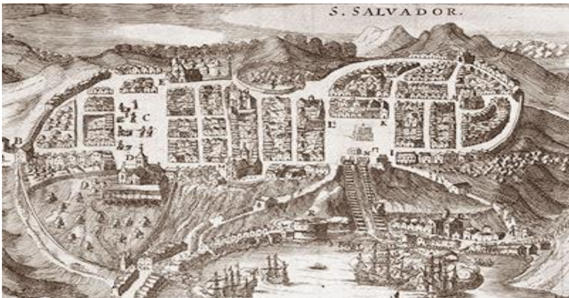
Figura 1: Ilustração da cidade de Salvador em 1549.