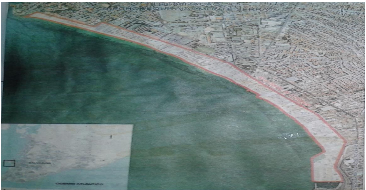
Figura 4. Área de desapropriação da Avenida Jequitaia até Mont Serrat.