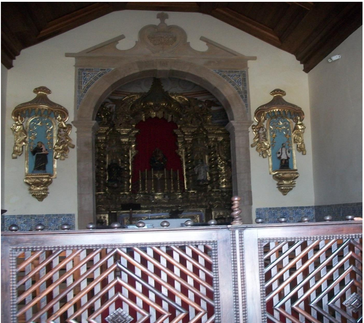
Figura 9. Parte interna da Igreja de Monte Serrat.