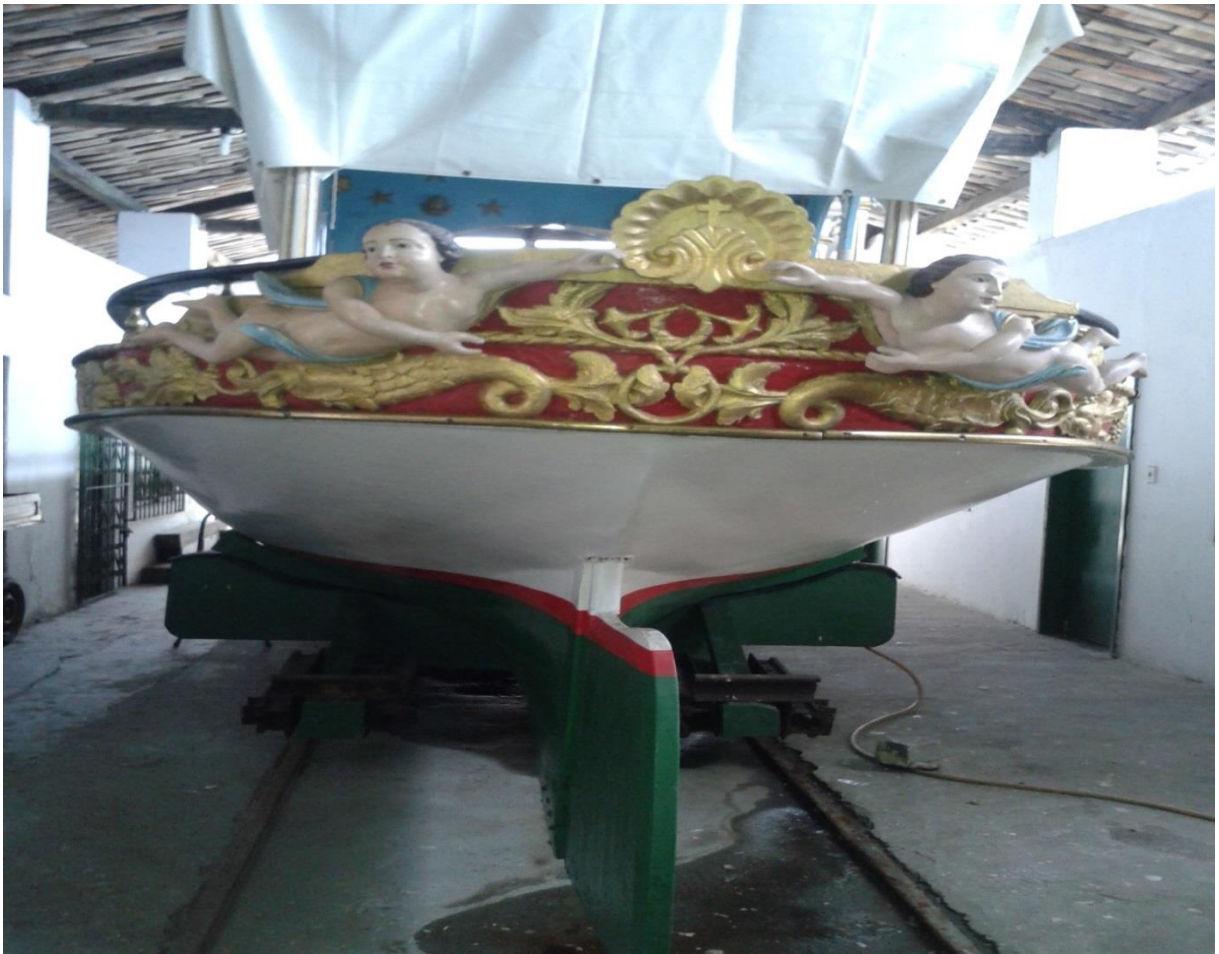
Figura 7. Foto da galeota no barracão.