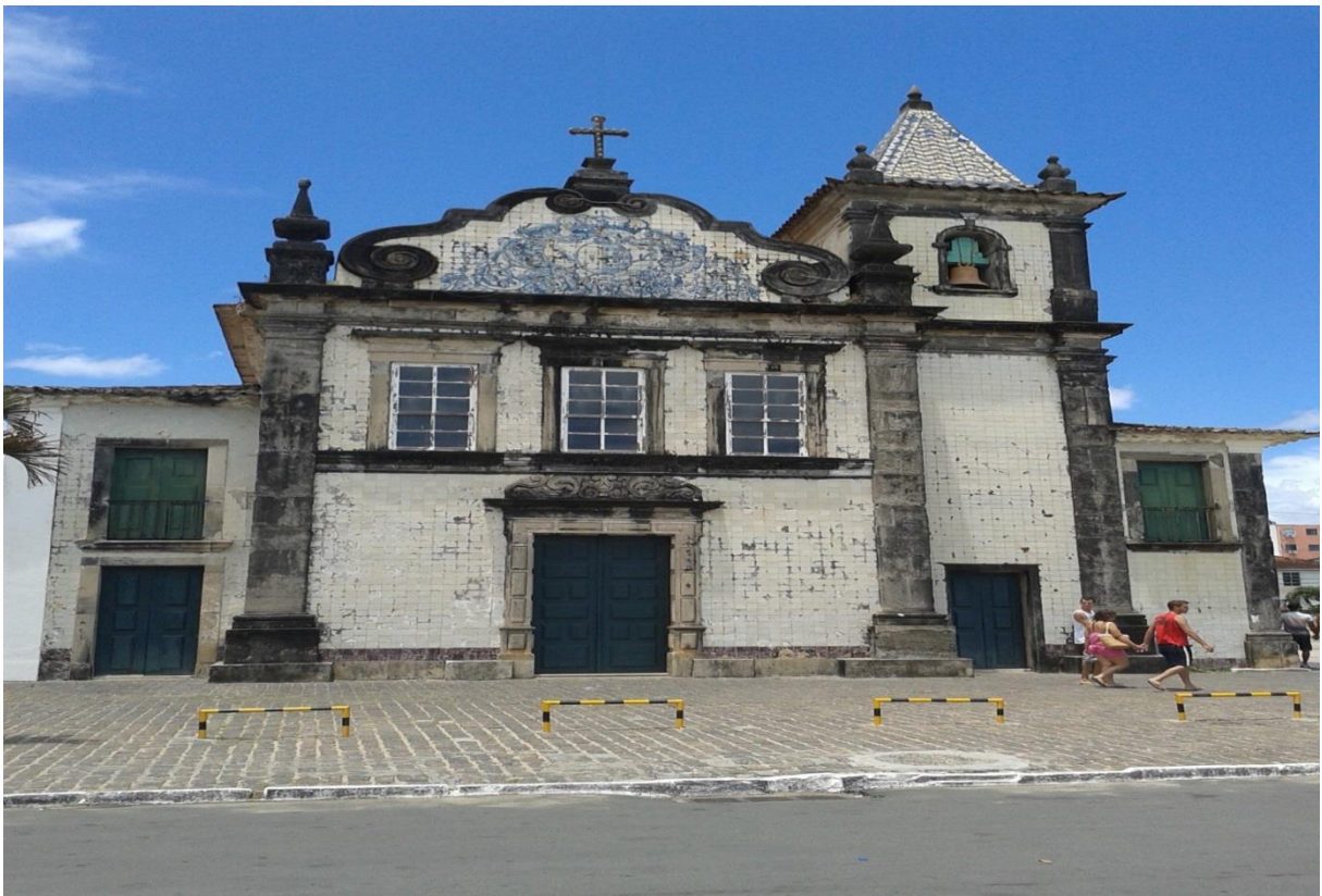
Figura 6. Igreja de Nossa senhora da Boa Viagem.

Neste sentido nota-se, a importância histórica da igreja para a cidade de Salvador. A região onde a Igreja localiza-se – na época em que se erguia, era totalmente marítima, portanto, pode-se observar a descrição do altar feito com conchas marinha sendo assim, uma arquitetura única. Além do seu estilo barroco e os azulejos portugueses características do período colonial como pode-se observar na figura 6. A Igreja passou por diversos processos de restaurações nos anos de: 1942 foram feitas obras de estabilização e conservação realizadas pelo IPHAN; em 1943, a caiação interna e externa tiveram obras de conservação; 1944, a capela interna da igreja teve obra de conservação; 1955/56, os telhados foram restaurados; 1957 houve obras de limpeza e pintura e por fim, 1959 teve a conclusão da restauração geral dos telhados e da pirâmide da torre realizada pelo IPHAN (IPAC-BA, 1975).