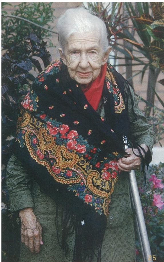
Imagem de Cora Coralina, 1984