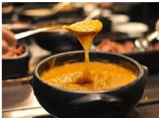
Figura 4- Pirão de galinha