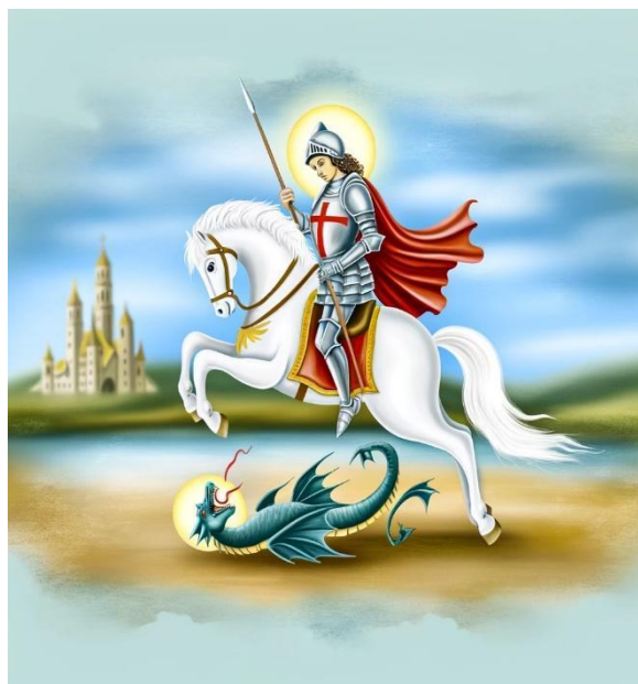
Figura 8- São Jorge

A entrevistada também relatou um evento envolvendo seu neto, que tinha problemas com bebida. Ao acender velas para São Jorge e para seu neto, observou que a vela do neto se apagava constantemente enquanto a de São Jorge brilhava intensamente. Após fazer uma oração para São Jorge, a situação do neto melhorou consideravelmente, reforçando sua crença no poder da fé e da intercessão divina.