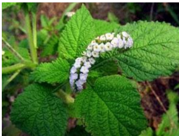
Figura 2- Imagem da erva Crista de Galo ( Heliotropium indicum )

Dona Ana explicou: "É uma erva, tinha outras, ou meu Deus eu esqueci os nomes dos remédios, que nós botava para as dor aumentar" (D. ANA, 2023).