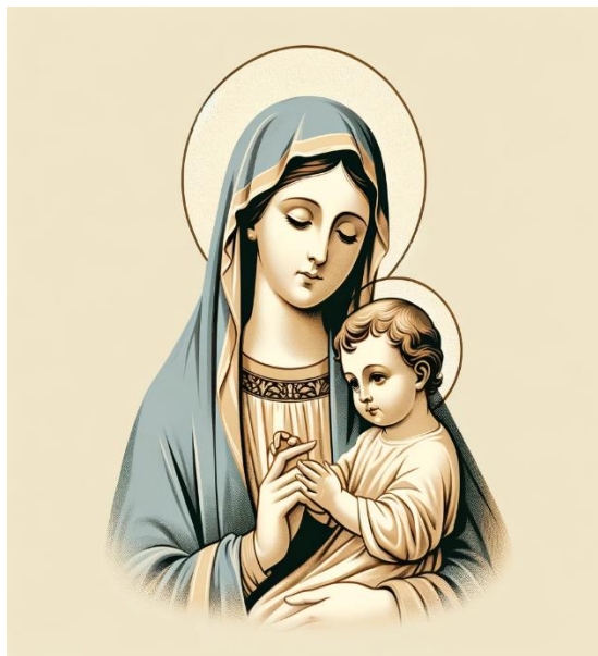
Figura 7- Nossa Senhora do Bom Parto

Além disso, muitas parteiras expressam sua devoção a figuras religiosas específicas, como o Divino Espírito Santo e Nossa Senhora do Bom Parto. Elas acreditam que essas figuras oferecem um tipo de apoio espiritual que complementa seus saberes durante o processo de trabalho de parto. A combinação de devoção religiosa e técnicas tradicionais cria uma experiência de parto mais holística para a mãe.