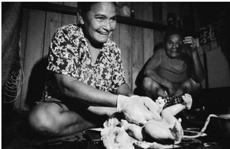
Figura 5- Parteira prestando os primeiros cuidados ao recém-nascido

Na figura 5, a parteira presta os primeiros cuidados ao recém-nascido. (OUTRAS PALAVRAS, s.d.).