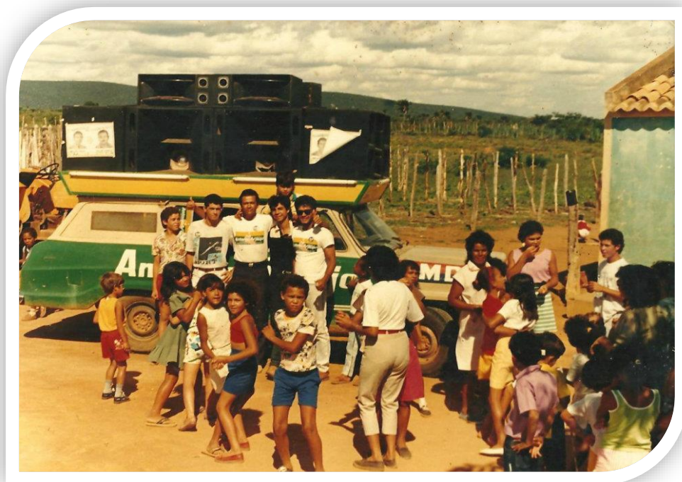
Campanha política na Zona rural da chapa do PMDB.

procurando estabelecer a legalidade do processo eleitoral. Entretanto, esses comportamentos geravam inúmeros conflitos e alguns casos findavam se transformando em agressão física. Há os que relataram que, pelo fato de a localidade ser pacata, esse períodos de campanhas eleitorais se transformavam em grandes diversões, ao término das quais ficava até certa “saude” pairando no ar.