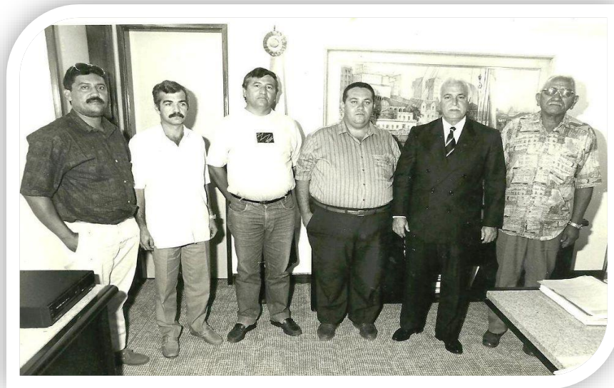
Comitiva de Gatão e Pedro Teodoro em visita ao candidato a governador da Bahia, Antônio Carlos Magalhães.