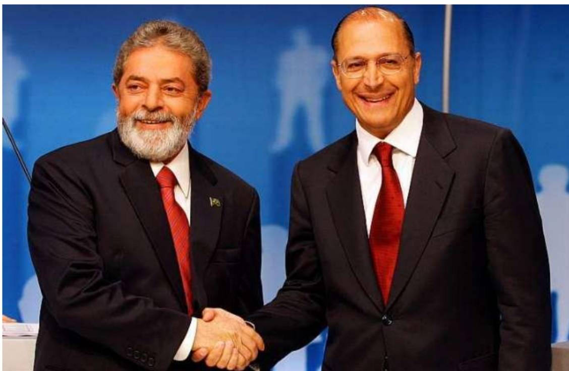
Figura 6: Foto do debate em 08 de outubro de 2006 16

Usando (como lhe ocorre muitas vezes) a ironia, o enunciador restabelece a voz de Lula e diz “‘burguês’ limpinho e sem barba”, mostrando que é o “outro” na sua voz. O “outro” (que é Lula) falaria isso de Alckmin, pensaria mal do homem que tem asseio com o corpo (já que o comunista é barbudo, sujo e tipicamente grotesco). Na voz retomada pelo sujeito, o “comunista” encenado mostra-se mal humorado ao ter que discutir com o “burguês”. Lula é relacionado ao mau humor, à sujeira (subentendido). Alckmin está ligado à boa aparência, ao asseio. As aparências podem ser vistas na foto, por ela é possível ter a visão que tinha o comentarista para formular os estereótipos dos candidatos.