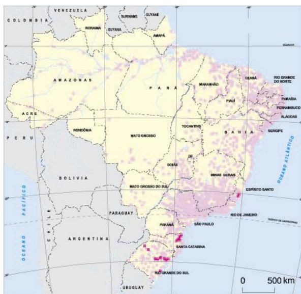
MAPA Nº 03 1940