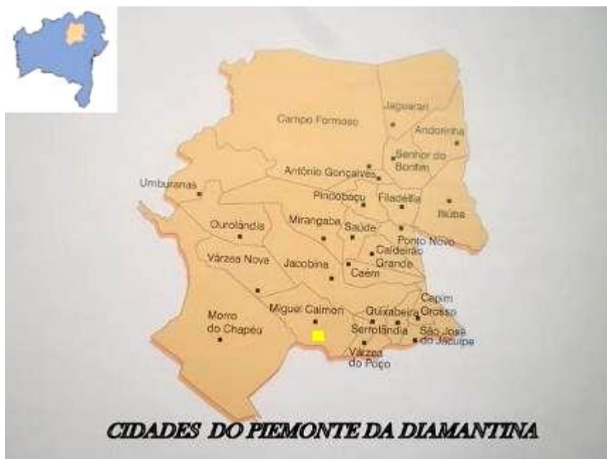
MAPA Nº 01 PIEMONTE DA CHAPADA DIAMANTINA

Não iniciamos o estudo pela vida dedicada à congregação batista, mas sim pelas experiências enquanto “sujeito do mun-