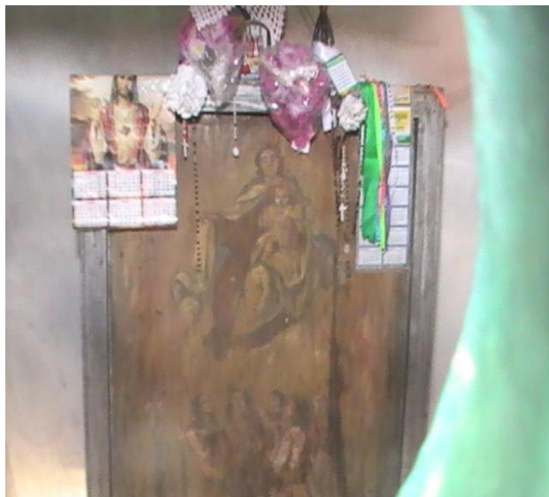
Figura 2 – Quadro situado no interior da primeira capela da Serra

A partir destes fatos houve um progressivo aumento de romeiros que subiam o Piquaraça em busca da cura, de um milagre. Devido ao aumento do numero de fiéis em Monte Santo, ele fora convocado para a continuidade da sua obra na cidade. Podemos destacar que a Igreja viu uma oportunidade de aumentar o seu rebanho no sertão, já que era inegável que o vigário exercia uma grande influência religiosa sobre o povo sertanejo. Este fato pode ser constatado, pois ele destaca que, juntamente com o povo, que prontamente ajudou na realização da obra de Deus, colocou painéis, provavelmente Apolônio se refere neste trecho a quadros, durante os passos, Capela de Nosso Senhor dos Passos e Nossa Senhora das Dores, capelinhas para proteção das cruzes e a Igreja ao topo da serra, ambas em um período próximo de um ano. Demonstrando assim o poder que este exercia sobre os fiéis. (figura 2)