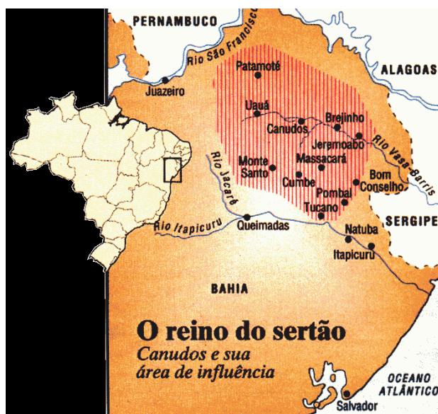
Figura 1 – Localização de Monte Santo-Ba.