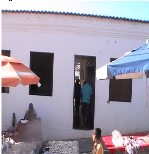
Figura 7 – Casa dos romeiros.

Atualmente existem apenas a Irmandade do Santíssimo Sacramento da Santa Cruz e Sagrado Coração de Jesus, contudo segundo relato do entrevistado existiam mais três irmandades e seus respectivos nomes tinham relação com as três principais capelas da Santa Cruz: a primeira, Capela do Senhor dos Passos; Irmandade dos Passos; Capela de Nossa Senhora das Dores, Irmandade das Dores e as capelinhas que representam as almas, respectivamente a Irmandade das Almas. (AMADOR, 2013, informação verbal) 5 .