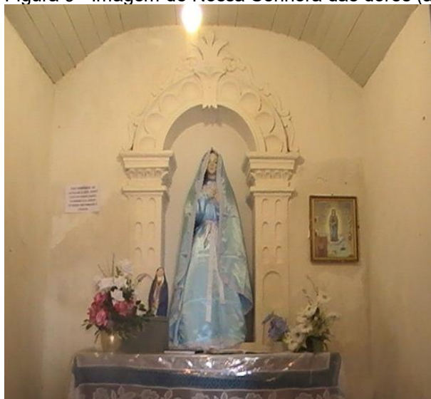
Figura 9 - Imagem de Nossa Senhora das dores (ao centro).