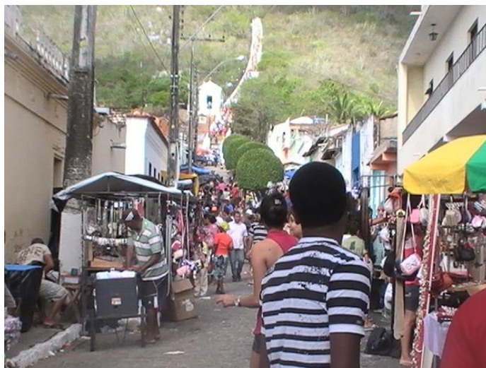
Figura 14 – Comércio informal – Celebração de Todos os Santos.

Importante analisar que devido à falta de infraestrutura e o reduzido número de restaurantes e leitos os impactos econômicos no comércio formal de Monte Santo são bastante relativos, visto que apesar de os poucos hotéis e restaurantes estarem lotados nesta data, caso existisse uma quantidade maior de equipamentos certamente seria um maior gerador de divisas para a população e também para o município.