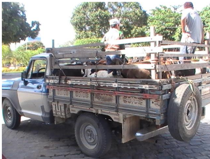
Figura 11 – Transporte dos romeiros – “pau de arara”

O deslocamento dos romeiros a cidade de Monte Santo em grande parte acontece através da utilização de ônibus escolares fretados, cedidos pelas prefeituras dos municípios e outras cidades da região, carros particulares e o famoso “pau de arara” (figura 11), caminhão adaptado e muito comum na região do sertão. Utilizado para o transporte dos romeiros, já que muitos destes não possuem condições financeiras para utilizarem outras formas de transporte.