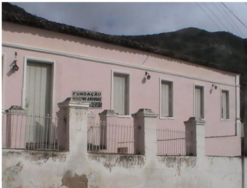
Figura 12 – Museu do Sertão.