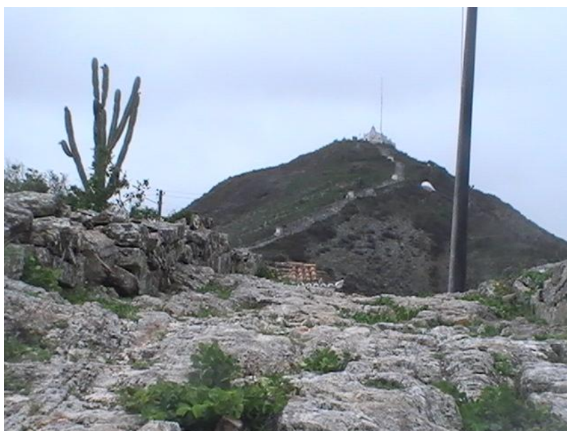
Figura 3 – Vista da Serra do Piquaraça / Santuário da Santa Cruz (Topo).

capuchinho Apolônio, como também demonstra a admiração que ele tinha para com o Frei, visto que ele define a construção como um “prodígio de engenharia rude e audaciosa”, contudo há um senso crítico nesta colocação do autor, como se a construção fosse um milagre da engenharia, pois os “tabaréus”, como ele chamava os sertanejos, não tinham o conhecimento para a edificação do calvário de Monte Santo. Por isso, há um deslumbramento dele diante desta obra, destacando assim a importância da construção da via sacra na serra do Piquaraça (figura 03), para o fortalecimento da religiosidade nos sertões da Bahia.