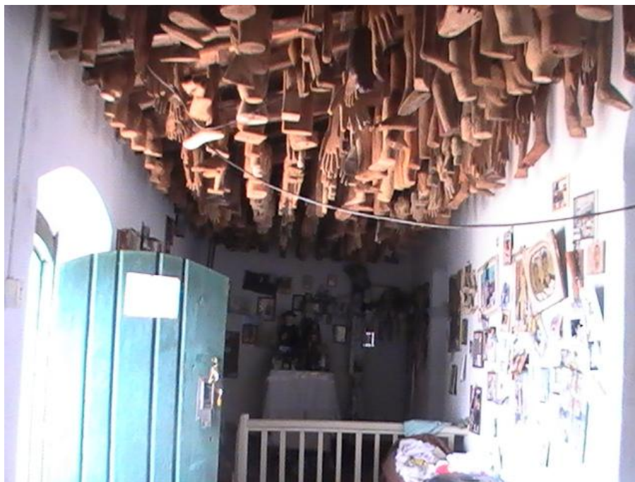
Figura 6 – Ex-votos do Santuário da Santa Cruz.

Durante a celebração de Todos os Santos, muitos fiéis carregam as suas pagas, ex-votos (figura 6), para pagamento de promessas alcançadas, importante informar que estas podem ser representações de partes do corpo humano, muito comum, feitas de madeira ou até mesmo fotos.