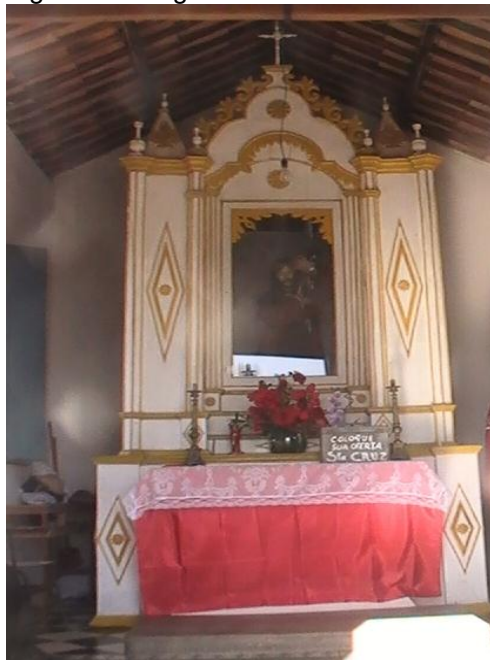
Figura 4 - Imagem de Nosso Senhor dos Passos (ao centro).

três imagens que representam, respectivamente Nossa Senhora da Soledade, São João e Senhor Morto (figura 5).