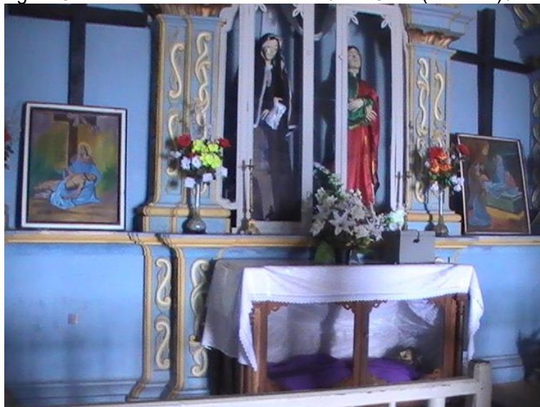
Figura 5- Nossa Senhora da Soledade /São João (à direita) /Senhor Morto (em baixo).