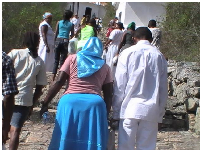
Figura 10 – Romeiros em procissão a Santa Cruz- Festa de Todos os Santos.

Sendo que o deslocamento para o município tem como motivação a busca do pagamento das graças alcançadas que foram realizadas na Serra do Piquaraça, Santuário da Santa Cruz, e realização de novas promessas. Portanto, a peregrinação, e o grande fluxo de romeiros (figura 10) que se deslocam para o “altar do sertão”, como afirmado, principalmente no período da Celebração de Todos os santos, torna-se um dos principais atrativos da cidade e propicia para o desenvolvimento turístico do município.