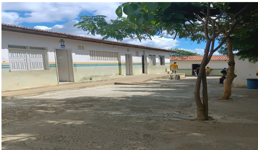
Figura 7: EMEF Antônio Lúcio de Santana (vista interior)