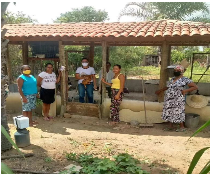
Figura 5: Projeto Bahia Produtiva.