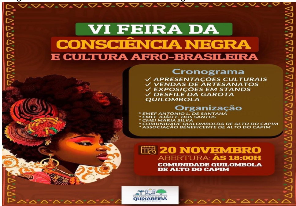
Figura 9: Cartaz Dia da Consciência Negra