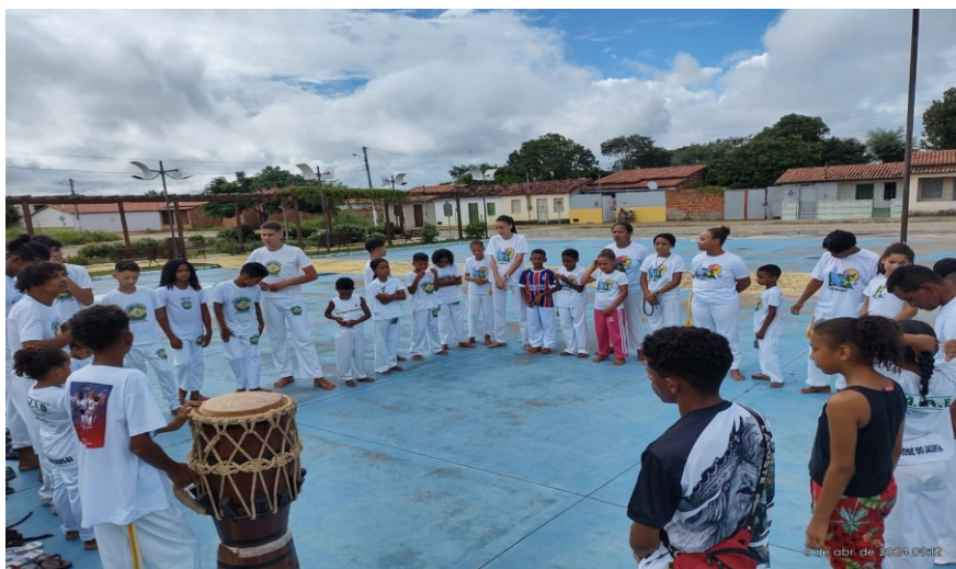
Figura 4: Grupo de Capoeira Ave Branca