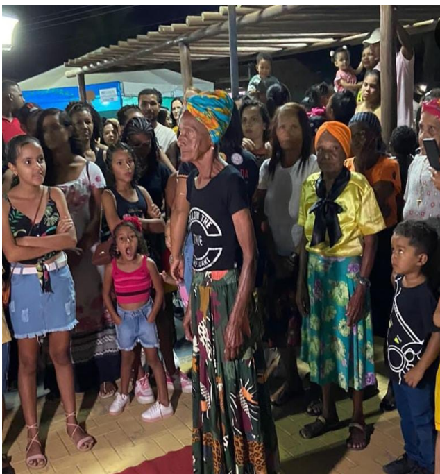
Figura 10: Desfile Dia da Consciência Negra