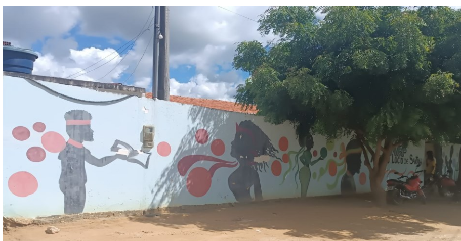
Figura 8: EMEF Antônio Lúcio de Santana (vista exterior)