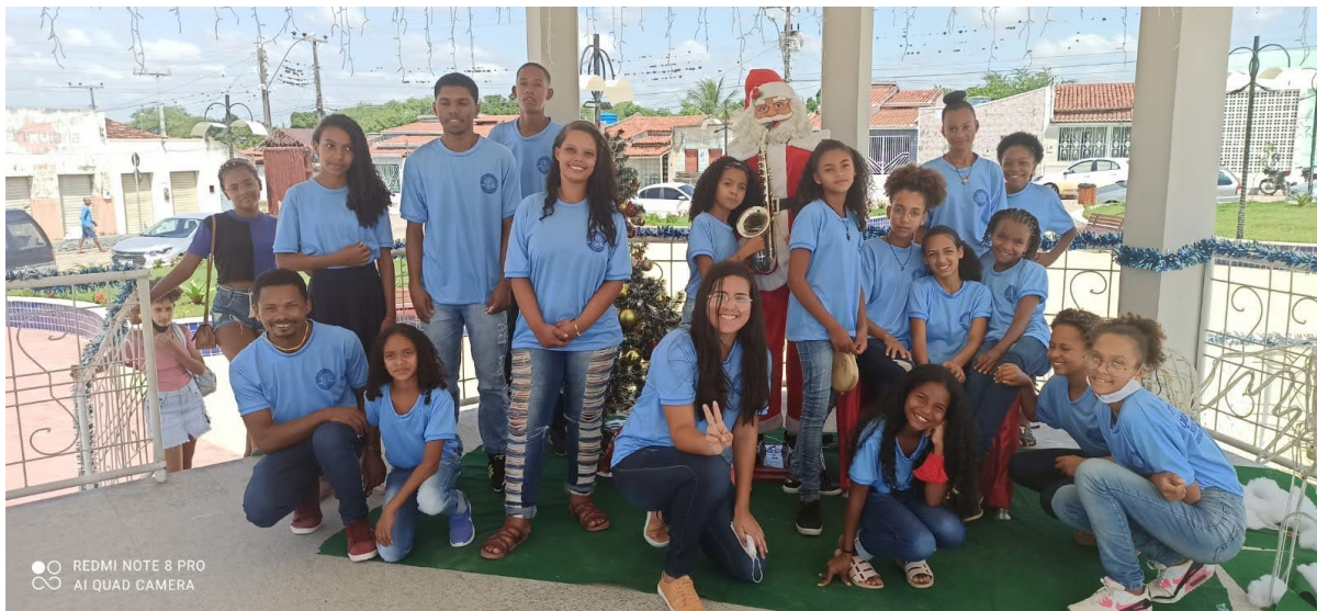
Figura 6: Orquestra Harmonia do Quilombo.