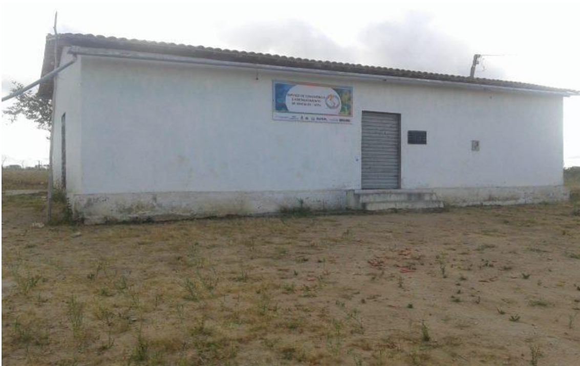
Figura 5: Centro Comunitário da ACC, situação atual.