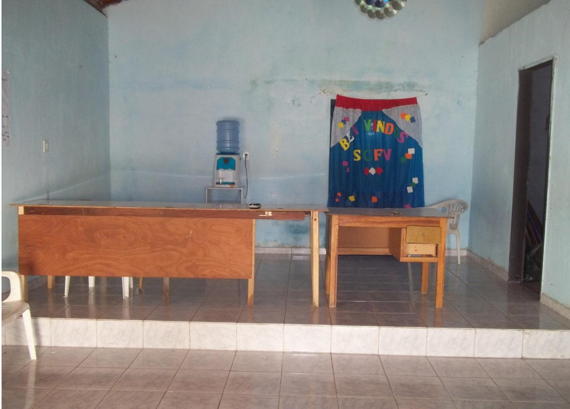
Figura 3 Fotografia da parte de dentro do Centro.