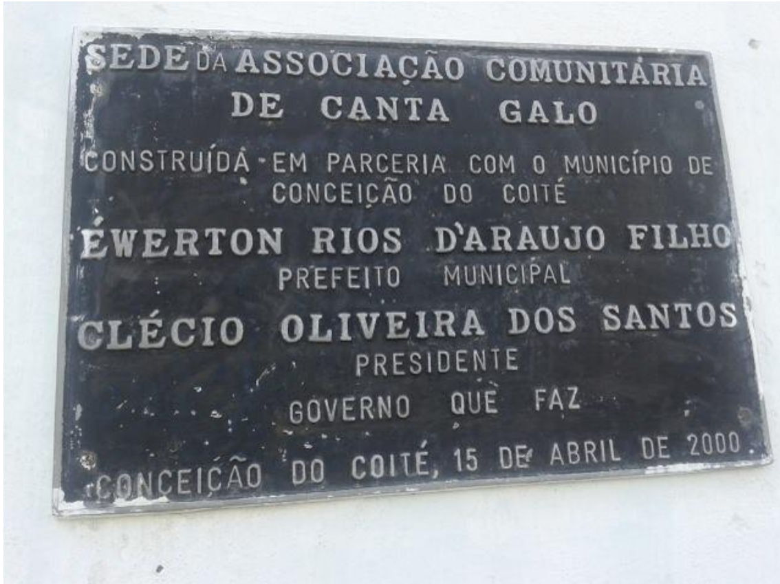
Figura 4 Marca física do poder local.