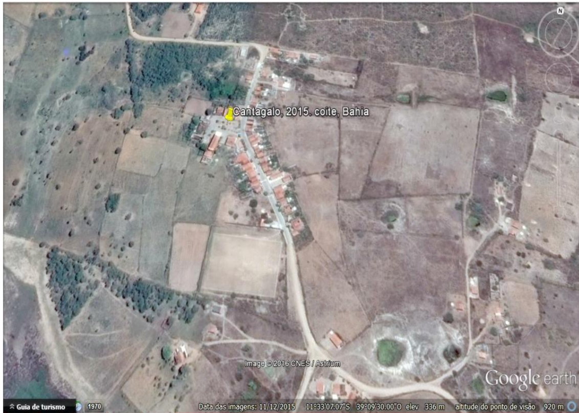
Figura 1 Fotografia panorâmica do Povoado de Canta Galo/2