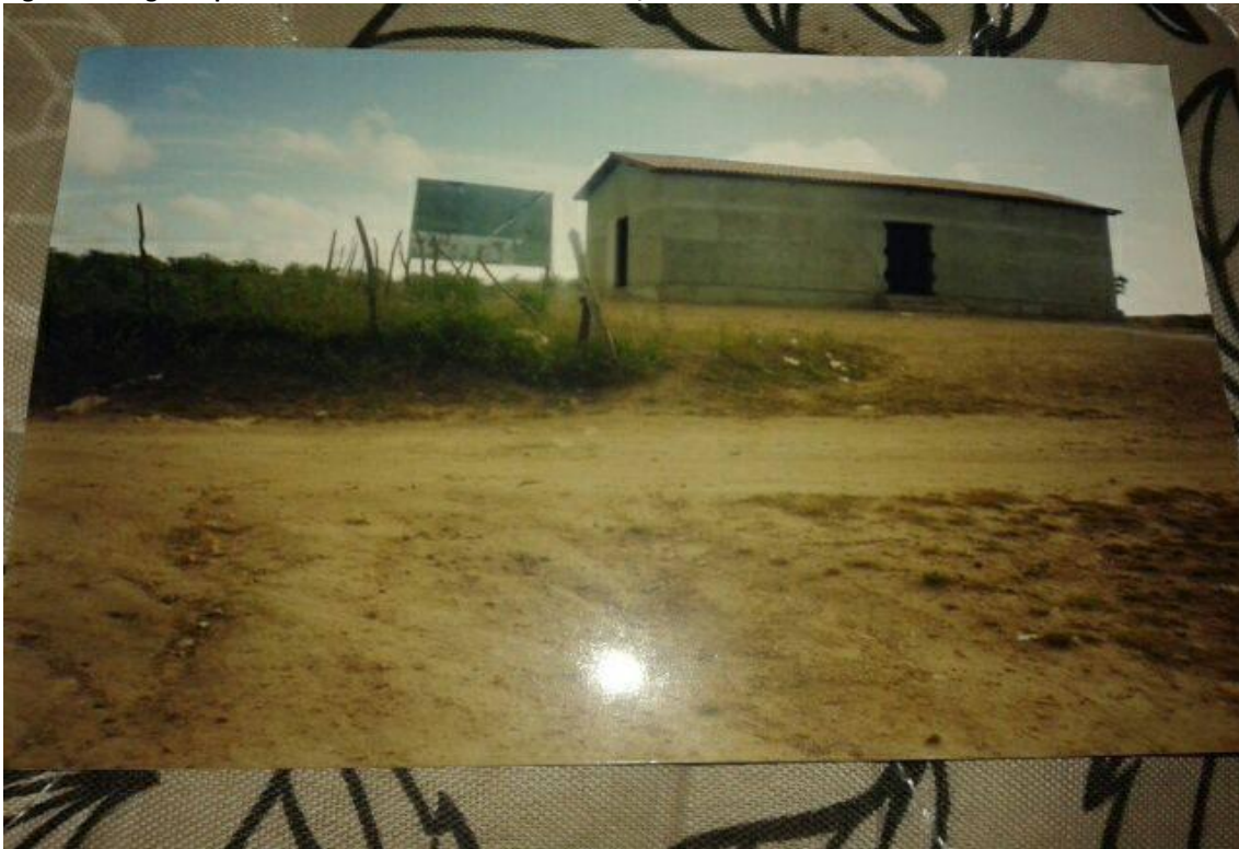
Figura 2 Fotografia da construção do Centro Comunitário