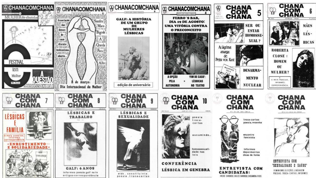
Imagem 1: Capa dos números de 1 ao 12 do boletim ChanacomChana .