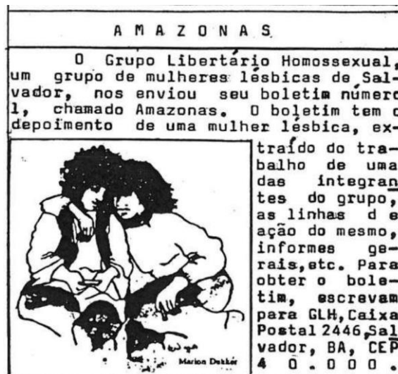
Imagem 6: Informe do lançamento do boletim Amazonas