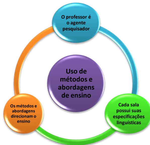
Gráfico 5- Fatores relevantes para o uso de metodologias e abordagens específicas no ensino de Língua Inglesa.