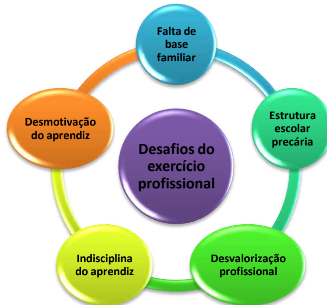
Gráfico 2 – Desafios advindos do exercício da docência.