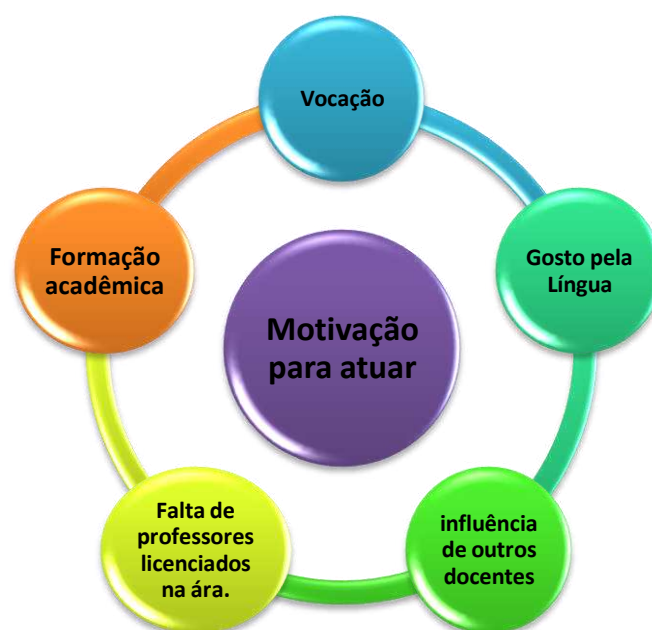
Gráfico 1- Motivações para atuar no ensino de Língua Inglesa.

Independente qual motivação leva um profissional a fazer escolha pela docência o mesmo tem a percepção diária que está contribuindo para a promoção de seres sociais onde o conhecimento direcionado através do professor se faz extremamente necessário.