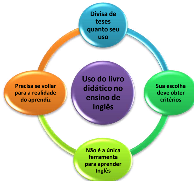
Gráfico 5.1- Questões relacionadas ao livro didático.

Cabe ao Governo Federal propiciar uma variedade de exemplares de livros didáticos para que cada professor juntamente com a direção e a coordenação pedagógica façam a escolha de um material que atenda as reais necessidades de seus aprendizes.