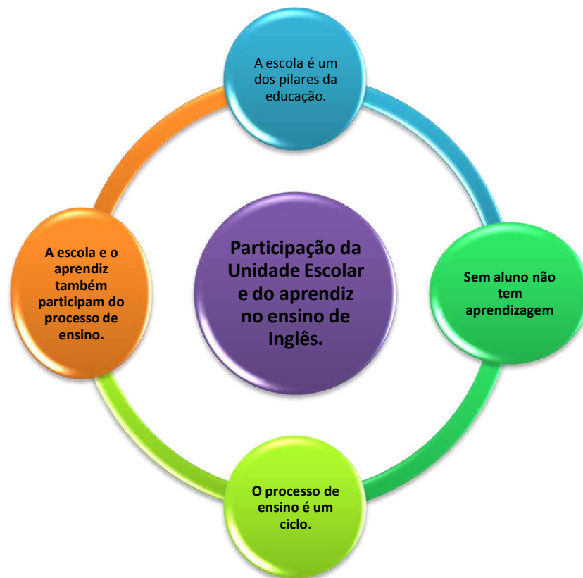
Gráfico 7- Participação da Unidade Escolar e do aprendiz no processo de ensino e aprendizagem de Língua Inglesa.

Desta maneira conclui-se que todos os personagens fazem parte do ensino não apenas de Inglês, mas de todas as outras disciplinas e para que o ensino seja dinâmico e de qualidade todos os personagens envolvidos precisam cumprir seu papel.