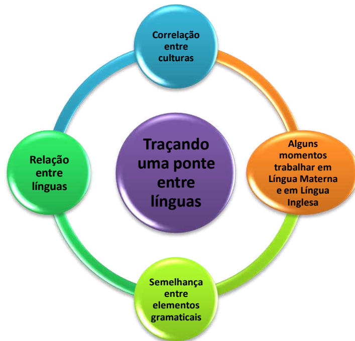
Gráfico 3 - Fatores que tornam necessária uma ponte entre a Língua Inglesa e a Língua Materna.