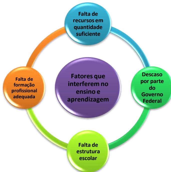
Gráfico 4- Fatores pertinentes ao ensino e aprendizagem de Língua Inglesa

Fatores como a desvalorização do docente através do Governo Federal se tornam presentes, pois o mesmo tem a responsabilidade de manter o profissional capacitado para exercer sua função e auxiliar também quanto aos instrumentos de trabalho.