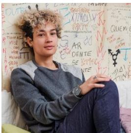
Figura 11: Foto publicada na revista Alterfocus.