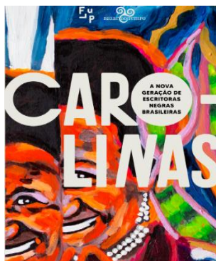
Figura 6: Capa do livro Carolinas: a nova geração de escritoras negras brasileiras (2021)