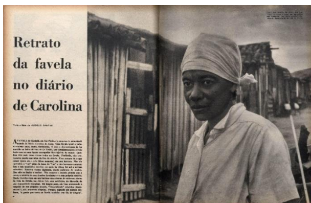
Figura 1 Revista O cruzeiro , edição n. 36, p. 93

É comum, ao lermos textos que se propõe a falar da escritora Carolina Maria de Jesus, a presença predominante dos epítetos negra, favelada, mãe solteira, semianalfabeta. Essas expressões podem ser entendidas como categorias que envolvem raça, classe e gênero e, neste sentido, pressupõem as relações de poder que as interligam, permitindo assim fazer uso da interseccionalidade como ferramenta analítica. Por outro lado, o uso dessas expressões para definir Carolina enfatiza aspectos sociais e destaca marcos territoriais que atuam como fronteiras geográficas e literárias.