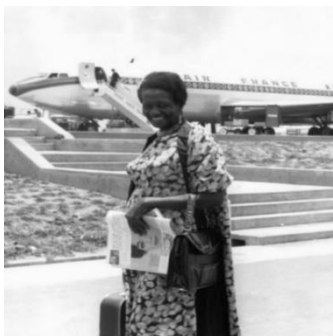
Campinas, SP, 13/12/1961.