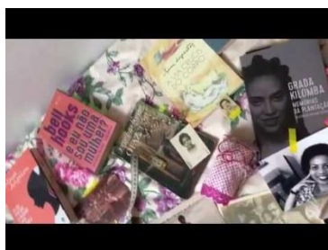
Figura 15: Carta para Carolina – Karlana Bianca. Disponível em: https://www.youtube.com/watch?v=SOy3dgqaUz4