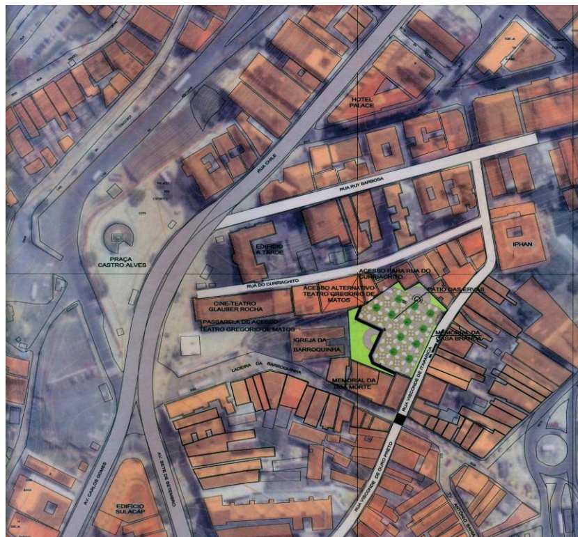
Figura 1 Localização da Igreja da Barroquinha.