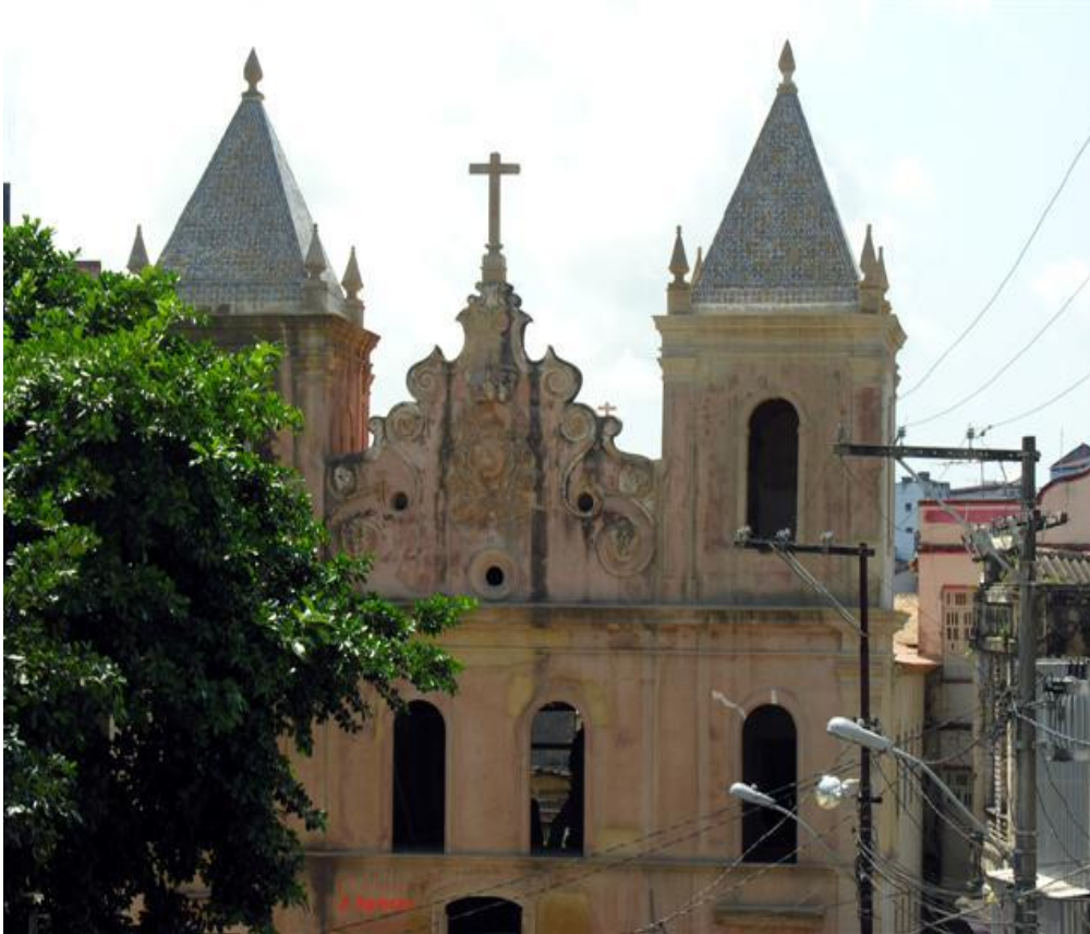
FOTO 1. FACHADA DA IGREJA ANTES DA RECUPERAÇÃO