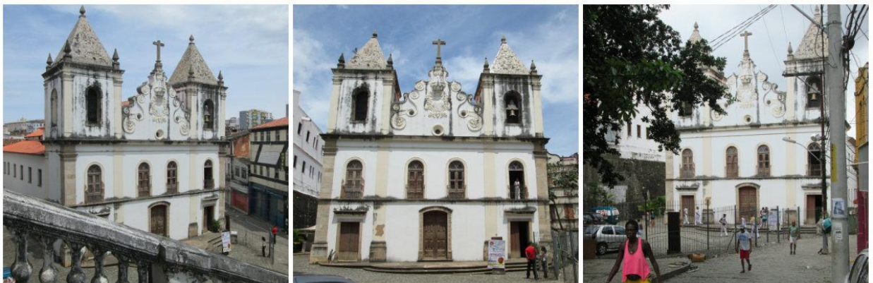
Foto 3: Espaço Cultural da Barroquinha. 1- Vista da escada de ligação ao Teatro Gregório de Mattos; 2- Vista do pátio de estacionamento para a parede frontal da Igreja; 3- Vista da rua do couro para a edificação do equipamento.