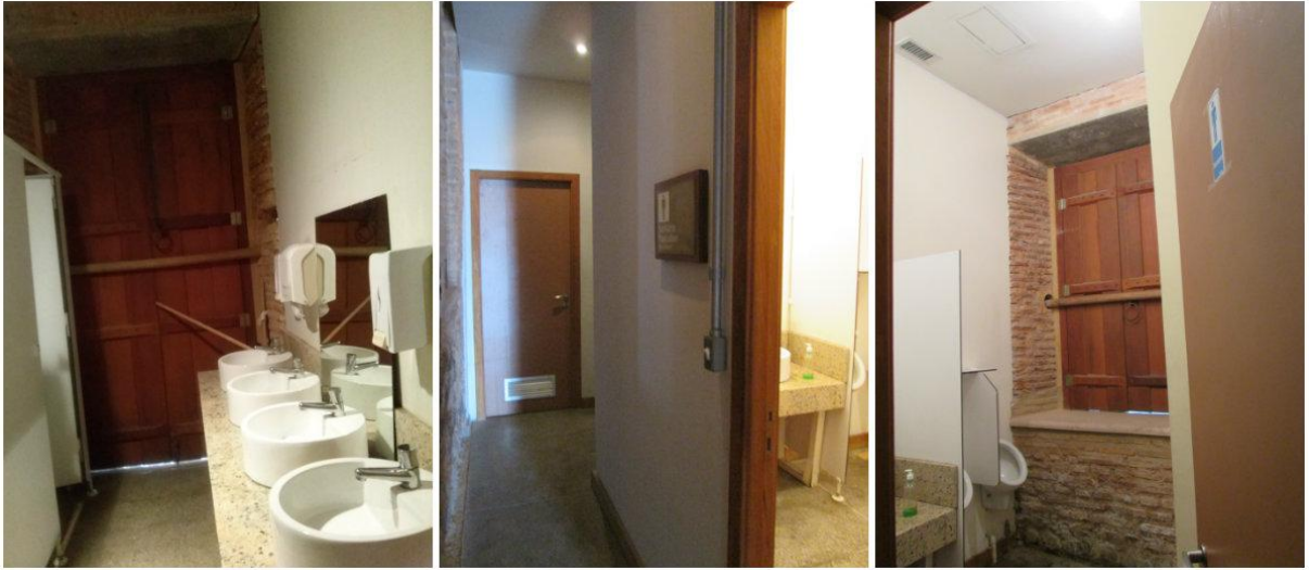
Foto 5: Sanitários. Instalações, conservando as paredes originais da Igreja.