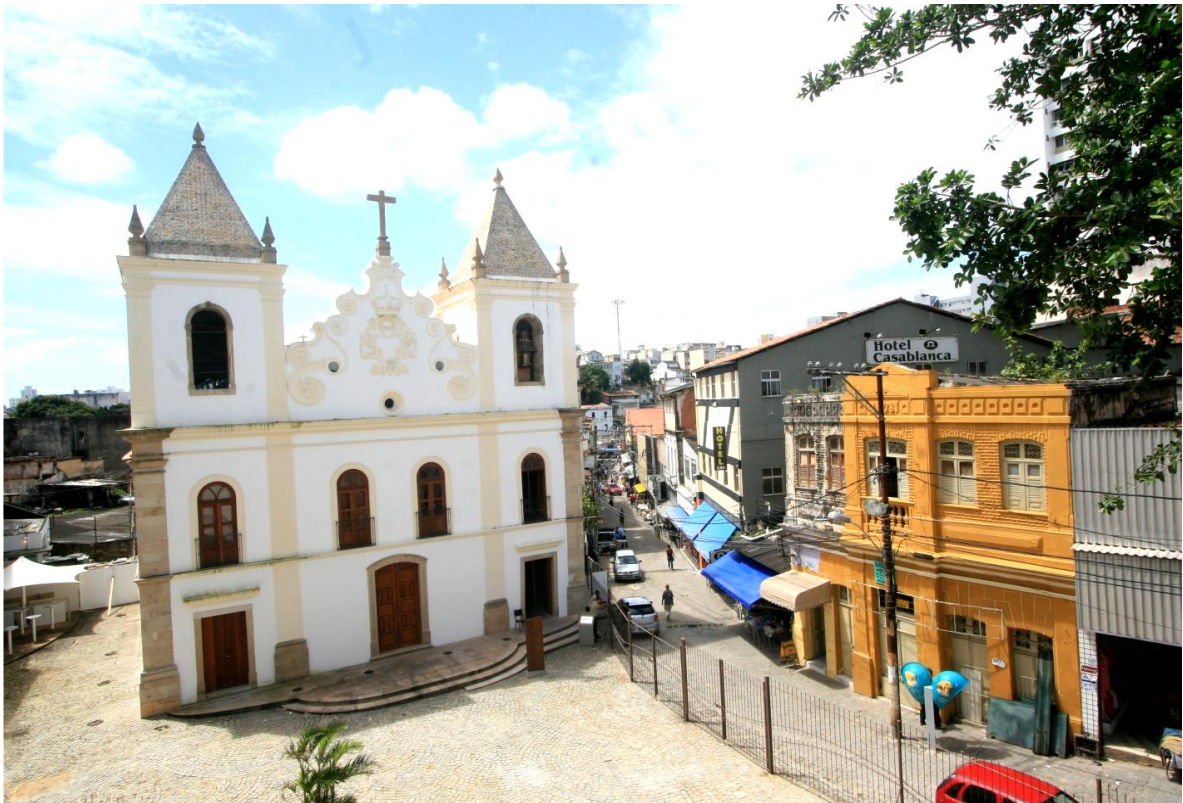
Figura 2. Espaço Cultural da Barroquinha.