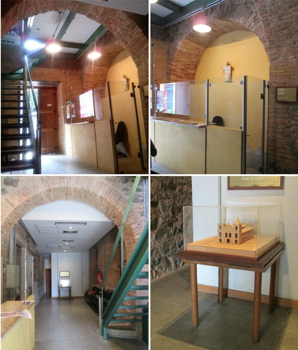
Foto 4: Recepção. 1- Entrada e escada de acesso à área administrativa; 2- Bilheteria; 3- Recepção; 4- Maquete do projeto Espaço Cultural da Barroquinha, em exposição.