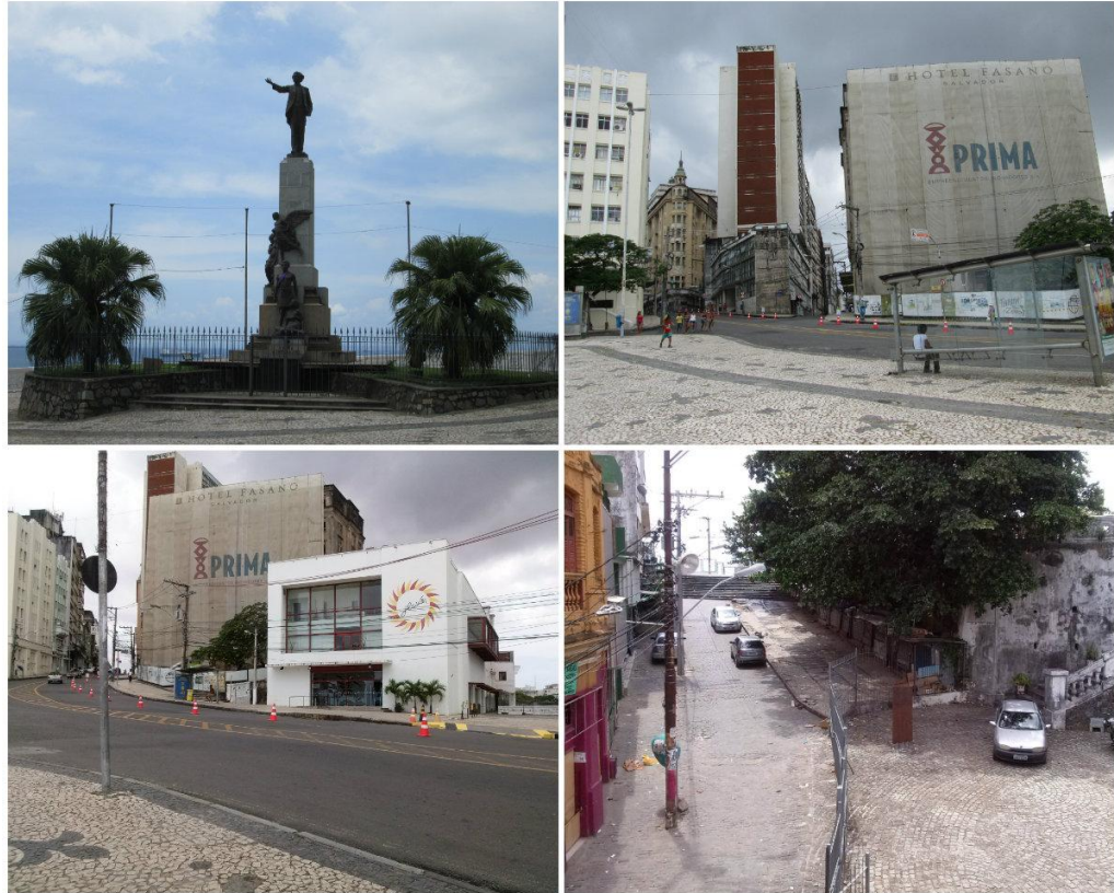
Figura 4. Área do entorno. 1- Praça Castro Alves; 2- Vista da Praça Castro Alves, para o antigo Hotel Palace – segunda edificação à esquerda –, e o futuro Hotel Fasano em obras à direita; 3- Cinema Glauber Rocha; 4- A rua do couro, fora de sua rotina comercial.