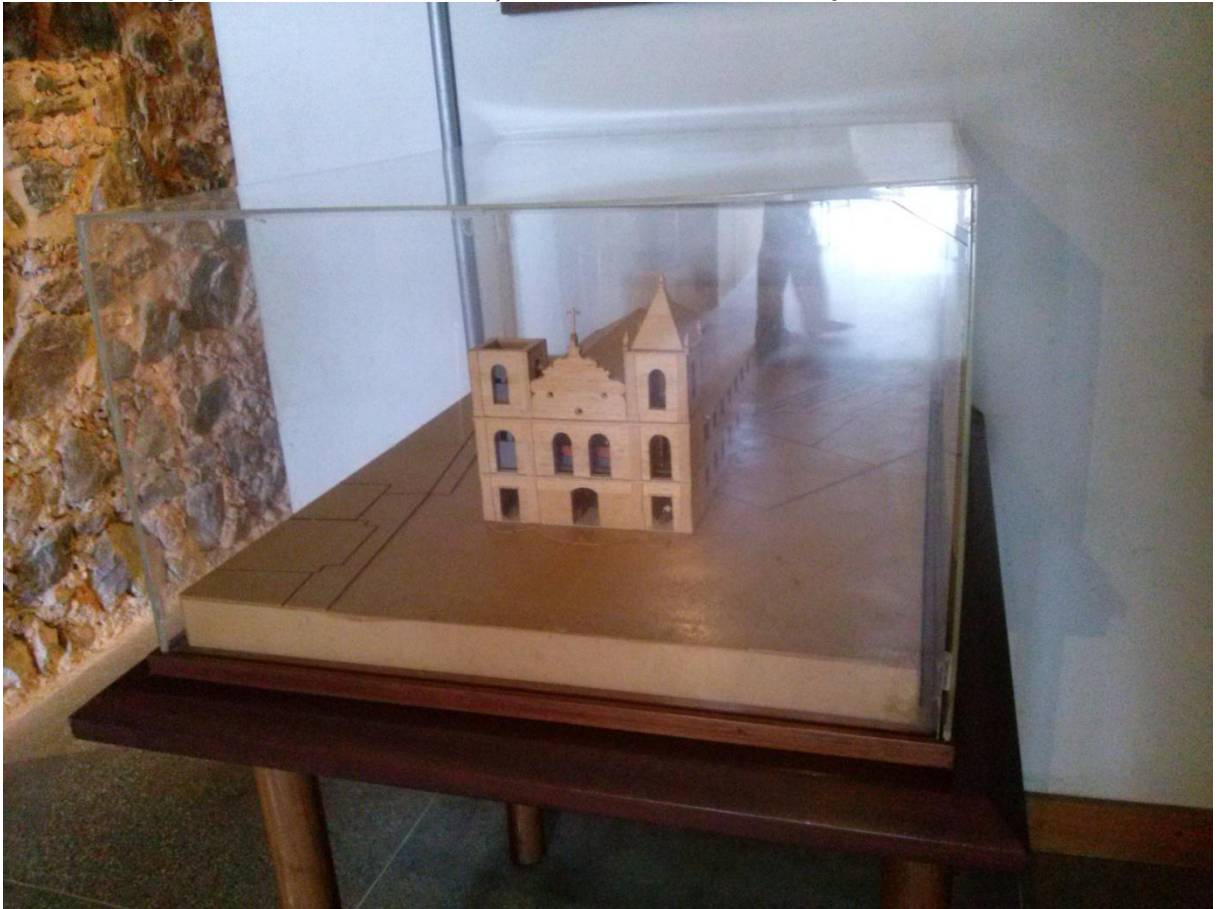
FOTO 2. MAQUETE DO PROJETO- ESPAÇO CULTURAL DA BARROQUINHA