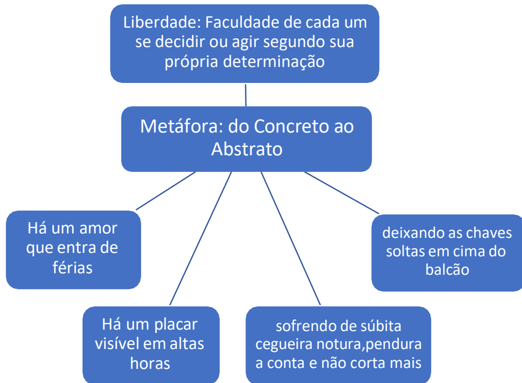
Quadro 1 – Liberdade, metáfora.