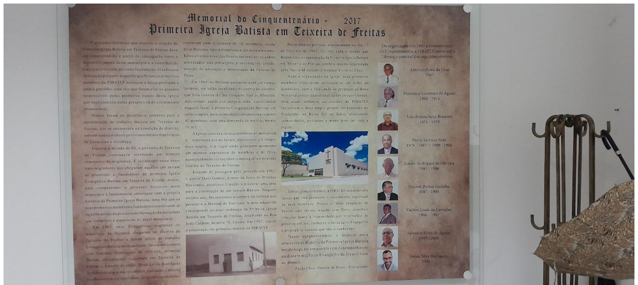
Figura 4. Mural comemorativo 50 anos da PIBATEF