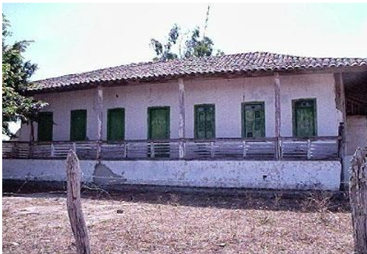
Autor desconhecido. Arquivo digital, Baixa Grande. 349