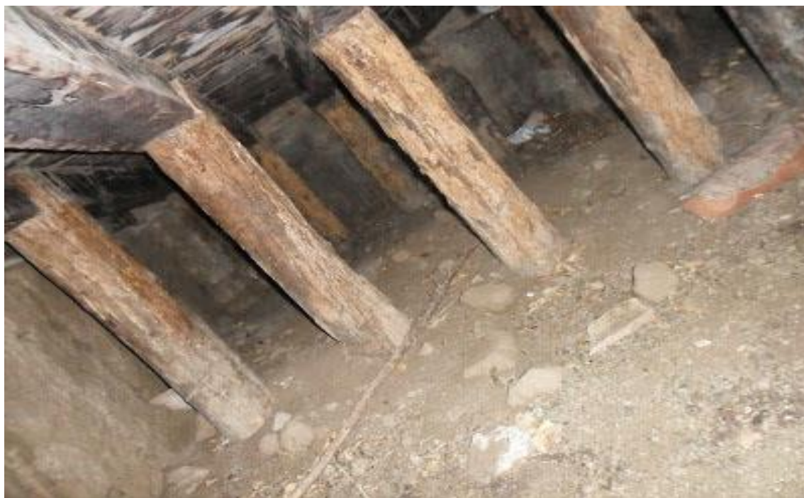
Figura 5 - Fotografia de um porão localizado na sede da fazenda Cães

Autor desconhecido. Arquivo digital, Baixa Grande. 352