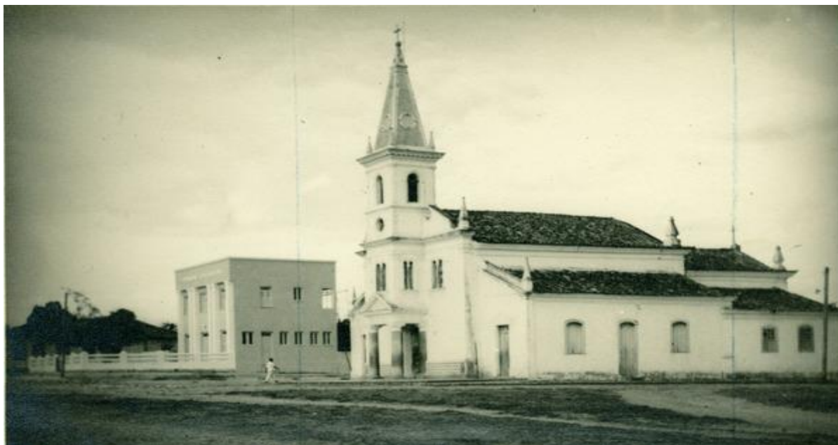
Figura 1 - Igreja Matriz de Nossa Senhora da Graça.

Fonte: Representação em fotografia da na igreja matriz de Nossa Senhora da Graça. Autor desconhecido. Arquivo digital, Morro do Chapéu. 87