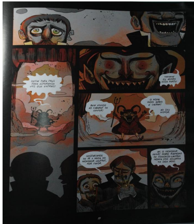
Figura 1. Uma noite em L'enfer , 2016, p. 19

Para exemplificar essa relação entre as imagens dentro da linguagem dos quadrinhos, utilizaremos a cena de Van Gogh acompanhado de Paul Gauguin adentrando o cabaré L'enfer logo após se deparar com a macabra fachada de entrada: