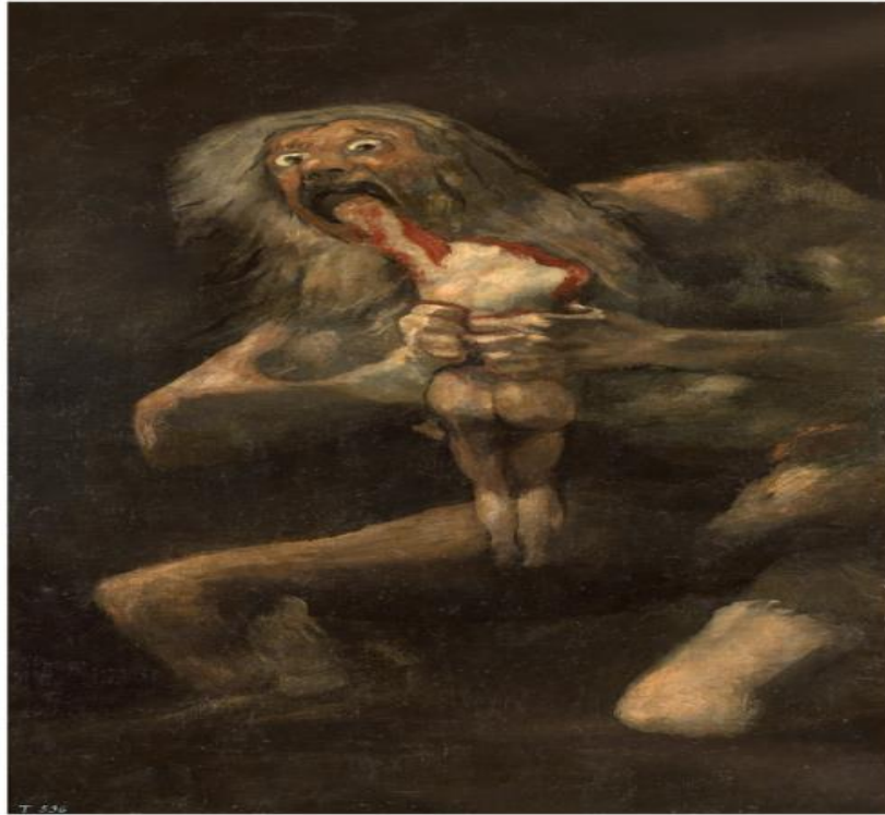
Figura 4. GOYA, Francisco de. Saturno devorando o próprio filho . 1820-23. Técnica mista sobre tela, 143,5 x 81,4 cm. Museu do Prado, Madri.

A partir disso, a página dupla que retrata a devoração cometida pelo personagem Goya (figura 5), produz uma referência intermediária à cena representada pelo artista romântico. Esse processo, como postulado por Rajewsky (2012), produz um “como Se”, já que uma mídia não pode apresentar a mesma estrutura que a mídia referenciada.