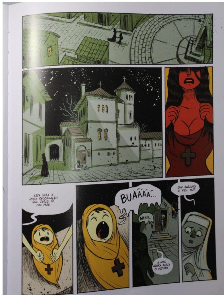
Figura 1. Uma noite em L'enfer , 2016, p. 91.

Essa cena inicia um contato com as fronteiras da narrativa oral e o romance de Álvares de Azevedo, pois a cruz, é abandonada pelo casal. Tal momento já antevê os constantes abandonos que o evocador cometerá ao longo da narrativa, sendo o principal deles, a perda de sua humanidade ao cometer o ato antropofágico. Assim, o quadrinho já antecede os sentidos que serão desenvolvidos dentro do romance ultrarromântico ao referenciar elementos que simbolizam mensagens evocadas por uma versão da narrativa oral.