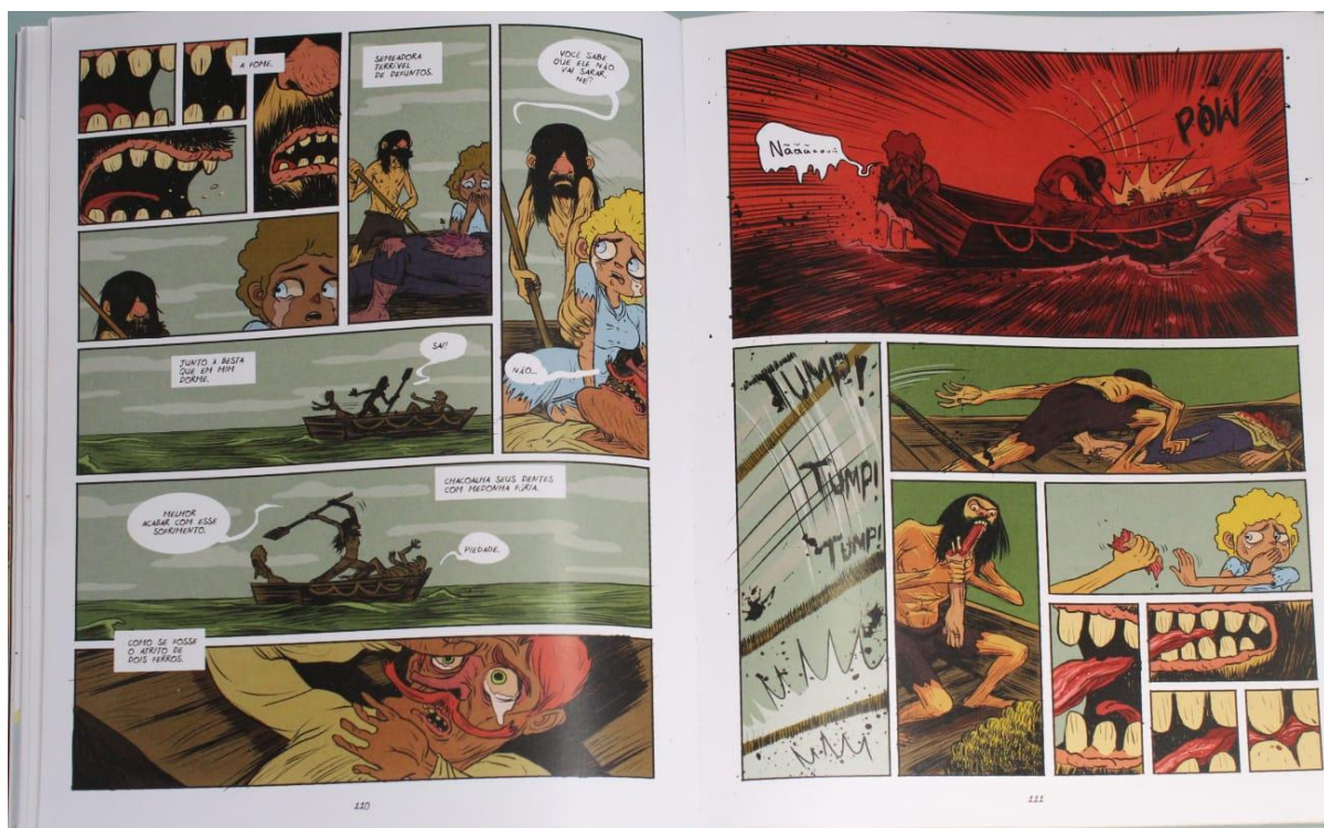
Figura 2. Uma noite em L'Inferno , 2016, p. 110-111.

Com isso, a produção de sentido se encontra em curso (ou à deriva?), além da adaptação da narrativa de Uma noite na taverna , temos uma referência ao pintor romântico e o conto oral. Essas múltiplas referências desembocam na sequência do canibalismo, momento em que todas as fronteiras morais dos personagens são abandonadas pela situação extrema em que se encontram, como vemos na página dupla a seguir: