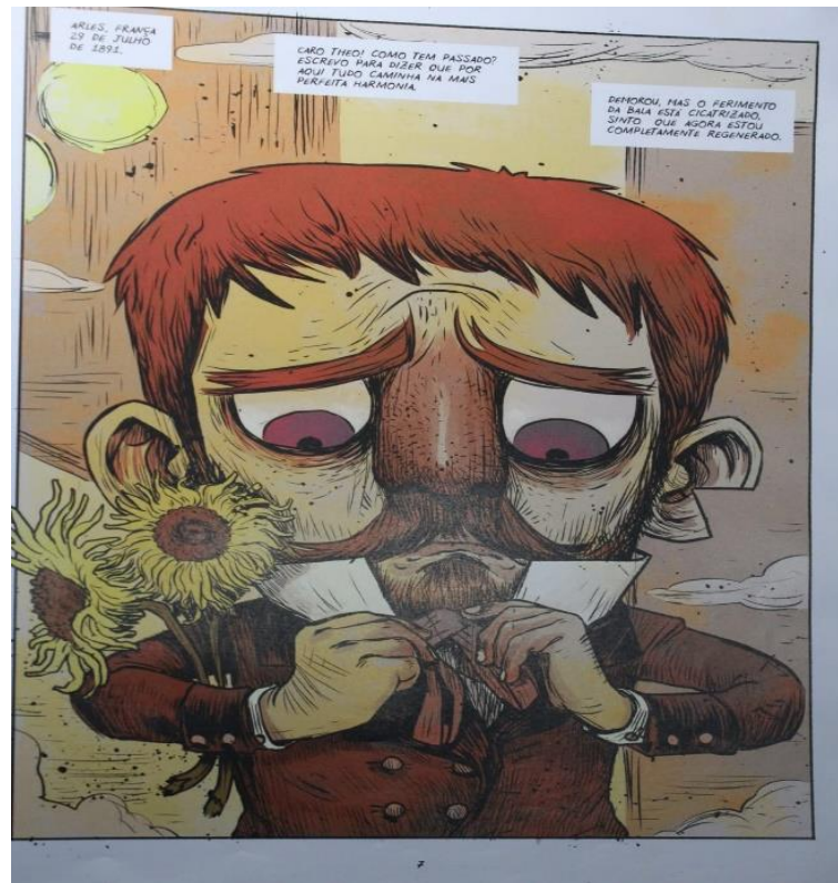
Figura 2. Uma noite em L'enfer , 2016, p. 7

Essa aparição já aponta para uma potencial diferença do romance Uma noite na taverna para a HQ, pois neste percebemos a presença de Van Gogh como protagonista definido, bem como uma mudança temporal expressiva. Já que no romance não havia nenhuma indicação sobre a localização ou tempo da narrativa; enquanto no quadrinho, o tempo e o espaço se definem, França, no ano de 1891, o que contrasta com o tempo indefinido do romance.