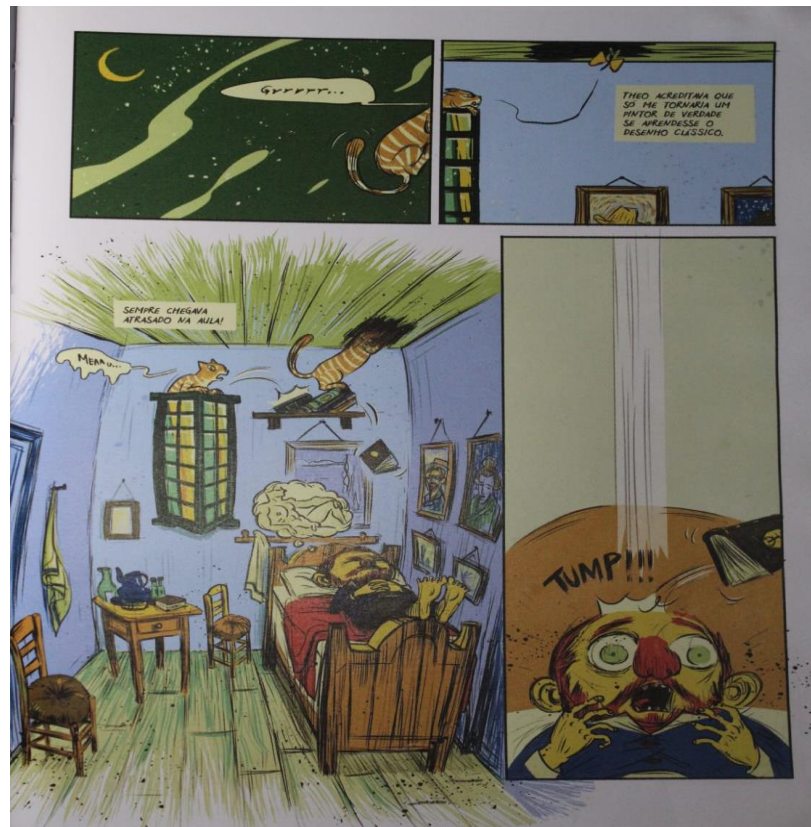
Figura 3. Uma noite em L'enfer , 2016, p. 35

Para exemplificar, na primeira evocação, temos uma referência a pintura de Vincent Van Gogh, o quarto, que aparece dentro das páginas do quadrinho como elemento do cenário. Então, a partir dos mecanismos dos quadrinhos, a pintura é simulada e dotada de uma nova função: o cenário em que a tensão vai ocorrer, como vemos na imagem a seguir: