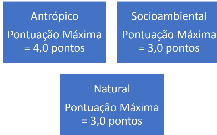
Diagrama da distribuição das notas dos indicadores de habitabilidade urbana

Indicadores com rank ruim : receberá 10% da sua pontuação máxima.