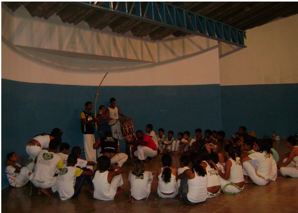
Foto 6. Roda de Capoeira Angola e aniversário de capoeirista na roda. Concha Acústica no bairro da Missão.