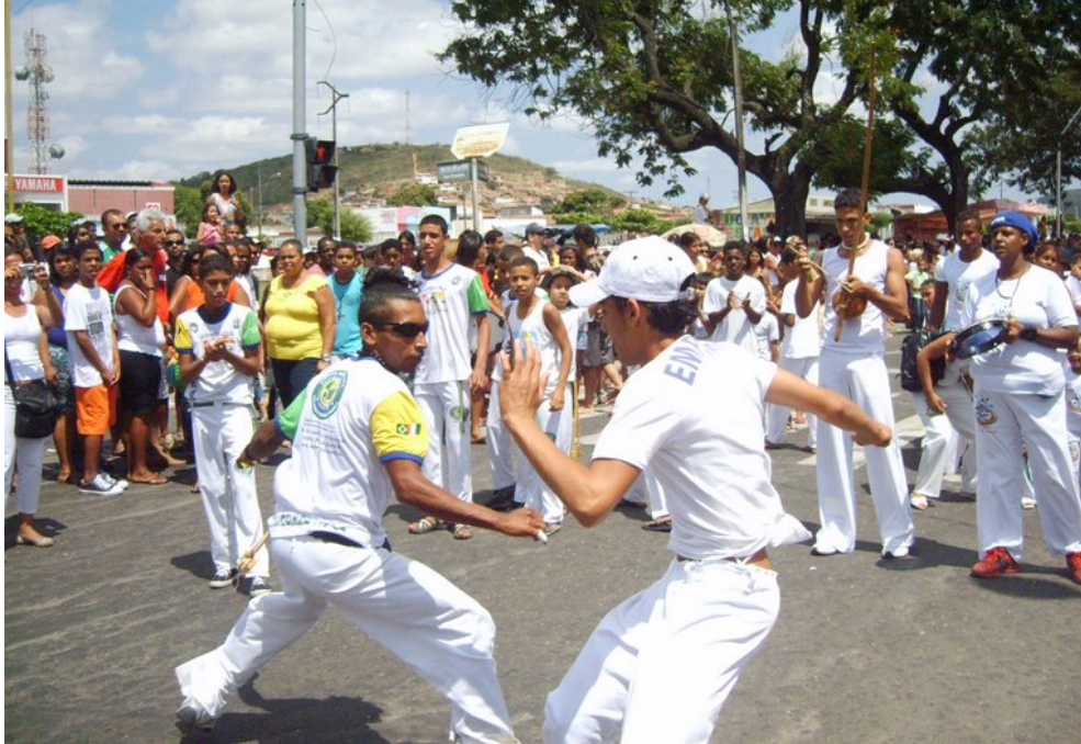
Foto 3. Desfile Cívico do dia 7 de Setembro em Jacobina.