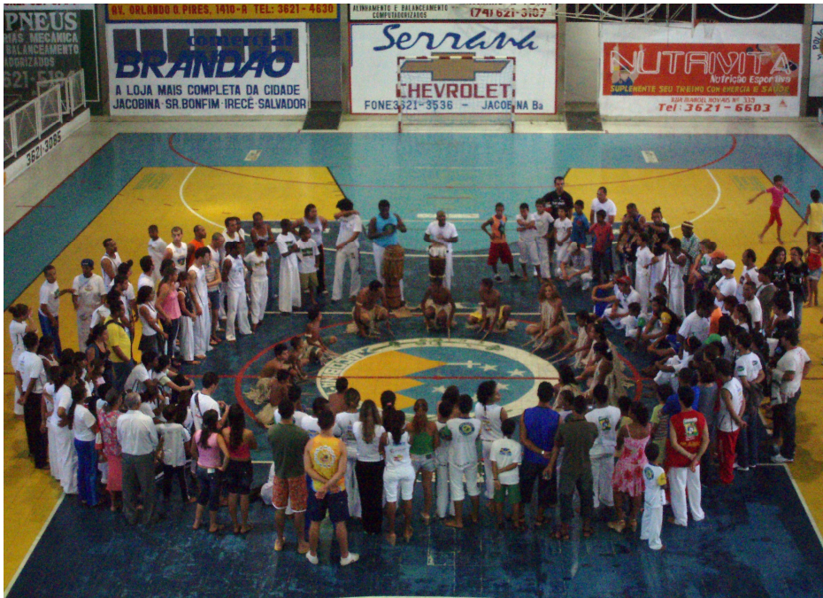
Foto 1. 1º Encontro de Capoeira de Jacobina e Região.