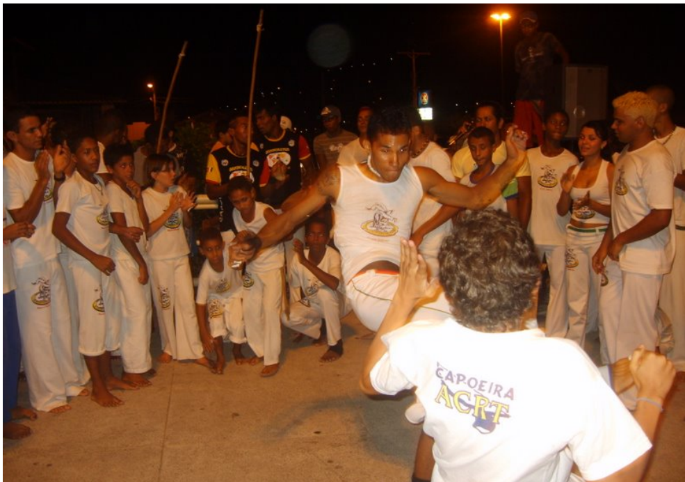
Foto 4. Roda de Capoeira na Praça da Missão em Jacobina.