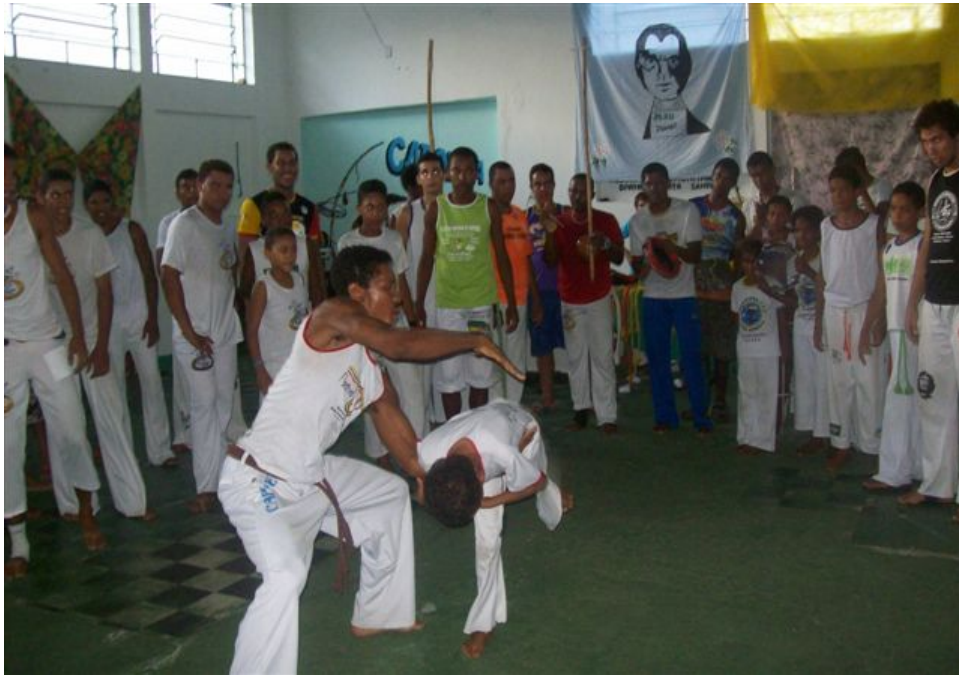
Foto 5. Aulas de Capoeira no Quilombo Erê. Fonte: Contra Mestre Jack Chan. Grupo de Capoeira Pastoral Afro Quilombo Erê 2008.