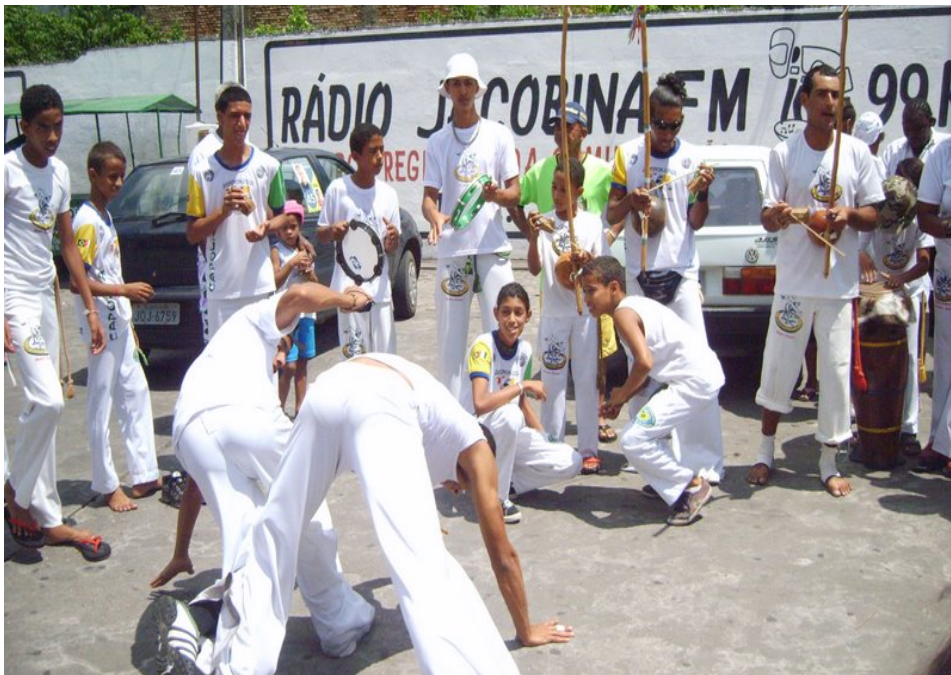
Foto 2. Roda de Capoeira na Praça da Matriz em Jacobina.