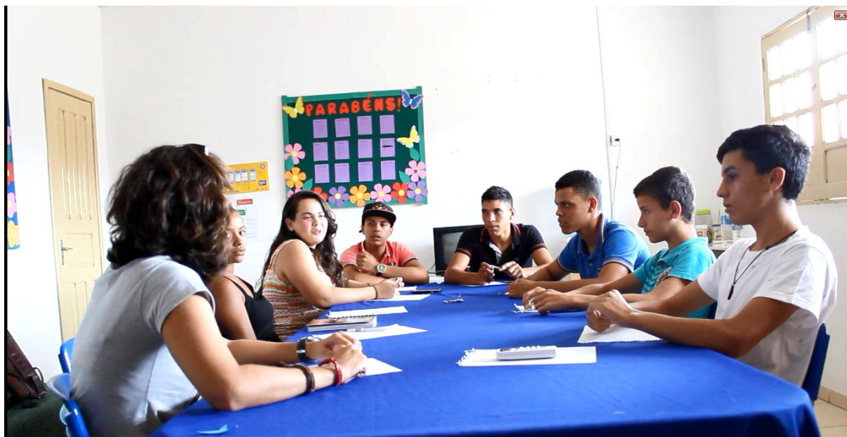
Figura 5 – Planejamento do Webdocumentário