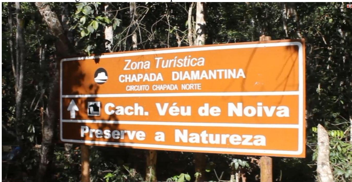
Figura 13 – Início da trilha para a Cachoeira Véu de Noiva

catalogadas na região. Iniciamos as filmagens, desde o momento que descemos do carro, conforme figura 13, percorrendo toda a trilha, filmando as árvores, o céu, os pássaros, até o nosso destino final: a cachoeira Véu de Noiva.