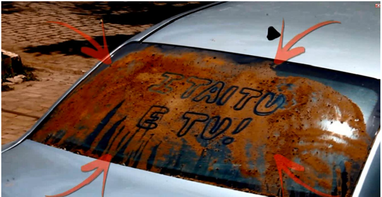
Figura 15 – Documentário introdução