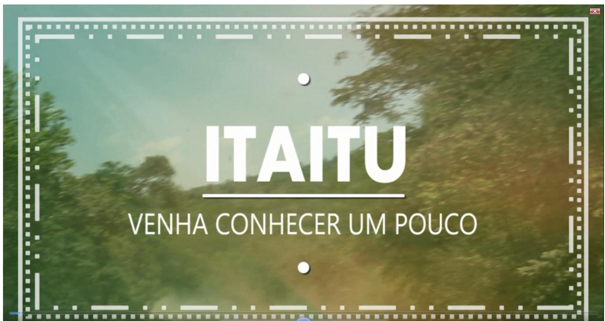
Figura 16 – Documentário história