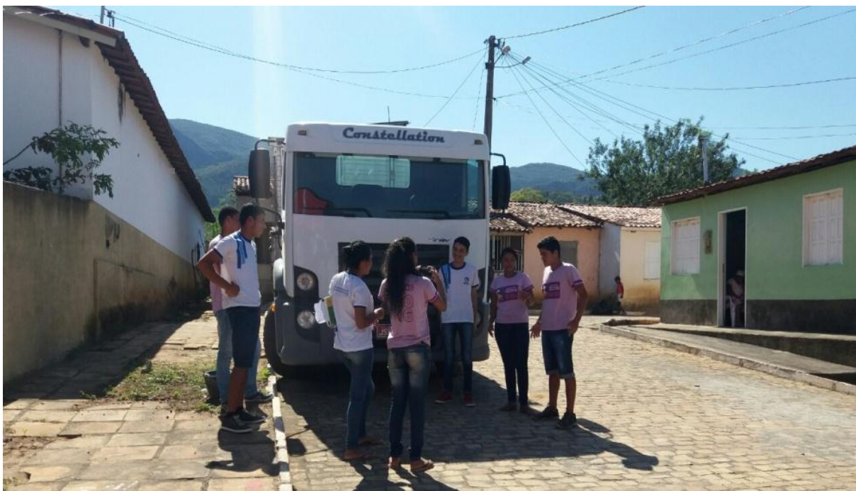
Figura 3 - Equipe 1 realizando a gravação da “rua de trás”