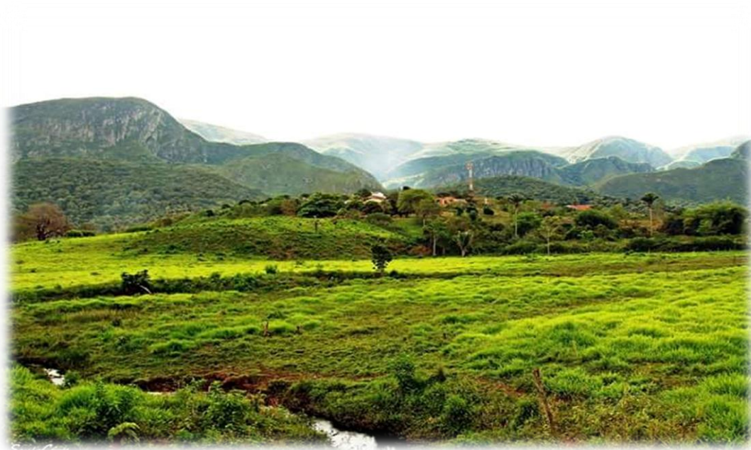
Figura 2 – Vista da Vila de Itaitu

O distrito de Itaitu (figura 2) fica a 27 Km da cidade de Jacobina sendo os 10 primeiros quilômetros percorridos por estrada asfaltada em boa conservação e os 17 Km restante percorridos por estrada de chão.