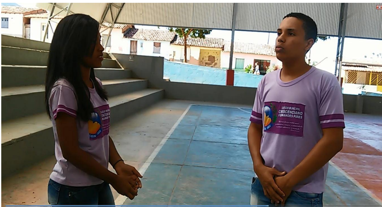
Figura 4 – Entrevista da Equipe 2

análises do seu entorno, de algo que viam, mas que ainda não tinham se dado conta, não tinham se despertado criticamente.