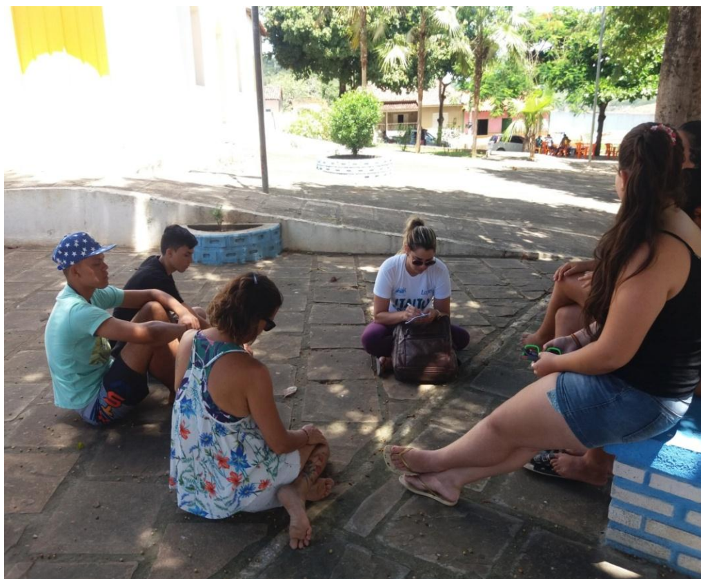
Figura 9: Roda de Conversa

Antes de sairmos para a realização das filmagens, fizemos uma roda de conversa, na praça local, para conferirmos o roteiro e fazermos os ajustes finais, conforme ilustrado na figura 9.