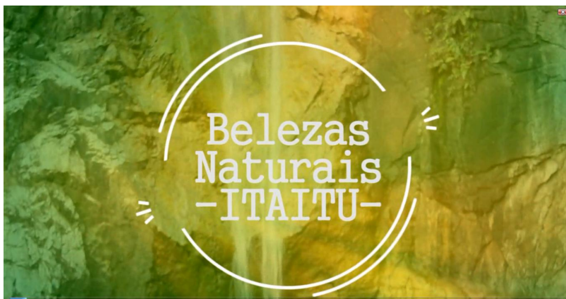
Figura 18 – Documentário “Belezas Naturais”

- Belezas naturais: Filme de 4'01", na trilha de acesso à cachoeira Vêu de Noiva e na própria cachoeira. Possui entrevista com o turista Marcelo Rocha – Figura 18.