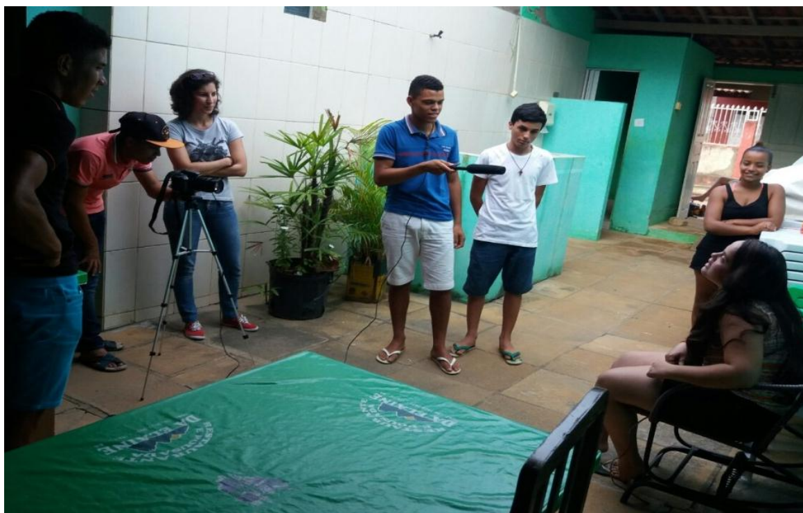
Figura 6 – Manuseio de Equipamentos

Foi a vez agora desses alunos manusearem as câmeras e os equipamentos de apoio (tripé, microfone), saindo pelas ruas filmando, entrevistando, testando ângulos, enquadramentos, planos e movimentos da câmera, conforme visto na aula teórica e ilustrado na figura 6.